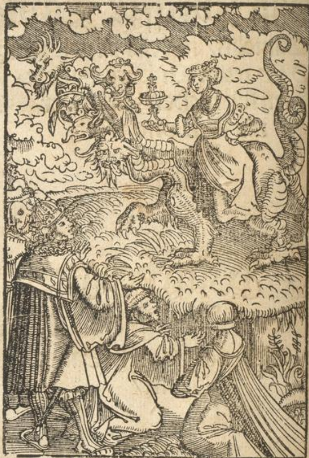
Das Antichristlich Reich / des Pappsts zu Rom.

Die grosse Babylon / die Mutter der Hurcrey/ vnd aller Grewel auff Erden.