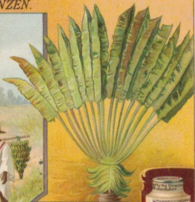
FÄCHERBANANE, RAWENALA. MADAGASKAR.