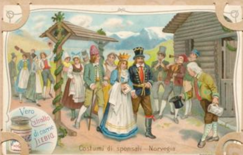
Costumi di sponsali - Norvegia.