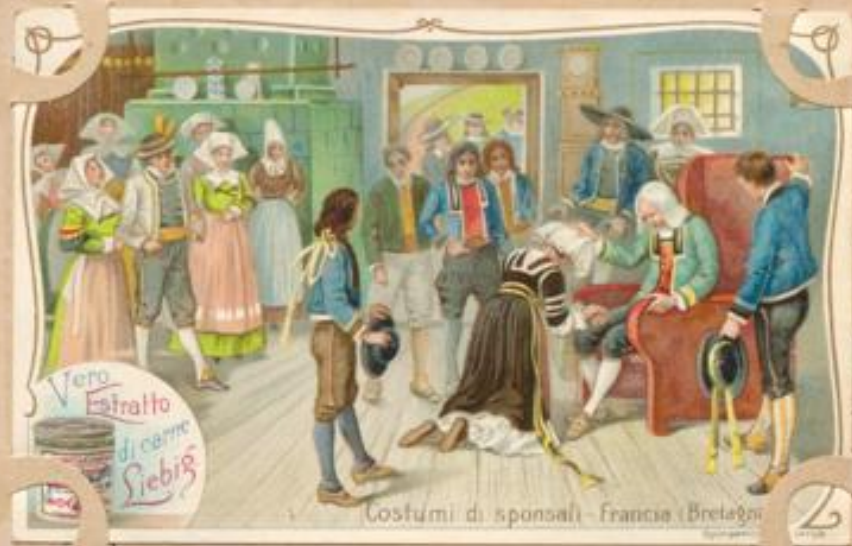
Costumi di sponsali - Francia (Bretagna).