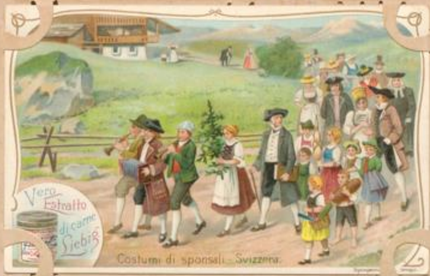
Costumi di sponsali - Svizzera.