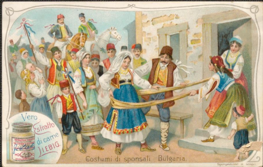
Costumi di sponsali - Bulgaria.