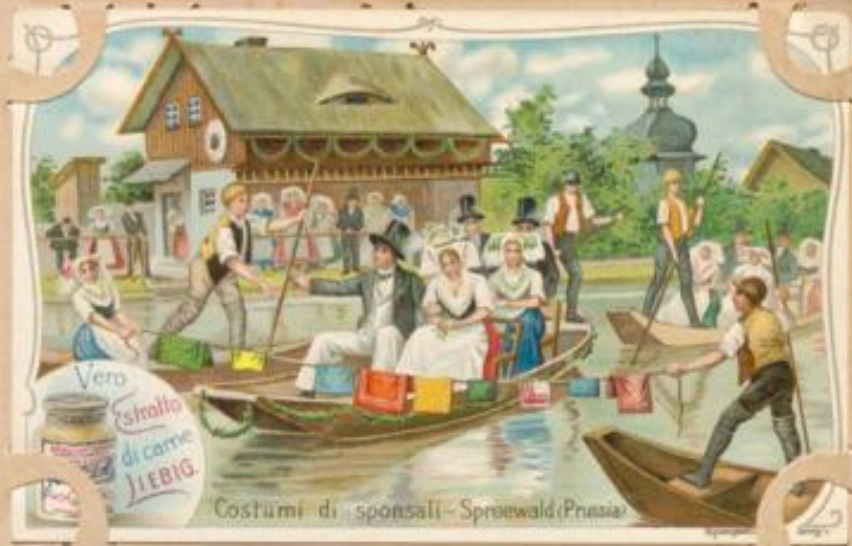
Costumi di sponsali - Spreewald (Prussia).