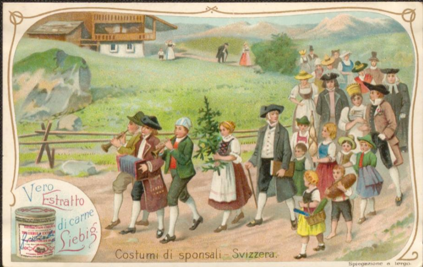
Costumi di sponsali - Svizzera.