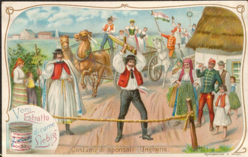
Costumi di sponsali - Ungheria.