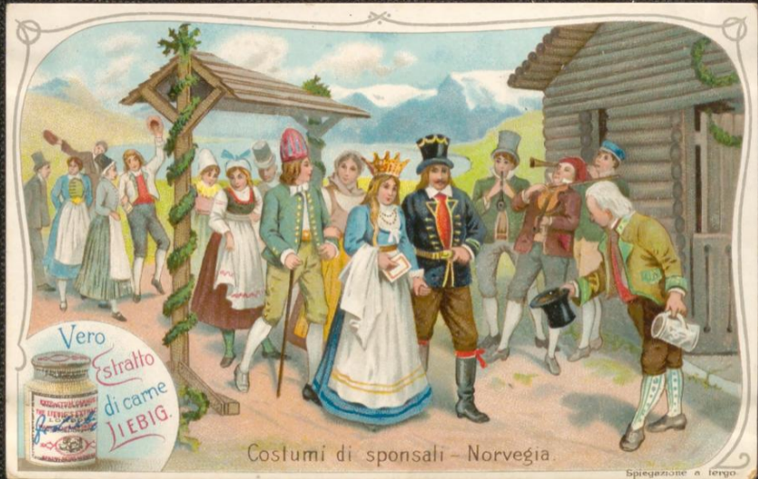
Costumi di sponsali - Norvegia.