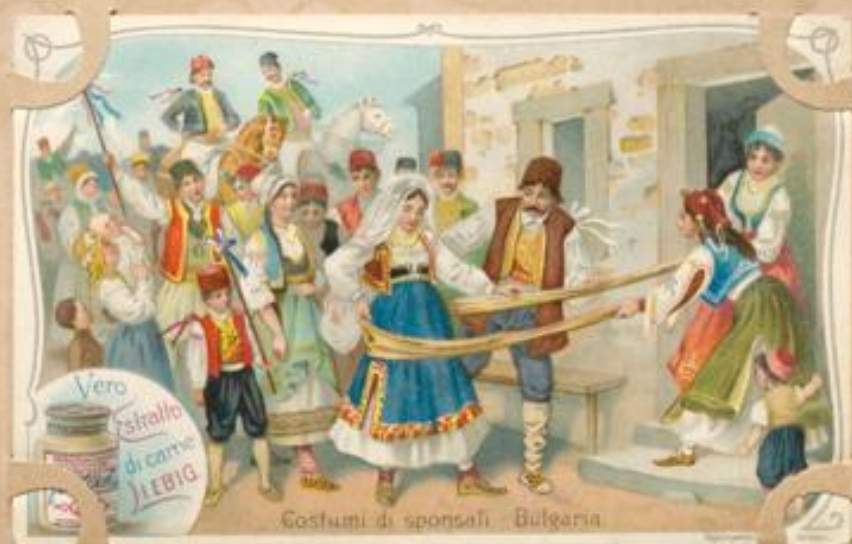
Costumi di sponsali - Bulgaria.