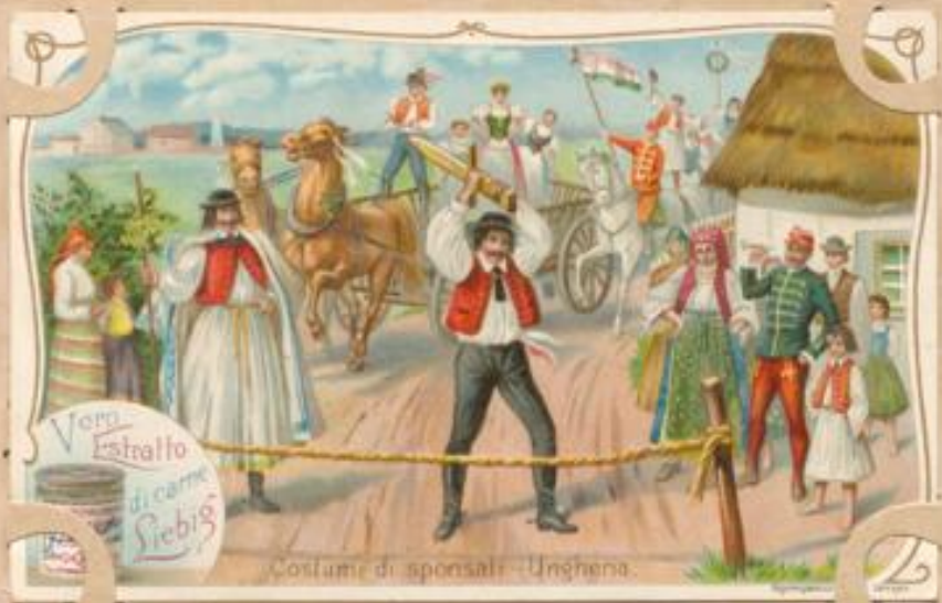
Costumi di sponsali - Unghera.