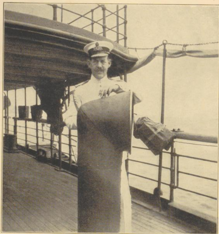
König Konstantin auf dem Schiff „Sphacteria“ bei der Abfahrt von Griechenland