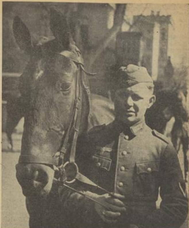
Zum Pferdeappell angetreten. Werden Sie die Prüfung bestehen?

Die Betreuung dieser vierbeinigen Kameraden durch unsere Feldgrauen muß in jeder Weise als vorbildlich bezeichnet werden. Und wie eine solche Betreuung erfolgt, wird