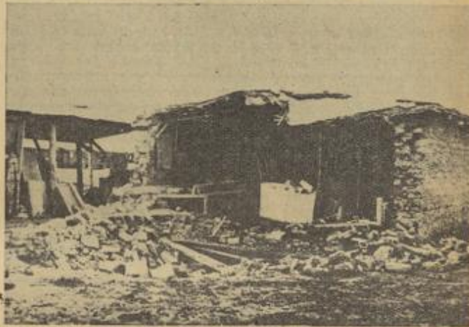
Erste Originalaufnahme von dem furchtbaren Erdbeben in der Türkei. Ein völlig zerstörtes Wohnhaus in einem Vorort von Erzincan (2).

lesen wir dann auch, wie Joseph es dahin brachte, daß die Ägypter schließlich den ergreifenden Notschrei ausstießen: „Warum lässest du uns sterben vor dir und unser Feld? Kaufe uns und unser Land uns Brot, daß wir leibeigen sein dem Pharao.“ Das Bauernvolk mußte sich selber in die Leibeigenschaft anbieten, um nicht zu verhungern. „Also kaufte Joseph Pharao das ganze Ägypten“.