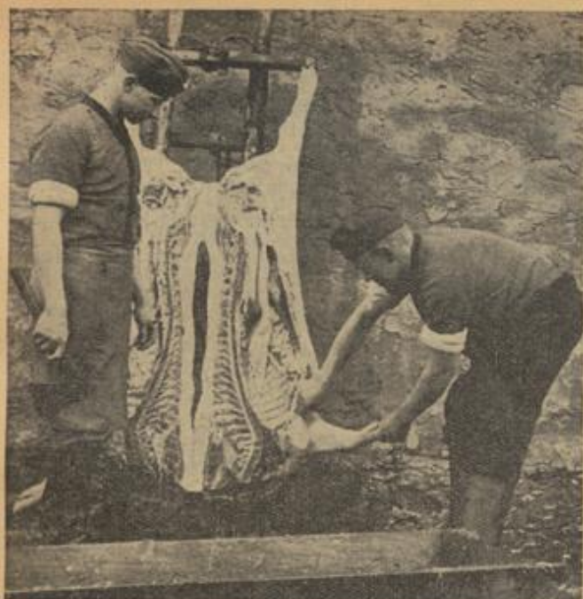
Sie haben Schwein gehabt... daß Sie bei einem Bauern in Quartier liegen, dem Sie beim Hauschlachten helfen können, denn sicherlich fällt für die Helfer ein tüchtiges Stück ab.