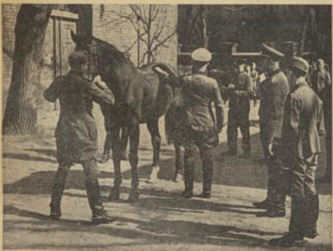
Der große Moment: Der Pfleger führt sein Pferd vor. Der Kommandant überzeugt sich persönlich vom Wohlbefinden seiner Schutzbefohlenen

gerade unsere Leser interessieren. Darüber schreibt ein Pst.-Berichterstatter, der einem Pferdeinspektionskommando und einem Pferdelazarett einen Besuch abgestattet hat, u. a. folgendes: Wohl mag der „Dienst am Pferde“ dem jungen Soldaten, der selber nach dem Exerzieren hundemüde in seinen Standort heimkehrt, oft hart ankommen, aber es ist die vornehmste Pflicht für seinen „Waffenkameraden“, der selbstlos alle seine Kräfte für ihn einsetzt. Mit Stalldienst beginnt daher auch der Morgen bei allen berittenen Truppenteilen, mit Tränken und Füttern, mit Streuaufräumen und Putzen. Stalldienst folgt den Reitstunden, dem Felddienst am Mittag, Stalldienst beschließt auch den Abend des Tages.