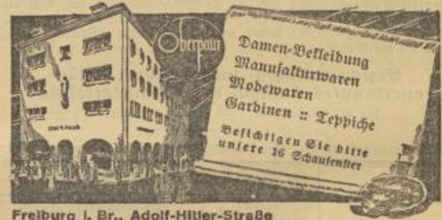
Freiburg i. Br., Adolf-Hitler-Straße