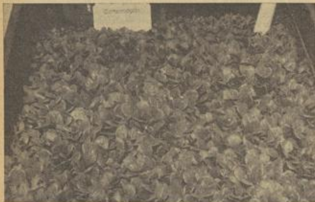
Dieses Saatbet war mit einem 3-4 Millimeter Gartenrohglas (kein Gartenfloraglas) bedeckt. Aufgenommen am 28. April, ausgefüt am 20. März.