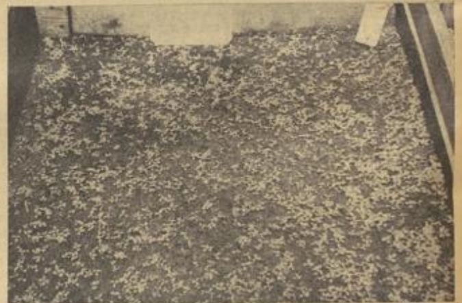
Dieses Saatbet war mit einem schlechten Delpapier bedeckt (7 Prozent Lichtdurchlässigkeit). Aufgenommen am 28. April, ausgefüt am 20. März.