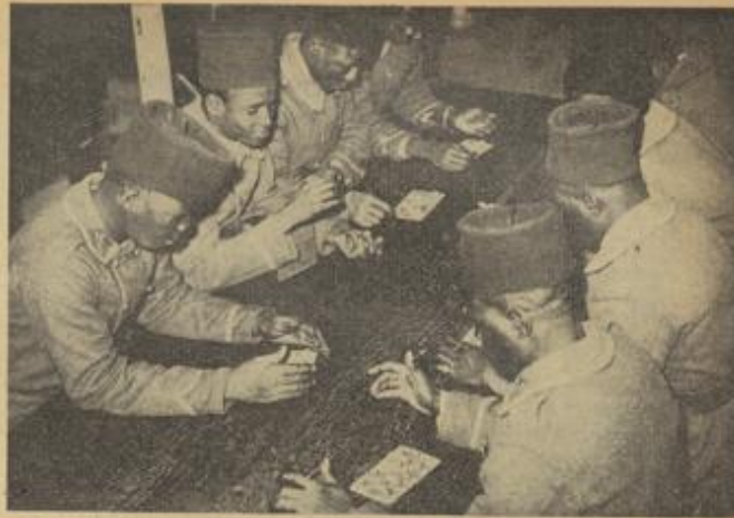
Auch die schwarzen Hiltstruppen sollen genau wie die Jugend Frankreichs wieder für britische Geld- und Wachtel in diesem Krieg der Engländer verbluten. Aber Votospiele ist ihnen offensichtlich lieber als der Tod für die britische „Annullation“, die der Klawerei zum Verwechseln ähnlich sieht.