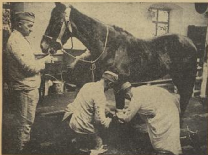
„Kriegskamerad Pferd“ im Lazarett. Das Tier hat sich am Bein verletzt und wird nun sorgsam behandelt. Aufn.: P. A. Garen, Weibild (3)