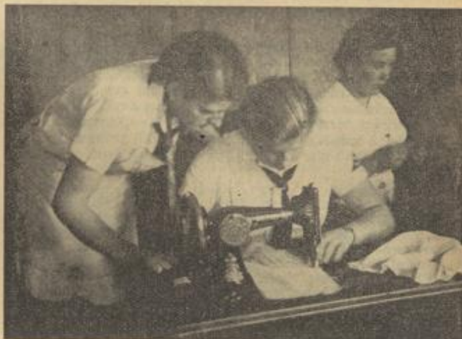
Eine Arbeitsgemeinschaft beim Nähen