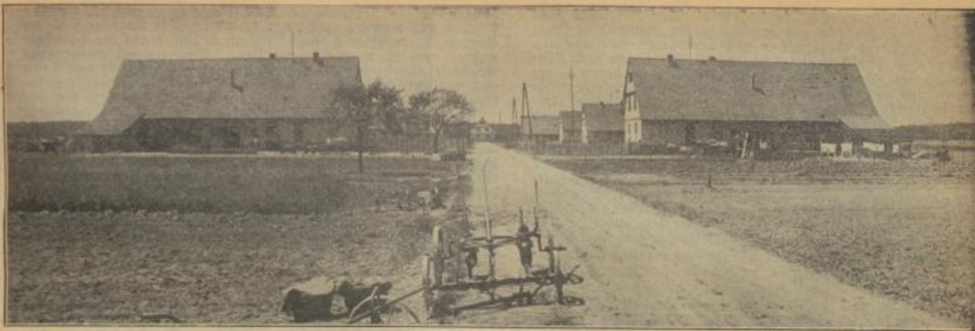
Neubauersiedlung Neuzitt bei Heidelberg