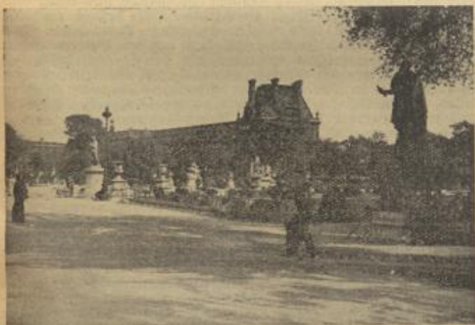
Zum feierlichen Einzug unserer Truppen in Paris. Blick auf das Louvre