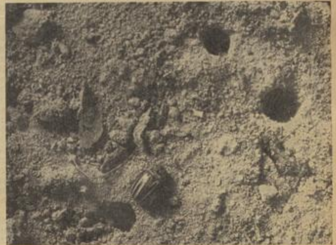
Käfer beim Verlassen des Bodens im Frühjahr

für das Landvolk eine ganz erhebliche Erleichterung, zumal in Gebieten mit gemischter ländlicher und städtischer Bevölkerung. Dort sind häufig Arbeitskräfte vorhanden, die den Erfordernissen des Krieges entsprechend noch nicht richtig eingeseht sind. Beamte, Angestellte im Ruhestand, Handwerker, Angehörige freier Berufe und vor allem Frauen mit kinderlosem oder kleinem Haushalt, sie alle sollten bedenken, wie schwer der Bauer und Landwirt zu arbeiten hat und sollten daher gern einige freie Stunden opfern, um am Suchdienst teilzunehmen. Im Grenzland Baden ist allgemein bekannt, wie der Suchdienst durchgeföhrt werden muß, doch sollen hier einige wichtige Punkte nochmals herausgestellt werden: