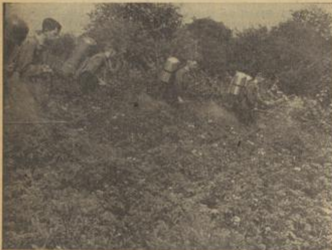
Vorforgliches Spritzen der Kartoffelkäfer

Das Gesetz schreibt die Durchführung eines regelmäßigen Suchdienstes vor. Während jedoch bisher nur die Rufberechtigten der mit Kartoffeln beplanten Grundstücke am Suchdienst teilzunehmen hatten, kann jetzt der Bürgermeister, der für Einrichtung und Durchführung des Suchdienstes verantwortlich ist, auf Grund der kürzlich erlassenen VIII. Verordnung zur Abwehr des Kartoffelkäfers auch andere Personen zum Suchen heranziehen. Das bedeutet