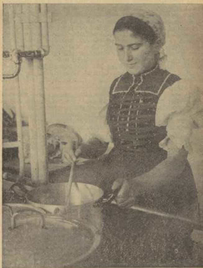
Praktische Schulung im Kochen