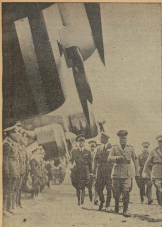
Italiens Wehrmacht marschieren mit den deutschen Kameraden, der Duce bei den Fliegern.

Es war wohl in den Jahren nationalsozialistischen Aufbaus von größter Wichtigkeit, alle Mädchen, auch die älteren unter ihnen, in den Heimabenden weltanschaulich und politisch zu schulen, denn nur das Mädchen kann ja mit Ueberzeugung der Führung folgen und sich tatkräftig einsetzen, das sich über die Ziele der Führung restlos im klaren ist. Die Mädchen, die nach der Machtübernahme zunächst in der Kükenschar, dann bei den Jungmädels standen und jetzt im B.D.M. sind, haben diese Schulung bereits in den ersten Dienstjahren von Grund auf mitbekommen. Da war es nun notwendig geworden, für die Mädchen, die noch zu jung sind für die Frauenschaft, aber doch schon über die bisherigen Aufgaben des B.D.M. hinausgewachsen waren, einen neuen Dienstplan herauszustellen. Es wurde das B.D.M.-Werk „Glaube und Schönheit“ ins Leben gerufen, durch