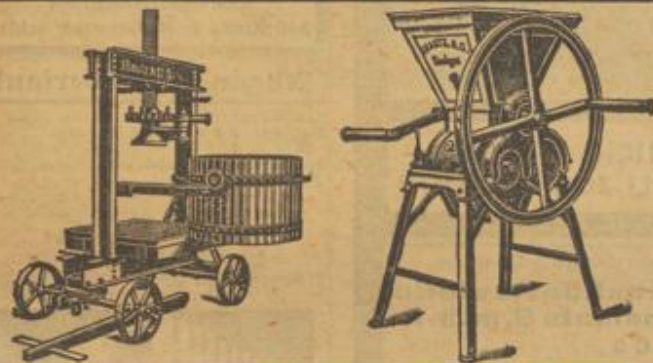
Obstpressen und Obstmühlen in allen Größen.