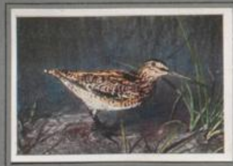
Die Bekassine (Gallinago gallinago)

Daß sie kommen sie! In der Dämmerung gaukeln sie wie dunkle Schatten über den Jungwuchs dahin. Hastig geht die Jagd, bald über die Wälder, dann das Gestell hinaus, biszul über die Blöße, und ein seltsames Quorren, Murraan und Pultzen erklingt — die Schnepfen ziehen nach Nord- und. Mänsche bislaan im Lande und schreiten in gerä- reichen Waldungen zur Brut. Im Herbst schleicht sie sich den nördlichen Hochwäldern an zur Fahrt nach dem Süden.