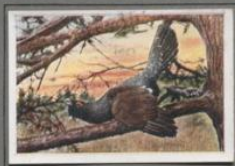
Der Auerhahn ( Tetrao urogallus )

Dunkel ist die Aprilnacht, der Wind staut. Da rauscht's in den Lüften, und in der sperrigen Kiefer am Berghang schwingt sich der Urhahn aus. — Ein heiserer, krähen- der Ton — dann tiefe Stille! — Und dann ein Knarren, scharf und metallisch — und wieder ist's still! „Klapp, klapp...“ ein leises Lied — ein trillerndes Wirbeln — ein glückseliges Klackern — ein hässliches Wetzen in steter Folge, ein uriges Liebslied, bis der Himmel sich rüdt und der Sänger verstummt. —