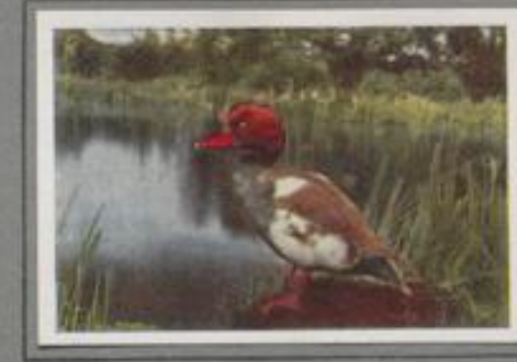
Die Kolbenente ( Netta rufina )

In der Gesellschaft der nördlichen Enten, die während des Winters unsere Küstengewässer bevölkern, befindet sich stets die Hühnerente. Sie ist ein hochnördlicher Vogel. Ihr Brutgebiet reicht bis zu den Inseln an der Grenze des ewigen Eises im arktischen Meer. Durch ihren hehrlichen Ruf und durch die auffallenden Schmuckfedern der Männchen hebt sie sich aus dem Schwarm der übrigen Verwandten hervor.