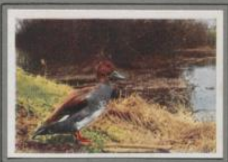
Die Schnatterente ( Anas strepera )

Knäk- und Krickente sind unsere kleinsten Schwimmenten. Beide sind vorzügliche Flieger. Plötzlich sausen sie dahin und vollführen im rasenden Fluge geschickte Wendungen. Die Knäkente bevorzugt zum Aufenthaltsort Gräben im sumpfigen Gelände, in Kleen, Bruch und Luch. Dort hört man in der Reizzeit den quackernden Ruf der Erpel. Hier brüten sie und verüben sie den Sommer, im Herbst ziehen die meisten ins Mittelmeergebiet, nur wenige bleiben der Heimat treu.