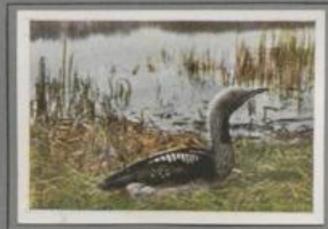
Der Polartaucher (Colymbus arcticus)

Auf jedem größeren See ist der Haubentaucher; er fällt selbst dem Unkundigen auf. Der Körper des Vogels ruht tief im Wasser, der Hals wird senkrecht getragen, die Haube ist eigenartig schön. Im Schilfrande des Sees brütet das Weibchen. Die Jungen — wie Frischlinge gestreift — folgen sofort der Mutter. Dicht drängt sich das kleine Volk zur Alten, und oft nimmt sie die ermatteten Kleinen auf den Rücken. Das Schiff mit der dreifachen Besetzung bietet ein allerliebtes Bild.