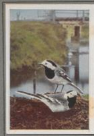
Die weiße Bachstelze ( Motacilla alba )

Wo ein klara, munteres Bächlein zwischen bewaldeten Ufern im Berglande zu Tal raschelt, ist die Gebirgsstelze zu finden. Das Männchen im Hochzeitskleide ist ein sehr schöner Vogel. Wie glänzt die linschwarze Kehle, wie leuchtet die schwefelgelbe Brust! Mit der Wassermusik halten die Stelzchen gute Nachbarschaft, und jeder Beobachter freut sich ihres Anblicks. — Zierliche Vögel sind's, aber wetterhart, selbst im Winter bleiben stütze bei uns.