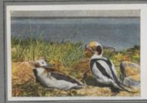
Die Eisente ( Harelda hyemalis )

Zu den nördlichen Enten gehört auch die Schellente. Der Erpel im Prachtkleid ist leicht erkennlich an dem weißen, leuchtenden Fleck dicht hinter dem Schnabel. Diese Ente erkrüdet in hohen Bäumen, Astlöchern und Senkrechten ihre zahlreiche Nachkommenschaft. Es ist erstaunlich, wie dieser schnelle Flieger geschickt in das Flugloch streicht. Die gewandten Jungen wagen bald nach dem Schlüpfen aus 5—6 m Höhe den Sprung in die Tiefe.