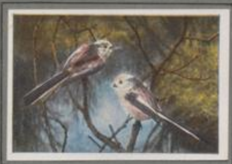
Die Schwanzmeise (Aegithalos caudatus)

Der Frühling ist im Walde, er grünt und blüht, es trillert und singt. Wie Kebside tumen die Tannenmeisen in ihrem schwarzen Kopfputz, des weißen Backen und azublauen Mänteln — kopfüber, kopfunter — im Fichtengerweh, und ihr feststimmiges „Sitt, sitt-sitt, sitt, sitt“, ziesel als Liebessied zur Erde. So vergehen die Tage mit Singen und Suchen, bis die neht Jungen im Neste gieren und zur stillen, ewigen Arbeit mahnen.