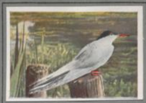
Die Flußseeschwalbe ( Sterna hirundo )

Auf der Insel in dem Landsee ist Besuch angekommen, die Lachmöwen sind da! Über tausend Paare gackeln wie Schneeflocken im Wind über dem Eiland. Häßlich ist ihr Ruf, hübsch ist ihr Kleid. Über dem Kopf haben sie eine kaffeebraune Mütze gezogen, und Ständer und Schnabel sind leuchtend rot. Die Weibchen legen, doch man nimmt ihnen die Eier; erst Ende Mai gestaltet man ihnen die Brut. — Viele verbringen den Winter im Lande, die meisten ziehen südwestwärts.