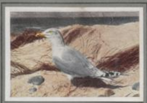
Die Silbermöwe ( Larus argentatus )

Der prächtige Vogel brütet in Deutschland nur auf den Nordseeeisen. In den Dänen auf der Herdofte Sct's nistet er seit undenklichen Zeiten; die Zahl der Brutpaare nimmt allerdings ab. Die Vogelkolonien auf Bornholm und Langeland beherbergen noch bedeutende Mengen. Nach der Brutzeit streicht die Silbermöwe weit umher bis tief ins Binnenland. Aus den nördlichen Gebieten kommt sie im Herbst in Scharen zugewandert, dort nistet sie in großer Zahl.