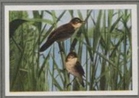
Der Teichrohrsänger ( Acrocephalus streperus )

Unter Blüten im schilfumrahmten Tümpel, Mücken spielen über dem Wasser, Enten queren, Klebitze ruhen. — Der Teichrohrsänger ist zurückgekehrt, und ebenfalls er noch steinblau ist, versucht er sich in verworrenen Wasser. Vom Morgen bis tief in den Abend hinein schnarrt und knarrt er im Rhythmus. Und immer wieder klingt's aus der Schilfdickung: „Tiri, tiri, tiri, tier, tier, tier, zack, zack, zack, zack-tiri, tiri, tiri, scherz, scherz, häß, häß, hi, hi, hi, hi“ in hundert Folgen.