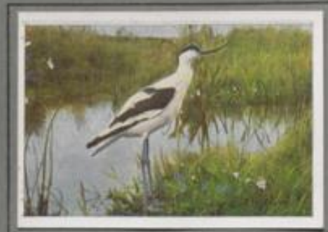
Der Sabelschnäbler ( Recurvirostra avosetta )

Dieser Bewohner der Küsten des Nordens und Ostens kommt auch auf Rügen und den benachbarten Inseln als Brutvogel vor. Er ist ein echter Strandvogel. In dem Gebiet, das das Meer umwirft, findet er seine Nahrung: Kerbtiere, Muscheln, Krebse und Insekten. Auf dem Vorland zwischen Strandhalm und Geröll brütet er im Juni/Juli. Die Jungen sind Hornstrand, dann geht's nach Afrika.