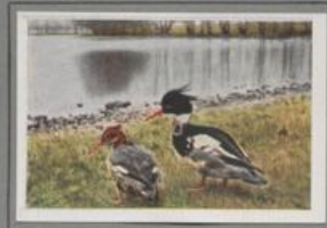
Der Mittelsäger (Mergus serrator)

Der Gänsesäger, der sich durch seinen gebogenen Schnabel von den Enten unterscheidet, brütet in Nordeuropa und Asien, er nistet aber auch in Deutschland. Wie die Schwelente, ist auch er Höhlenbrüter. Mit Vorliebe wählt die Weibchen hohle Kopfweiden als Nistplatz. Im ersten Jahr ist das Geschlecht der Säger noch nicht nach dem Federkleid bestimmbar, sie sehen sich zum Verwechseln ähnlich. Erst im zweiten Jahre legen die Männchen das Prachtkleid an.