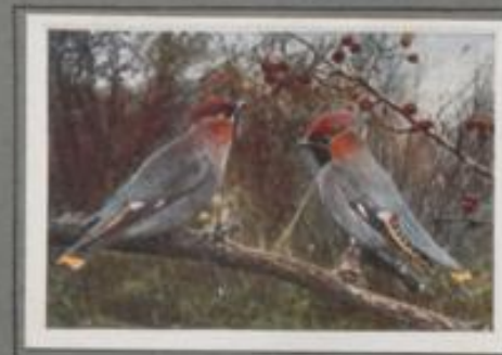
Der Seidenschwanz ( Bombycilla garrula )

Der Neuntöter ist im Volk in Verruf geraten. Er gilt bei vielen als Wüstling, ein unedelmütiger Mörder, der tötet, was er bewegen kann. Er mehr tötet, als er versetzt. In dem Schicksal beim Nest ist seine Vorratskammer. Auf Dornen sind Käfer, Raizen, Würmer, ein kleiner Frosch und eine Spitzmaus gespickt. Vornehmlich findet man auch einen Jungvogel, den ein Entarteter schlug. Um diese Tat wird die ganze Stupe verdummt.