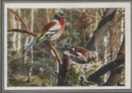
Der Buchfink ( Fringilla coelebs )

Zur Frühjahrszeit hört man an allen Orten das Buchfinkenlied. Es ertönt vom Obstbaum im Garten, aus der Buche am Waldesrande, aus dem Buschwerk am Bach. Dort finden die hübschen Vögel ein Plätzchen für ihr kunstvolles Nest. Außen umspinnen sie's mit Flechten und Moos. Innen polstern sie's weich und warm. Im Hochsommer brüten sie zum zweiten Male. Im Herbst ziehen die Buchfinken zum Süden, doch manche Männchen bleiben und überleben die karge Winterzeit.