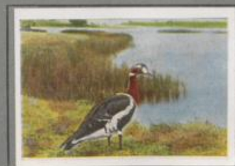
Die Rothalsgans (Branta ruficollis)

Im Spätherbst tritt diese kleine Meersee in riesigen Schwärmen aus dem arktischen Brutgebiet auf den Flachwasser zwischen den Nordmeeren und im westlichen Teil der Ostsee ein. Als Stimmäußerung hört man von ihr ein ruhiges, helles „Ruk, ruk“ oder „Rut, rut“, man nennt sie deshalb im Friesenlande „Ruttgänse“. Zu Tausenden suchen sie ihre Nahrung im weiten Watt, und man gewinnt den Eindruck, als wenn die Schilffläche mit Kalksteinen belegt wäre.