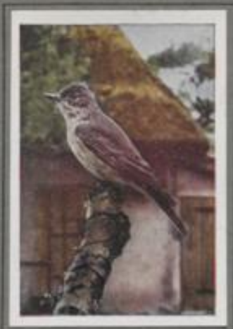
Der graue Fliegenschnäpper ( Muscicapa grisola )

Er ist neben dem Goldhähnchen der kleinste europäische Vogel und oben so lustig, hoch und flink wie der Zaunkönig. Durch seine Lechhaftigkeit und seinen Gesang ruft er sich dem Bauarbeiter. Mit hoher Stimme lockt er: „Hüt, hüt“. Dann folgt eine sonderbare Tentäne in abgebrochenen Silben: „Düm, düm, düm, düm, düm“. Mit einem heiseren „Hedest!“ schließt sein Schalmersied. — Singen, schlüpfen, schwärzen, kucken, das ist seine Tagesbeschäftigung, und daneben findet er noch Zeit zur Insektenzucht.