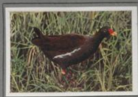
Das grüntüfige Teichhuhn ( Gallinula chloropus )

Es führt im Rohrwald ein verborgenes Dasein, verrät sich aber durch seinen Ruf „Körk, körk“ oder „Kurr, kurr“. Die Schlüsselsteine bietet ihm alles, was das Leben verlangt: Nahrung in Hülsen und Fische, dazu einen sicheren Brutplatz. Die Nester sind oft unordentlich, die Jungen aber lieblich. Die Nester sind oft unordentlich, die Jungen aber lieblich. Die Nester sind oft unordentlich, die Jungen aber lieblich. Der Herbst führt sie südwärts, nur wenige bleiben im Lande.