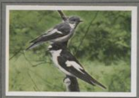
Der Trauerfliegenschnäpper ( Muscicapa atricapilla )

Er ist ein unscheinbarer, grauer Vogel und überall verbreitet in Stadt und Land. Durch seinen piepsenden Gesang kann er nicht beglücken, wohl aber durch seinen geschickten Schwebeflug bei der Fliegenjagd. Er ist ein reiner Insektenfresser — ein Fliegenschnäpper! — Als Nistkastenbrüter wählt er für seine Wechsellage oft die Spaltenwände am Hause, denn wieder Mauerröcher oder die Öffnungen in den Köpfen der Wälder und Kugelakazien. Das Steigrohr der Hefpumpe, die aufgehängte Gießkanne beim Klänsel, selbst der offene Armel der Vegetationscheuche im Erdbeerort wird von ihm als Kinderstube benutzt.