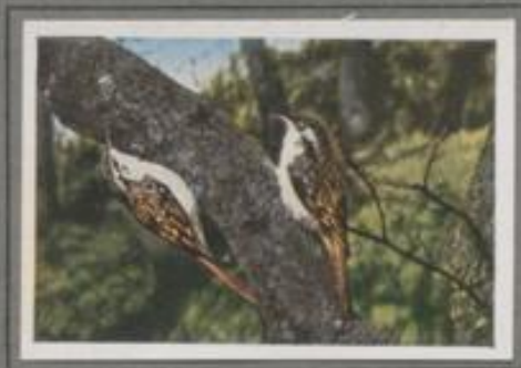
Der Baumläufer ( Certhia familiaris )

Die kleine Majestät ist ein witterbarer Bursche. Das dicke Gefieder schützt gegen die grimmigste Kälte. Sie durchstößt die Schieferwände, und der dünne Schneebeliegt die überwinternden Kerbtierchen, Larven und Puppen aus den Häuten und Zäusen. Nahrungsmangel kennt sie kaum, deshalb zwitschert sie selbst mitten im Winter vergeblich ihr Lied. Juchzend und jubelnd aber erklingen ihre Stroschen, wenn die Lärche zur Frühjahrszeit das kleine Herz erfaßt. Wenn aber ein Feind sich nähert, zerrt und kramt der Gnom. — Ja, ja, den Kleinen steigt's gar schnell ins Köpfchen! —