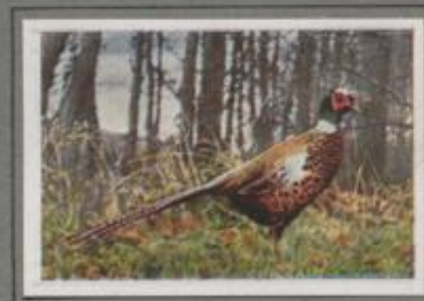
Der Fasan ( Phasianus mongolicus )

Blutrot verliert die Sonne im Westen, der Tau legt sich aufs Feld. Kaka Lütchen regt sich, schwillt leise und still. Am Osthorizont steigt der Mond an, und er schickt sein Süßericht auf die schlafende Flur. Da rufft's am Feld- rande „Plo-plo-plo, picco-picco“ wohl zehnmal und mehr, und eine weiche, dritte Stimme gibt Antwort. Die Wachtel schlägt, schlägt rasche bis Mitternacht. Und wer es hört, der kennt den Schritt und horcht auf den pösel- vollen Ruf, der heute so selten erklingt.