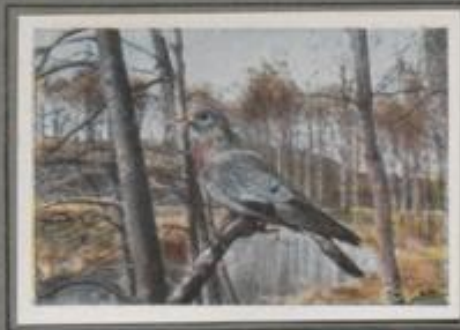
Die Hohлтаube ( Columba oenas )

In der Buche am hohen Ufer des Wiesentales fließt die Ringeltaube. Sie verläßt ihren Sitz und klappert mit hartem Flügelchlag zum Fichtenherd der Feidhütung. Auf dem obersten Astreis einer Tanne fällt sie ein und ihr ruckender Ruf, ihr melodisches „Gru-gruh, gru-gruh, gru-gruh“ löst durch den Frühlingsmerges. Der Tauber ruft sein Weibchen! Sie streicht herzu, und beide schwebeln sich zärtlich. Dann zeigt das Männchen der Liebsten seine Flugkünste.