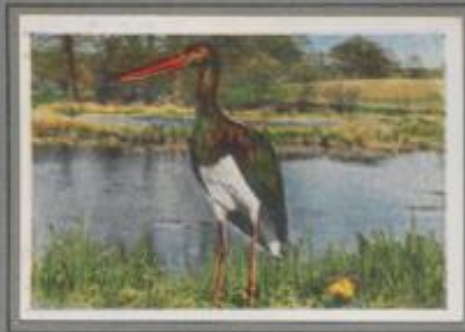
Der Waldstorch (Ciconia nigra)

Der Storch ist angekommen! Klappernd begrüßt er das stille Dorf in der Fluchiederung. Die Kinder jubeln ihm zu. Die Hausmütter sehen ihn gern auf der First; denn nach dem Volksglauben wird er als Glückbringer betrachtet, der das Feuer kühlt, der die Blitzesfahr abwendet, wenn an schwülen Tagen schwarz Gewitter über der Landschaft toben. — Früher brütete er in großer Zahl in den Dörfern des Flachlandes, heut' wird er seltener von Jahr zu Jahr.