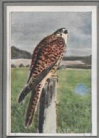
Der Turmfalke ( Falco tinnunculus )

An dem ersten der sieben Frühlingsstage kam der Milan ins Land. Der langschwänzige Vogel mit dem tiefgebogenen Stoß kreuzte mit gelbem Weichen in Wellenlinie. Tapferlang vollführte das Pärchen seine Fluppelrie, endlich schritt es zur Brut. Die Jungen wuchsen heran. Von nun an ließ es für die Alten flüchtig jagten. Manche Maus wurde geschlagen, manches Rebhuhn erschreckt, und die Küken von Huhn und Gans aus den Gehöften hatten schwer zu leiden.