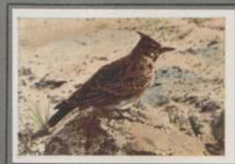
Die HaubenLERCHE ( Galerida cristata )

Der Ostmonat rüzt sich, der Märzmorgen erwacht, es steigen die Lerchen mit zitterndem Flügel Schlag anpor und jubeln ihr Lied. Nur wägen Töne sind's, und doch wirkt der Vortrag bezaubernd. Bald klingl's wie ein Schluchzen, dann wie ein freies Jauchzen und darauf wie ein lustiges Wirbeln und Trillern. Heil und weitklingend ist der Sang, unermüdlich sprudelt das Lied. Wenn aber der kleine Vogel aus der Höhe zur Erde sinkt, verstummt er, schiedet er aus dem Chor.