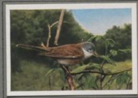
Die Dorngrasmücke (Sylvia cinerea)

Die Sperbergrasmücke ist die größte der Art und im zweiten Lebensjahre schwer an der Färbung zu erkennen. Das blaugraue Gefieder der Unterseite ist mit Wellenlinien gezeichnet, die Augenflecke sind braunrot gelb. Der kleine, harmlose Vogel gleicht aus im Aussehen dem Sperber — dem Strauchdieb und Vogeljäger — und erhebt deshalb den gleichen Namen. Im Frühling bevorzugt er während der Brutzeit buschreiche Orte, wie der Schwarz- und Weißdorn wuchert. In seiner Nachbarschaft ist häufig der rotrückige Würger zu finden.