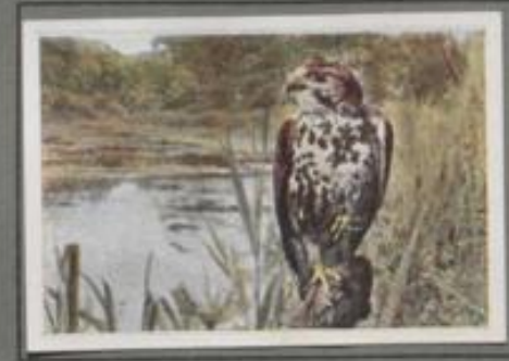
Der Würgfalk (Falco cherrug)

Auf Grödelands Schneehalden und in islands Einöden ist der erachtliche Gertfalk heimisch, den man im Mittelalter bereits als den ersten Beizvogel schätzte und der von jagdliebenden Fürsten und Herren gern gekauft und hoch bezahlt wurde. In Deutschland ist er ein sehr seltener Wintergast, der bei anhaltenden Stürmen verstreut nach dort verschleppt wird. Meistens sind es Jungvögel, die nach langer Irrfahrt hier landen.