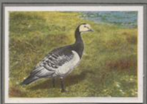
Die Nennengans (Branta leucopsis)

Auch sie ist ein Brutvogel des Nordens. Auf ihrer Herbstwanderung folgt sie den Küsten und nährt sich hier von Salzpflanzen und Kleintieren. Sie ist kenntlich an der auffallend weißen Stirn, der schwarz-weißen Querbänderung auf der Unterseite und an ihrem eigenartigen Ruf. Die Gans, wie „Kikikikik“ klingende Stimme ist mit keinem anderen Gänsegeschrei zu verwechseln. Wenn viele Bläugänse durcheinander schreien, glaubt man ein kicherndes Gellächeln zu hören.