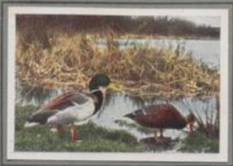
Die Stockente ( Anas boschas )

März ist's! Paarenten streichen zum Meer und nach den Küsten in den Feldern, die Reizzeit beginnt! Aufbrüchlich werben die prächtigen Männchen, und ihr Gesarrre erklingt auf den Blänken. Bald brüten die Weibchen auf Schilfkuppen im Tümpel. Die Jungen schlüpfen. Sie verwallen mit der Mutter einige Tage am Brutort, dann geht's auf staubigen Wegen zum See. Dort werden sie flügge und klümpeln abendlich landeswärts zur Futtersuche.