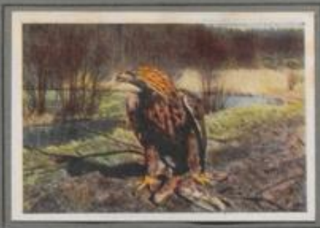
Der Goldadler ( Aquila chrysaetos )

Vor einem Jahrhundert war der Seeadler noch ein häufiger Brutvogel in den deutschen Wäldern, heute steht er auf dem Aussterbestand. Er horstet noch in etwa zwanzig Paaren in den kaspischen Wäldern der sowjetischen, belgischen Provinzen und fördert dort seinen Brutanteil an Fischen und Wassergefäßeln. In den übrigen Gebieten beobachtet man den stolzen Vogel nur im Herbst auf seinen Wanderflügen.