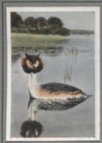
Der Haubentaucher (Podiceps cristatus)

Der kleine oder Zwergsäger ist Brutvogel im Norden Europas und Asiens. Nach Deutschland kommt er als Wintergast vornehmlich in die Flußmündungen und Meeresbuchten. Während die beiden großen Verwandten die Zusammensie mit anderem Wassergebüsel meiden, halten sich die Zwergsäger gern in der Gesellschaft der Schellenten. Die Freundschaft der beiden Arten ist so innig, daß Kreuzungen nicht selten sind.