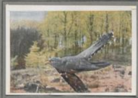
Der Kuckuck ( Cuculus canorus )

Seit acht Tagen ist der Kuckuck im Anwalde; er ruft und ruft, und jeder hört's gern. Heut' hat er ein costarbenes Weibchen gefunden, und er jagt die kichernde Sprache im Liebespiel. Nach Tagen wird das Weibchen heimlich in den Buschhorst, und mancher Kleinvogel erhält unbemerkt ein Kuckucksei ins Nest. Über zwanzig Eier werden gelegt, mancher Jungkuckuck wird groß. Die Graamäcken und Hebränger haben schwer zu schaffen, die großen Fledsäcker zu sättigen.