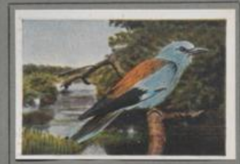
Die Mandelkröhe ( Coracias garrulus )

Auf der Viehwald stützen zwei merkwürdige Vögel, bunt im Gefieder, mit langem Schnabel und großer Federhaube. Sie stachen im Gras und sammeln Käfer, Raupen und Würmer. Drauf streichen sie zur Bruthöhle in der morschen Welle am Bauche und füttern ihre sechs Jungen, die tief ins stinkenden Kot hecken. — Im September ziehen die Wiedehöpfe zum Nil, im April kommen sie zurück, und das Männchen ruft mit lautem „Hup-hup, hup-hup“ sein Weibchen.