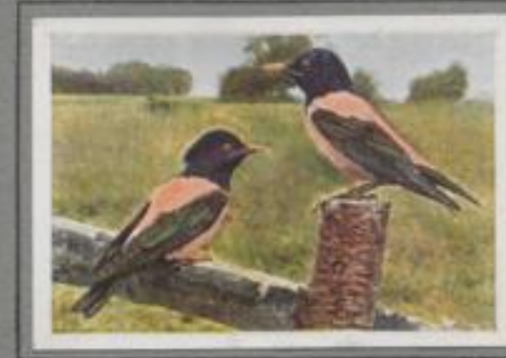
Der Rosenstar ( Pastor roseus )

Die Stars sind zurückgekehrt. Sie plaudern in den Hofgärten und zwitschern auf der First. Frühzeitig schreiten sie zur Brut: unzählige Umpferler schmecken sie zur Hochzeit. Im Sommer werden sie durch ihre Räuberzahn in den Gärten lästig. Am Abend strömen die Stars in Schwärmen zu den Schildkröcken der Gewässer und verbrühen dort die Nacht. Am frühen Morgen geht's hinaus ins Feld zur Futterzucht. Die meisten sitzen im Herbst wertwärts, einige bleiben im Lande.