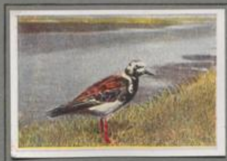
Der Steinwälzer ( Arenaria interpres )

Auf der kurzrasigen Fenne der Flussmarsch haben sich zehn Männchen versammelt. Nicht zwei von ihnen zeigen gleiche Farben. Der bunte Kraken und die Wazzen des Vorderbrusts sind bei den einzelnen Stücken immer verschieden. Das Beizspiel ist im vollen Gange! Die Kämpfer sträuben die Federkrone, ducken sich und recken mit vorgestrecktem Schnabel gegeneinander. Angriff folgt auf Angriff, wild wagt der Zweikampf, doch er endet immer unblutig.