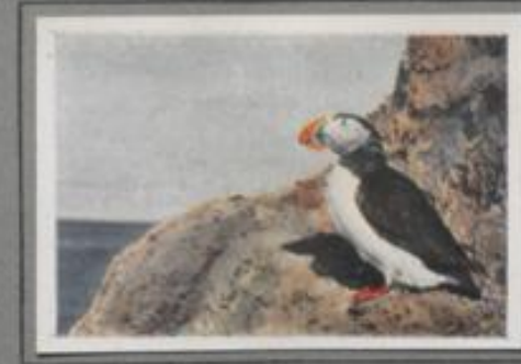
Der Lund (Fratructula arctica)

Von Amerikas Nordwestküste bis zum Weißen Meer ist die Gryll-Lumme an allen Felsküsten einer der häufigsten Brutvögel. Während Sturmvogel und Lund auf den Spitzen der Vogelfelsen brüten, bevorzugt die Lumme die unteren Etagen in der Nähe des Wasserspiegels. Die Eltern ziehen zwei Junge groß. Anfangs werden sie mit Kerntieren gestützt, später ist das Tobiasfischchen die Hauptnahrung — wie bei allen Lummen- und Alkankeidern.