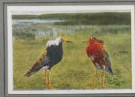
Der Kampfhahn ( Pavonella pugnax )

Auf der Halbinsel brüten an die fünfzig Austernfischer. Nach drei Wochen schlüpfen die Jungen. Wenig Stunden später folgen sie den Eltern und versuchen selbst die Nahrungssuche. Sie pöken nach kleinen Garnelen, Sandhüpfen, Asseln und winzigen Schnecken. Wenn der Aufsichtsmann der Halbinsel ihnen edwert, verschwinden sie in den Uferrücken. Die Eltern aber kreischen ängstlich, stellen sich krank, flattern mühsam vorwärts und locken den Störenfried fort.