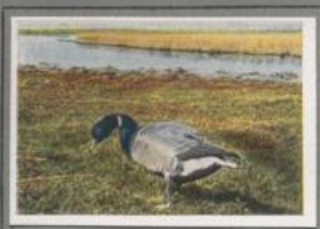
Die Ringelgans (Branta bernicla)

Sie brütet in Spitzbergen und Ostgrönland und kommt als Wintergast vornehmlich an die Nordmeerküste. Sie ist kleiner als die Graugans und unterscheidet sich ferner von dieser durch den schwarzen Schnabel und die schwarzen Ruder. In ihrem Benehmen ist sie entschieden ähnlicher als ihre größeren Vetter. Sie sind schnelle Flieger, gute Fußgänger, gewandte Schwimmer und geschickte Taucher. Der Flug ist von einem sausenden Geräusch begleitet.