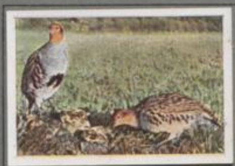
Das Rebhuhn ( Perdix perdix )

Im Mai brütet das Weibchen im Kiewschlag am Bruch- beren, doch die Eier holt der Dachs. In der Heide vom Felds kam es zur zweiten Brut. Die Jungen schlüpfen und leben dort gut, denn am Boden liegen Grassaat und Heidefrüchte, und im Guckel krabbeln Käfer und Spinnen. Das Volk wurde groß, doch es kam die Kälte — der Jäger mit seinem Hunde! Schüsse knallen, Hüner fliehen — und die Alten lachten im Abenddunkel vergnügt auf sich und ihre Kinder.