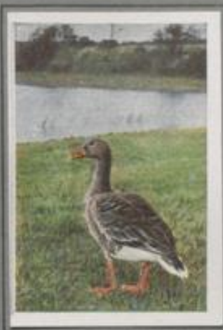
Die Graugans (Anser anser)

Sie kommt im Herbst aus dem Norden und verbringt bei mildem Wetter auf unseren Feldern und Gewässern den Winter. In der Färbung unterscheidet sie sich wenig von der Graugans, deshalb wird sie vielfach mit dieser verwechselt. Am sichersten erkennt man sie an dem dunklen Schnabel mit der orangefarbenen Binde, während der Schnabel der ersten Art ganz orangefarb ist. Sie ist vorsichtig, wie alle Gänse, nur auf weiten Flüssen fällt sie zur Aasung etc.