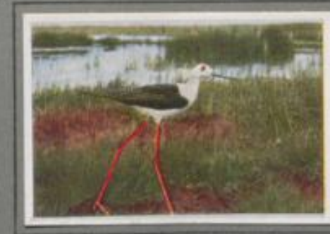
Der Stelzenläufer ( Himantopus himantopus )

Im April kam der Sabelschnäbler mit seinem Weibchen zugewandert. Das Paar nahm Standquartier an dem Strand im Ostseebiet. Täglich stolzierte das Pärchen an den moerigen Ufern oder auf den feuchten Wiesen. Bei stehendem Wasser, bei niedrigem Wasserstand besuchte es die Sanddeke vor der Klüte und suchte die Gaben des Meeres. Nach einigen Wochen wurde das Weibchen heimlich, es brütete, das Männchen blieb als Wächter beim Nest.