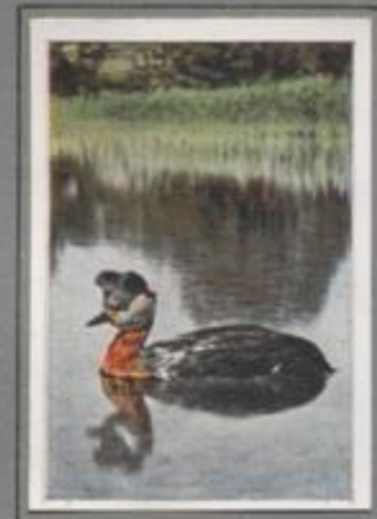
Der Rothaistaucher (Podiceps griseigena)

Er ist Brutvogel des Nordens, kommt aber auch vereinzelt auf den Gewässern Ostdeutschlands vor. Der Vogel im Prachtkleid ist eine herrliche Erscheinung. Im Charakter ist er zügellos und behaft, aber auch mutig. Die Jungen Polartaucher werden anfangs mit zarten Pflanzensprossen, Muscheln und Kerlen ernährt, die erwachsenen sind ausschließlich Fischfresser. Wenn der Lachs zieht, folgen sie ihm in die Flüsse, und sie wissen auch größere Flüsse zu bewältigen.