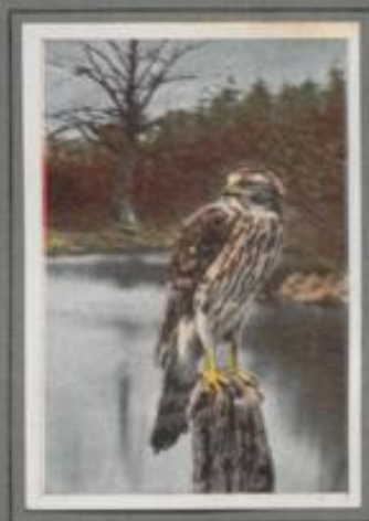
Der Hühnerhabicht (Jugendkleid) (Astur palumbarius)

An dem stillen Waldweber fußt auf einem Pfahl ein junges Habichtweibchen und lugt verlagend nach dem Bläuhühner hinüber, die vor dem Scheitrande knicken. In dem nächsten Herbst in der Buchenzone in Stielböschung trat es ins Leben. Lange sitzt die sorgende Mutter ihre drei Lieblinge. Jetzt schlagen sich die Kinder allein durchs Leben. Bald jagen sie im Wald, dann wieder erdzen sie ihre Beute auf Feld und Heide.