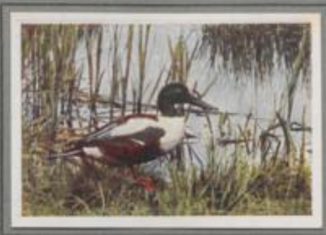
Die Löffelente ( Spatula clypeata )

März ist's! Paarenten streichen zum Meer und nach den Küsten in den Feldern, die Reizzeit beginnt! Aufbrüchlich werben die prächtigen Männchen, und ihr Gesarrre erklingt auf den Blänken. Bald brüten die Weibchen auf Schilfkuppen im Tümpel. Die Jungen schlüpfen. Sie verwallen mit der Mutter einige Tage am Brutort, dann geht's auf staubigen Wegen zum See. Dort werden sie flügge und klümpeln abendlich landeswärts zur Futtersuche.