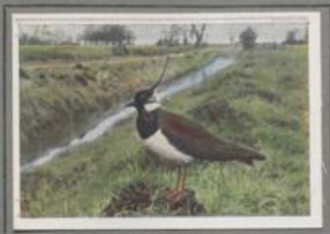
Der Kiebitz ( Vanellus vanellus )

Auf den Wiesen prangt das erste Grün, die Märzsonne lacht, da sind die Kiebitze da! Sie tummeln sich in den Lüften und rufen „Kwitt, kwitt, hött!“. Sie vollführen riesige Flugzirkel, steigen anpor, schiefen hinab, wippen hin, beschreiben einen Bogen und man hört als dumpfes „Wahwuh!“ ihren Schwingenschlag. Dann fallen sie ein auf dem Rasen zur Nahrungssuche. — Ritzische Vögel sind's, und doch nimmt man ihnen die Eier, weil Schlemmer sie hoch halten.