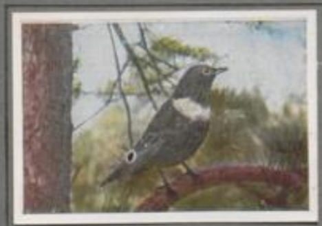
Die Ringdrossel (Turdus torquatus)

In Deutschland ist sie ein seltener Brutvogel, zur Zugzeit im Frühjahr und Herbst häufiger Gast. Auf den Bruchweiden des Nordens, am Rande von Erlen- und Birkenwäldchen, sucht sie sich mit Vorliebe an. Dort brütet sie im nennstehen Gebüsch, auf Schilfkraut oder auf kahler Erde. Hier herrscht nach der Ankunft ein trübendes Singen, nach dem Ausfall der Jungen ein geschäftiges Treiben. Der kurze Sommer gestattet ihnen nur eine einmalige Brut.