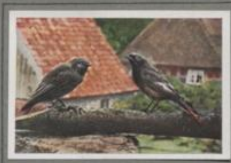
Der Hausrotschwanz (Erlithacus litys)

Der Hausrotschwanz ist ein Zugvogel, der im Frühjahr einzeln zurückkommt und im Herbst familienweise nach dem Süden zieht. Der kleine, muntere Vogel liebt die Aussicht. Vom Hausgiebel und Kirchendach blüht er hinab auf das Treiben der Menschen. Die Insekten jagt er im Fluge, auch den krabbelnden Käfer weiß er geschickt zu erreichen. Ab Halbnachtsbrüter wählt er oft absonderliche Nistplätze, die durch die Wohnungsnot bedingt sind. Wer ein offenes Auge für die Natur besitzt, wird Nest-Nyffe mancherlei Art von diesem Vogel beobachten.