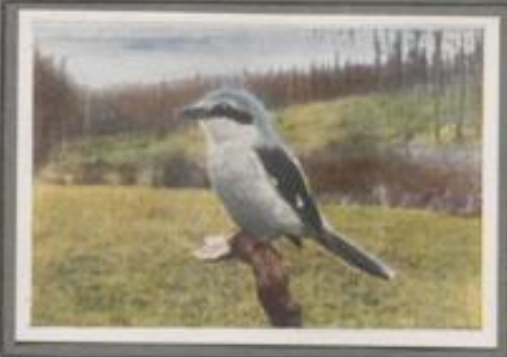
Der große Würger ( Lanius excubitor )

Der große Würger ist ein Einzelgänger. In seinem Jagdgebiet duldet er keine seiner Art. Zeigt sich als Einzelgänger, so gibt es wilde Kämpfe, vornehmlich vor der Brutzeit. Er ist ein mutiger, angriffsfähiger Vogel, der mit seinem Hakenschnabel manche Maus bewirft, der aber auch Kleinvogetenstern berührt. Er baut sein Nest im dichten Gebüsch. Der obere Rand ist mit eisernen Flechten überzogen, eine Schutzfärbung für das brütende Weibchen.