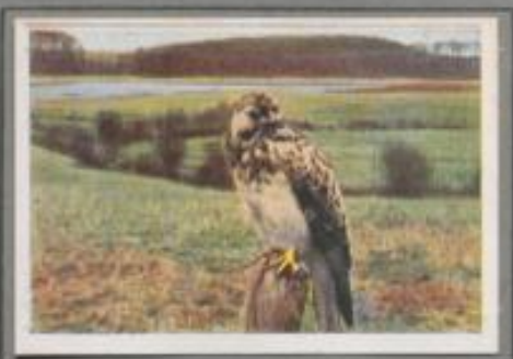
Der Mäusebussard ( Buteo buteo )

Auf dem Einfriedigungsstahl am Feldrande blockt reglos der Bussard. Plötzlich stößt er hinab auf den Boden und schlägt die Maus, die zwischen den Stoppeln wisperl. Noch zwei der graun Nager erwischt er am selben Ort, dann strichelt er ins Wiesengelände und reißt nach längerem Warten den verfluchten Mausewurf aus dem Hügel. Bis zum sinkenden Abend dauert die Jagd, darauf rudert er zum Scherbaum im Wald und sein helles „Häh“ klingt als Abschiedsruß über die Flur.