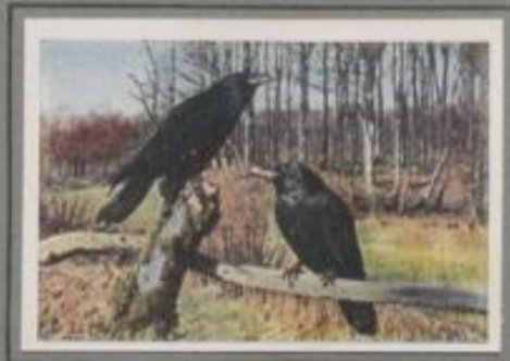
Der Korkrabe (Corvus corax)

Der Winter weicht, da tummeln sich die Korkräben im Balzfluge und ihr melodisches Töten „Kulung, kling“ ertönt in die Tiefe. Mitte März ist ihr Gelege voll, und schon im Mai folgen die Jungen den Eltern. Sie sammeln Käferlarven, Schnecken und Würmer, sie erschaffen die Mäus, schlagen den Frosch, erspähen verändertes Deter und flachen an Gräten und Tümpeln. Und jeder traut sich das Anblick der schönen Vögel, der Wodansoten, die so selten sind in deutschen Landen.