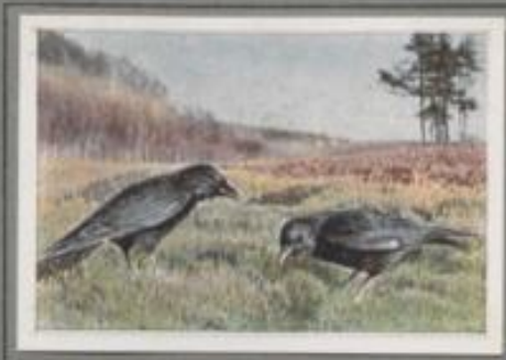
Die Rabenkrähe (Corvus coronae)

Der Winter weicht, da tummeln sich die Korkräben im Balzfluge und ihr melodisches Töten „Kulung, kling“ ertönt in die Tiefe. Mitte März ist ihr Gelege voll, und schon im Mai folgen die Jungen den Eltern. Sie sammeln Käferlarven, Schnecken und Würmer, sie erschaffen die Mäus, schlagen den Frosch, erspähen verändertes Deter und flachen an Gräten und Tümpeln. Und jeder traut sich das Anblick der schönen Vögel, der Wodansoten, die so selten sind in deutschen Landen.