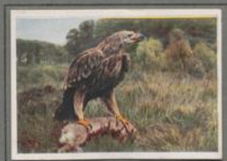
Der Kaiseradler (Jugendkleid) ( Aquila heliaca )

Auch er ist ein stolzer Vogel, der Name sagt's, aber dem Stornadler kommt er nicht gleich. Er ist plumper und kleiner, seine Flügel sind schwächer, und ihm fehlen Angriffsmut und Waffenzahl eines mächtigen Veters. Kleinwird und Vogel von milderer Größe bilden seine Hauptnahrung, auch Aas wird nicht verschmäht. — Als Kind des warmen Südens, des Balkans und Orients, verstreicht er ganz selten in unsere Breiten.