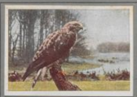
Der Raufußbussard ( Buteo lagopus )

Auf dem Einfriedigungsstahl am Feldrande blockt reglos der Bussard. Plötzlich stößt er hinab auf den Boden und schlägt die Maus, die zwischen den Stoppeln wisperl. Noch zwei der graun Nager erwischt er am selben Ort, dann strichelt er ins Wiesengelände und reißt nach längerem Warten den verfluchten Mausewurf aus dem Hügel. Bis zum sinkenden Abend dauert die Jagd, darauf rudert er zum Scherbaum im Wald und sein helles „Häh“ klingt als Abschiedsruß über die Flur.