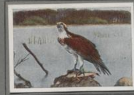
Der Fischadler ( Pandion haliaetus )

Aus der Fehlmelzung von Ges klingel's wie Hundgeschütt. „Mit, [ist], an Mutel's, und noch einmal — der Schreiadler ist's! Er hat Quersier genommen in dem stillen Winkel und baut seinen Horst in einer alten Schürnklee, Monatslang haust dort das Paar; zwei Kinder wollen versorgt sein. Für Maulwürfe und Mäuse, Schlamm und Früchte gibt's schlimme Wochen, auch stöche Hasen enden unter den Krallen der seltenen Glast.