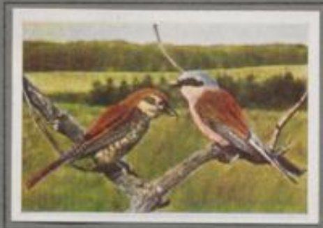
Der Neuntöter ( Lanius collurio )

Der große Würger ist ein Einzelgänger. In seinem Jagdgebiet duldet er keine seiner Art. Zeigt sich als Einzelgänger, so gibt es wilde Kämpfe, vornehmlich vor der Brutzeit. Er ist ein mutiger, angriffsfähiger Vogel, der mit seinem Hakenschnabel manche Maus bewirft, der aber auch Kleinvogetenstern berührt. Er baut sein Nest im dichten Gebüsch. Der obere Rand ist mit eisernen Flechten überzogen, eine Schutzfärbung für das brütende Weibchen.