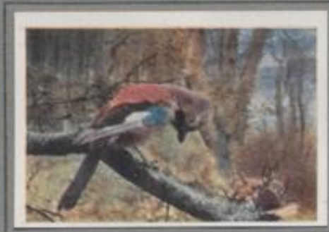
Der Eichelhäher ( Garrulus glandarius )

In der Spitze der Hoffeder ist ein überdachtes Nest, die Eielerburg. Fünf Junge liegen in der aus Laub gemauerten Hohlhöhle. Die Altvögel durchstreifen die Umgegend und sammeln Kerntiere und Würmer für die Brut, sie besetzen aber auch viele Kleinvegetation. — Die Eieler gilt als Heinvogel im Volk. In vielen Gegenden wird sie schonungslos verfolgt, in anderen Gegenden Angelisch geschätzt, je nach der Einstellung überglücklicher Menschen.