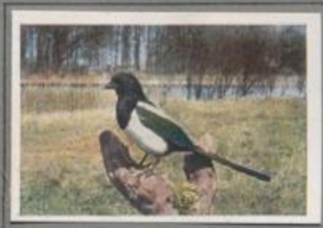
Die Eieler ( Pica pica )

In der Spitze der Hoffeder ist ein überdachtes Nest, die Eielerburg. Fünf Junge liegen in der aus Laub gemauerten Hohlhöhle. Die Altvögel durchstreifen die Umgegend und sammeln Kerntiere und Würmer für die Brut, sie besetzen aber auch viele Kleinvegetation. — Die Eieler gilt als Heinvogel im Volk. In vielen Gegenden wird sie schonungslos verfolgt, in anderen Gegenden Angelisch geschätzt, je nach der Einstellung überglücklicher Menschen.