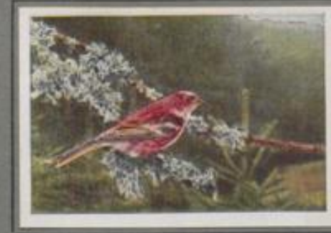
Der Karmingimpel ( Carpodacus erythrina )

Den melancholischen Flötentruß des Gimpels — der Männchen gehört zu unseren farbengprächtigsten Vögeln — hört man am häufigsten in den Buchwäldungen der Mittelgebirge. Die nordischen Dompfaffen kommen im Oktober und stehen im Februar wieder in ihrer Heimat. Unsere Brutgimpel sind Strichvögel. Wo Ebereschenbeeren leuchten, sind sie zu finden, die naschen sie gern. Heut' sind sie hier, morgen dort. So geht's den Winter hindurch. Dann erst werden sie sesshaft.