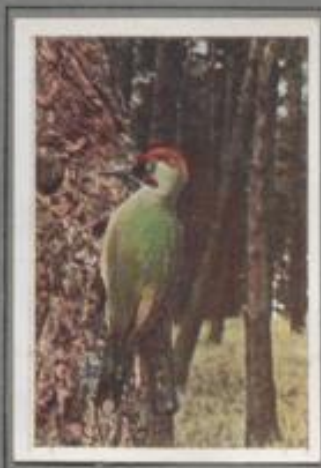
Der Grünspecht ( Picus viridis )

Er ist der seltenste Specht Deutschlands. In den Bergwäldern der Bayerischen Alpen, im Böhmer Wald, Riesens- und Erzgebirge kommt er als Brutvogel vor. In der Färbung ähnelt er dem Buntspechten: er unterscheidet sich von ihnen durch das Fehlen der ersten Zehne und der roten, leuchtenden Haube. Dafür besitzt das Männchen einen gelben, das Weibchen einen silberweißen Scheitel. Bei dieser Spechtart sind also die Geschlechter am Gefieder kenntlich.