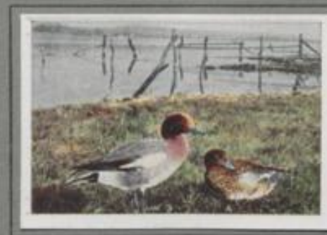
Die Pfeifente ( Anas penelope )

Es ist im September, der Entenfang in der Vogelkajen ist im vollen Gange. Auf dem Teich quarren die Lockenten und ruhen die wilden Verwandten. Ein Flug Spießenten ist lausend ein. Sie gründeln und folgen den Lockenten in die netzüberspannten „Pfeilen“, wo der unsichtbare Fänger Körnerfutter streut. Immer hinter rudern sie in den Kanal hinein, da zeigt sich der Köjennann und schneidet sie in den Fangkorb, dort verfallen sie dem Tode.