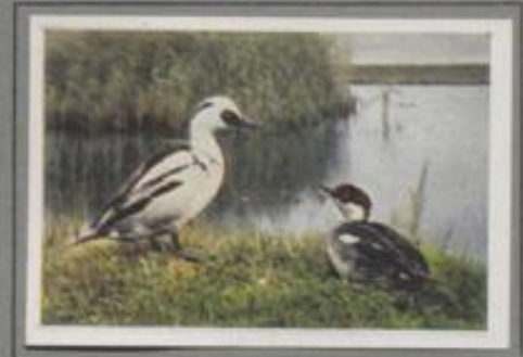
Der Zwergsäger (Mergus albellus)

Er nistet im Norden der Alten und Neuen Welt und breitet sein Brutgebiet im Süden bis zur deutschen Küste. Wie alle Säger ist auch er ein winterrarter Bursche. Bei gemäßigter Kälte schaukeln die prächtigen Vögel auf dem Wasser der Meeresbuchten zwischen kaltschwimmenden Schollen und schließen tauchend in die Tiefe. Das pelzartige Federkleid schützt gegen Wärmeverlust. — Das Fleisch des Sägers ist infolge des trübsigen Beigeschmacks ungenießbar.