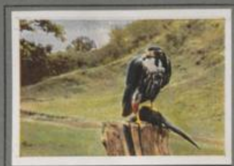
Der Baumfalk (Falco subbuteo)

Drei Monate lang hauste der Wanderfalk — als der Frost hämmerte, der Wind gillt und der Schnee wirbelte — auf dem Domturm der Großstadt — ein Schrecken der Taubenzüchter! Tagtäglich forderte er im Stabfluge aus den Taubenschwärmen sein Opfer und kröpfte es im stillen, verrußten Winkel der Giebel. Als aber der Frühling kam, zog er mitwärts und brühte im Kiefernstammholz. Vom Späthommer an streifte die Sippe nach Zigeunerart durch die Lände.