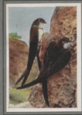
Der Alpensegler ( Apus melba )

Blutrot ist die Sonne hinter den Kiefern versunken, es dunkelt, die Stimmen der Nacht erwachen! Ein dicker Vogel umschwebt laufend den Birkenbüschel, umkreist den Wacholder, schwebt auf und ab, und verschwindet im Schatten der Eichen. Und dann erklingt ein Pfiff, es klatscht und schnarrt, und wieder pfiff's schrill und seltsam. Stimmen der Nacht, Nachtschnalbenesang! Wer an stillen Abenden die Heidekrautblüte sucht, erwacht den seltsamen Gaukler immer entzückt.