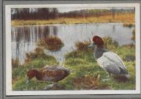
Die Tafelente ( Nyroca ferina )

Die Reiherente — benannt nach dem reiherartigen Federbusch, den die Männchen am Hinterkopfe tragen — ist vornehmlich Brutvogel des Nordens. In Deutschland ziehen sie vorwiegend auf großen Seen. Im Herbst kommen große Schwärme zugestrichen und besiedeln die Gewässer. Auf den Binsenstängeln harrn sie aus, bis der Frost sie vertreibt. Dann streichen sie zum offenen Meer oder setzen ihre Fahrt nach dem frostfreien Süden fort.