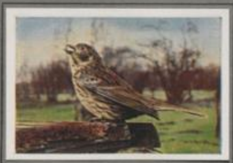
Die Grauammer ( Emberiza calandra )

Sie hat sich, wie manche Vogelart, lang dem Menschen angegeschlossen. Als echter Straßenvogel kommt sie in die Städte und Dörfer. Auf Müllern und Gäßchen in der Nähe der Ortschaften ist sie immer zu finden. Als Sand-vogel verläßt sie auch im Winter ihr Brutgebiet nicht. Wenn eine hohe Schneelage ihre Nahrungsquellen verschließt, kommt sie in der Gesellschafft von Spatz und Goldammer auf die Dachhäuten der Gehäfte und findet dort ein Körnlein für den Hunger.