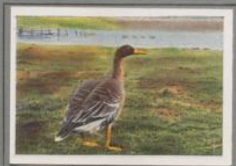
Die Saatgans (Anser fabalis)

Sie kommt im Herbst aus dem Norden und verbringt bei mildem Wetter auf unseren Feldern und Gewässern den Winter. In der Färbung unterscheidet sie sich wenig von der Graugans, deshalb wird sie vielfach mit dieser verwechselt. Am sichersten erkennt man sie an dem dunklen Schnabel mit der orangefarbenen Binde, während der Schnabel der ersten Art ganz orangefarb ist. Sie ist vorsichtig, wie alle Gänse, nur auf weiten Flüssen fällt sie zur Aasung etc.