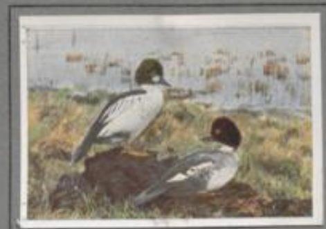
Die Schellente ( Clangula clangula )

Die Bergente ähnelt der Tafelente, sie übertrifft sie aber an Größe und die Erpel haben ein schwarzes, grünlich-schwarzes Kopfgefieder. Es sind nördliche Vögel, die als Wintergäste bei uns Aufenthalt nehmen. Mit Eintritt des Frostes kommen sie in Schwärmen ins Ost- und Nordseegebiet, auch unsere größeren Landseen besuchen sie gern. Im Weltmeer und auf den Buchten der Ostsee verweilen sie, bis ihre Brutgebiete eisfrei werden.