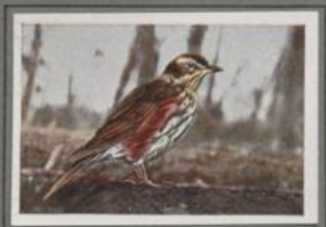
Die Weindrossel (Turdus musicus)

Im September, Oktober, wenn aus den Krosen der Vogelweibkorn die roten Früchte leuchten, kommen die Wacholderdrosseln oder Krummetzlvögel — die auch bei uns wüten — in Schwärmen vom Norden her und raschen umher die Dörfer. Vor Jahren laurten in der Zugzeit die Pfeifehaarschlingen über den Lockfrüchten der Dörfer, und viele fingen sich. Heute ist der Drosselzug verboten, und der Naturfreund hat seine ungetrübte Freude an dem schreckhaften Volk.