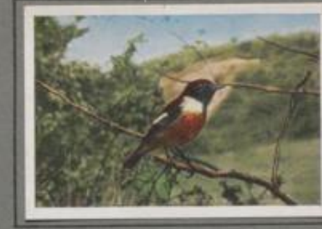
Der schwarzkehlige Wiesenschmärtzer (Pratincola rubicola)

Im Frühling ist er Kleinestgelb ziehen in lockeren Flocken nordwärts über das grüne Feld, über die braune Heide, über das stille Moor. An der Moorhecke fallen vier, fünf Wasserpieper etc. Sie plätschen kläglich, trüppeln über die Moospunkte dahin, schlüpfen durchs Gestrüch, plücken nach Insekten, hockten nach Käfern, erheben sich mit schnellem Schwingenschlagen und streichen mit furchtlosem Geplätsch nordwärts. Manche aber bleiben im Lande und brüten an stillen Orten. — In Italien Geflügel wurde unzählige Pieper gefangen und als Lackerbissen verspeist.