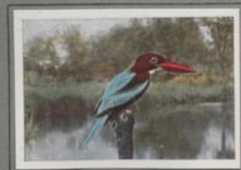
Der Braunliet ( Halcyon smyrnensis )

Auf tropischem Aat an stiller Seebucht lauert der Eisvogel auf Beute. Jetzt schießt er in die durchsichtige Flut, packt einen winzigen Fisch und kröpft ihn auf einem Fiedling am Ufer. Als aber Störung kommt, schwirrt er wie ein legendärer Edelstein über den blinkenden See, schreit sein durchdringendes „Tittitititit!“ und sucht sich einen neuen Anlauf am Ufer. — Im harten Winter hungern die hübschen Vögel, und viele verkommen.