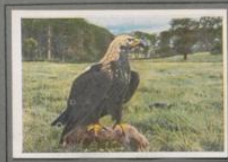
Der Kaiseradler (Alterskleid) ( Aquila heliaca )

Der König der Lüfte und das ganze gefiedernde Volk ist unstrittig der herrliche Stornadler, der stolze Wappenvogel mächtiger Geschlechter. An starker, ihn abfallender Brustwand, im unzugänglichen, schroffen Felsspalte oder in der Krone eines riesigen Waldbaumes ist sein mächtiger Horst. Die ganze Umgebung ist dem tributpflichtig; er zehret alles bewegbare, warmblütige Getier. — Der Goldadler ist eine Spielart des Stornadlers.