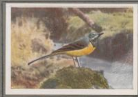
Die Bergstelze ( Motacilla sulfurea )

Wo ein klara, munteres Bächlein zwischen bewaldeten Ufern im Berglande zu Tal raschelt, ist die Gebirgsstelze zu finden. Das Männchen im Hochzeitskleide ist ein sehr schöner Vogel. Wie glänzt die linschwarze Kehle, wie leuchtet die schwefelgelbe Brust! Mit der Wassermusik halten die Stelzchen gute Nachbarschaft, und jeder Beobachter freut sich ihres Anblicks. — Zierliche Vögel sind's, aber wetterhart, selbst im Winter bleiben stütze bei uns.