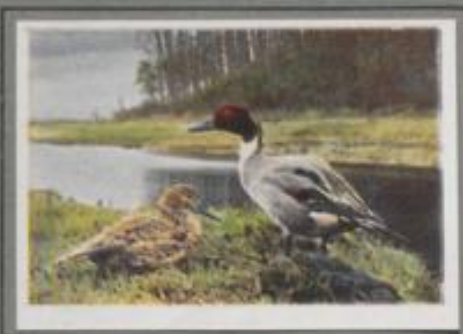
Die Spießente ( Anas acuta )

Sie ist die seltenste unserer Schwimmenten und kommt in Deutschland nur vereinzelt als Brutvogel vor. Von Rußland bis zur Küste des stillen Ozeans ist sie ein häufiger Gast. Auf den mächtigen Strömen und rheinigen Seen, im wasserreichen Sumpf und weghanen Meer verbringt die Schnatterente den Sommer. Im Herbst verläßt sie regelmäßig ihre Brutheimat, denn der harte Winter in den kalten Geleiten verschließt ihre Nahrungsquellen.