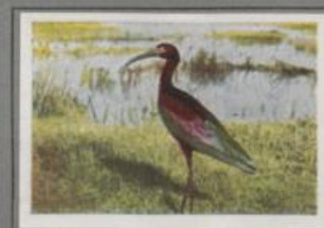
Der braune Sichler ( Plegadis falcinellus )

Jeder Tümpel, Teich und See ist von den Bläuhühnern besetzt. Ihr Gefieder ist schieferfarben und schwarz, nur die weiße Stirnplatte leuchtet. In Scharen tummeln sie sich vom Schilfrande und holen als gute Taucher ihre Nahrung aus der Tiefe. Die Wasserhühner sind Zugvögel, doch viele bleiben auch im Winter bei uns. Bei starkem Frost leiden sie bittere Not. Sie blökeln auf dem See, bis sich die letzte Wacke schließt, sie hungern, und viele verenden.