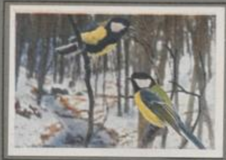
Die Kohlmeise (Parus major)

Der erste Schnee ist gefallen, der Waldboden ist weiß. An den Buchenstammchen tumelt ein Meisenpaar und sucht eifrig nach Puppen und Eiern. „Pink, pink“, so klingen sie, dann streichen sie ab zum nahen Garten und spähen an den Frostbäumen nach Beute. Wenn aber Schnee und Glätte die Äste desken, werden sie bittere Naf. Doch dann hilft der Mensch mit mühseliger Hand, er reinigt ihnen saftfreie Knochen und Schwerte, und die nützlichen Vögel überleben die harte Zeit.