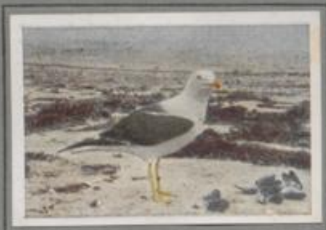
Die Heringsmöwe ( Larus fuscus )

Der prächtige Vogel brütet in Deutschland nur auf den Nordseeeisen. In den Dänen auf der Herdofte Sct's nistet er seit undenklichen Zeiten; die Zahl der Brutpaare nimmt allerdings ab. Die Vogelkolonien auf Bornholm und Langeland beherbergen noch bedeutende Mengen. Nach der Brutzeit streicht die Silbermöwe weit umher bis tief ins Binnenland. Aus den nördlichen Gebieten kommt sie im Herbst in Scharen zugewandert, dort nistet sie in großer Zahl.