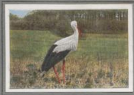
Der Hausstorch (Ciconia alba)

Der Storch ist angekommen! Klappernd begrüßt er das stille Dorf in der Fluchiederung. Die Kinder jubeln ihm zu. Die Hausmütter sehen ihn gern auf der First; denn nach dem Volksglauben wird er als Glückbringer betrachtet, der das Feuer kühlt, der die Blitzesfahr abwendet, wenn an schwülen Tagen schwarz Gewitter über der Landschaft toben. — Früher brütete er in großer Zahl in den Dörfern des Flachlandes, heut' wird er seltener von Jahr zu Jahr.