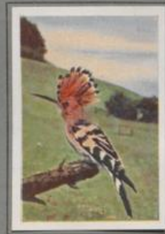
Der Wiedehopf ( Upupa epops )

Seit acht Tagen ist der Kuckuck im Anwalde; er ruft und ruft, und jeder hört's gern. Heut' hat er ein costarbenes Weibchen gefunden, und er jagt die kichernde Sprache im Liebespiel. Nach Tagen wird das Weibchen heimlich in den Buschhorst, und mancher Kleinvogel erhält unbemerkt ein Kuckucksei ins Nest. Über zwanzig Eier werden gelegt, mancher Jungkuckuck wird groß. Die Graamäcken und Hebränger haben schwer zu schaffen, die großen Fledsäcker zu sättigen.