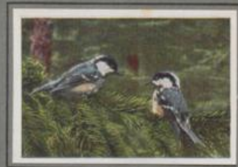
Die Tannenmeise (Parus ater)

Wie heuliche Tannengelster turnen die Haubenmeisen in den Kiefernkrone. „Sit, sit“, so lockt's in der Höhe, dann huscht's hierhin, schwirrt's dorthin. Das Weibchen untersucht die Ritze der Dornen, das Männchen hängt an einem Splintertrieb und laßt nach Raupen. Und immer wieder klopft's aus dem Krenke: „Sit, sit... zieder, sit, sit“. Im schwermischen Winter ist die Nahrung knapp, dann klaben sie den Kiefernast aus den Zapfen, und beständiger sind Feindgast.