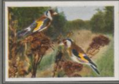
Der Stieglitz ( Acanthis carduelis )

Zur Frühjahrszeit hört man an allen Orten das Buchfinkenlied. Es ertönt vom Obstbaum im Garten, aus der Buche am Waldesrande, aus dem Buschwerk am Bach. Dort finden die hübschen Vögel ein Plätzchen für ihr kunstvolles Nest. Außen umspinnen sie's mit Flechten und Moos. Innen polstern sie's weich und warm. Im Hochsommer brüten sie zum zweiten Male. Im Herbst ziehen die Buchfinken zum Süden, doch manche Männchen bleiben und überleben die karge Winterzeit.