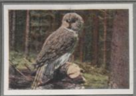
Die Habichtseule ( Syrnium uralensis )

Der Tag versinkt, die Stimmen des Moores erwachen! Frösche quarren in den Kühlen, Himmelschwan meckern, Nachtschwalben gestern im Beutehupen. Da erhebt sich die Moorohreule aus dem Schilf und gleitet lautlos schwebend und schwankend über Torfbänke und Tümpel dahin. Jäh schießt sie hinst, kräftig die Sehermaus und bringt sie den Jungen. — Die Dämmerstunden dienen der Jagd, die übrige Zeit gehört den Nestlingen.