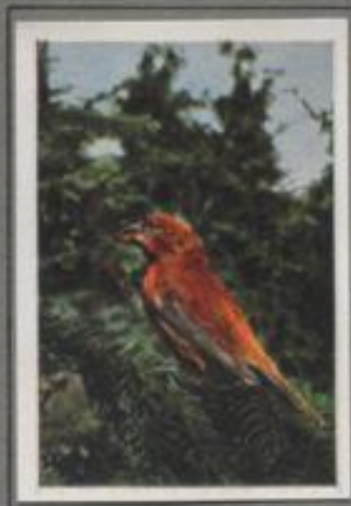
Der Fichtenkreuzschnabel ( Loxia curvirostra )

Der Juli ist da! Die Kirschbäume glänzen im Rot ihrer Früchte, und mancher Vogel kommt als Gast. Starke und Drosseln rauben das Fruchtfleisch, der schone Pirat kommt vom Walde her und nascht. Zuweilen stellt sich auch der Kernebeißer ein. Er schält mit dem kegelförmigen, klüppigen Schnabel das saftige Fleisch von den Kernen und wirft es auf den Erdboden, den Kern aber knackt er, entfernt die Schale und verzehrt ihn als Leckerbissen. — Ein sonderbarer Gast!