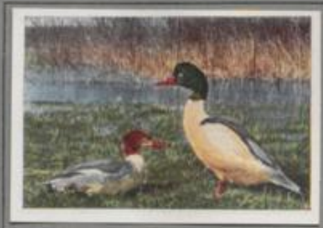
Der Gänsesäger (Mergus merganser)

Der Gänsesäger, der sich durch seinen gebogenen Schnabel von den Enten unterscheidet, brütet in Nordeuropa und Asien, er nistet aber auch in Deutschland. Wie die Schwelente, ist auch er Höhlenbrüter. Mit Vorliebe wählt die Weibchen hohle Kopfweiden als Nistplatz. Im ersten Jahr ist das Geschlecht der Säger noch nicht nach dem Federkleid bestimmbar, sie sehen sich zum Verwechseln ähnlich. Erst im zweiten Jahre legen die Männchen das Prachtkleid an.