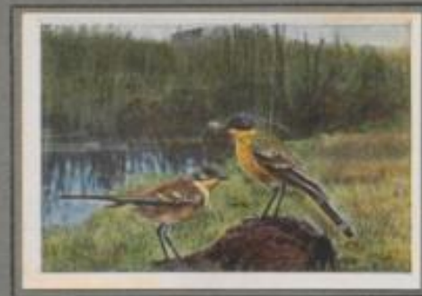
Die nordische Schafstelze ( Motacilla borealis )

Wahr ist's! Der Landmann pflügt seinen Acker, und allerlei Vogelvolk folgt dem Gespann. Die Stare sammelt Heideg in der Furche und auf den Schulden, Krähen und Lachmöwen halten mit, und auch die Bachstelze, das Ackermännchen, ist da! Hurtig trippelt es dahin, verbeißt, wippt mit dem Schwanz, pickt hier den Käfer, packt dort den Wurm und hält sich stets in der Nähe des Pflügers. Es ist ein zutrauliches Vögelchen, bekannt in Dorf und Stadt.