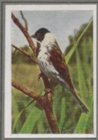
Die Rohammer ( Emberiza schoeniclus )

In dem fruchtbaren Flachlande, wo im Frühling die weisse Rasenfläche leuchtet, ist die Grauammer heimisch. Im März kommen sie ins Land, im Oktober ziehen sie in lockeren Flügen ins Mittelmeergebiet. Manche verdrängen in milden Landstrichen Deutschlands auch den Winter. Ihre geselligen Leistungen sind schwach, ihr Flug ist unbeholfen, im Gebüsch aber sind sie geschickte Kletterer. In ihrem Bauwesen sind sie unliebenswert und zänk-süchtig.