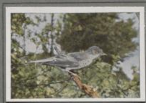
Die Sperbergrasmücke (Sylvia nisoria)

Das weisse Linsensplend mit der hochgezogen, Zinkenhorsten und Weidenkusseln ist seine Sommerhaube. Dort brüht der Vogel, und das lebhaft Männchen unterhält mit schnarrendem Singen sein Weibchen. In der Höhe des Nechts hat der unermüdete Sänger seinen Lieblingsplatz. Da steigt er wie der Baumkrieger schräg in die Luft, schwebt sanft herab oder stürzt sich schnell aus der Höhe, und immer erklingt sein Lied. Den eigenartigen Sturzflug wiederholt er manchmal, vornehmlich in der Mittagszeit.