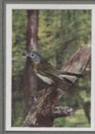
Der Zwergfliegenschnäpper ( Muscicapa parva )

Der Trauerfliegenschnäpper gleicht in der Lebensweise einem grauen Verwandten. Dem Menschen gegenüber aber ist er entschieden zurückhaltender. Er ist ein Zugvogel, wie alle der Art. Zum Mai ist er im Lande. Nach vierwöchentlichem Aufenthalt brütet das Weibchen in einer Baumhöhle oder in einem Malvenknoten. Bald kitzeln besorglichen sich beim Nestbau. In den Mittagstunden übernimmt das Männchen gar vielfach das Besetzen des Geleges. Der Sommer reicht nur zur Aufzucht einer Brut, denn frühzeitig wandert die Familie wieder zum Süden.