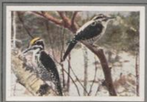
Der Dreizehenspecht ( Picoides tridactylus )

Im Mischwald führt der Specht vom Frühling bis zum Herbst ein sorgenloses Leben. Zweimal beginnt er den Bau eines Stollens, doch bald unterläßt er die Arbeit, erst die dritte Nisthöhle wird fertig. Ende April ist das Gelege voll. Die Eltern brüten abwechselnd, das Männchen am meisten. Die Jungen erlernen das Handwerk der Eltern. Der Winter ist hart, die Nahrung knapp, da schließt sich das Männchen den Weibern an, und fort geht's in die Gärten der Dörfer.