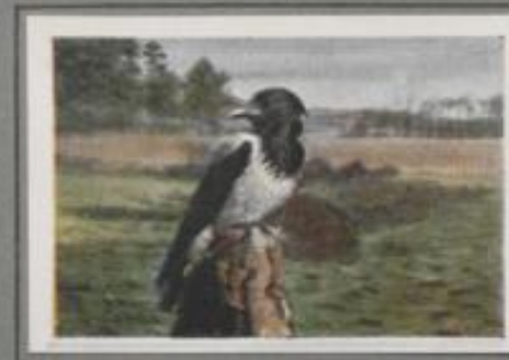
Die Nebelkrähe (Corvus cornix)

Sommer und Winter, jahraus, jahrein raubt das scharfsinnige Gesindel auf unseren Feldern. Manches Gelege wird von ihnen geplündert, mancher Junghans bezwungen; die Jäger haasen deshalb die Gaisenvögel. Sie schleichen die brütenden Weibchen auf den Nestern und überleben das zehrende Gelichter vor dem Uhu der Krähenhölle. Das Krachen in den Dörfern ist die Rabenkrähe Feindwilt, sie ersteigen die Horstbäume und holen sich die Eier.