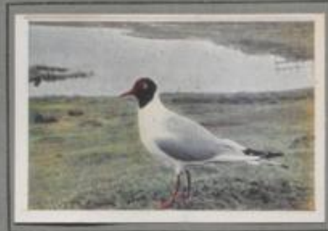
Die Lachmöwe ( Larus ridibundus )

Auf den Felsküsten von England, Norwegen bis Finnland brütet diese weiße Möwe mit dem schwarzen Mantel. Sie ist ein gieriger Fischräuber, der die Sprotten- und Heringsschwärme zehlet; sie sucht aber auch in dortiger Gegend ihre Nahrung auf den Gewässern des Binnenlandes. Im Herbst verläßt sie ihre Brutgebiete und kommt dann als regelmäßiger Gastvogel an unsere Küsten, man kann sie aber auch vereinzelt im Innern Deutschlands beobachten.