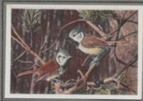
Die Haubenmeise (Parus cristatus)

Der erste Schnee ist gefallen, der Waldboden ist weiß. An den Buchenstammchen tumelt ein Meisenpaar und sucht eifrig nach Puppen und Eiern. „Pink, pink“, so klingen sie, dann streichen sie ab zum nahen Garten und spähen an den Frostbäumen nach Beute. Wenn aber Schnee und Glätte die Äste desken, werden sie bittere Naf. Doch dann hilft der Mensch mit mühseliger Hand, er reinigt ihnen saftfreie Knochen und Schwerte, und die nützlichen Vögel überleben die harte Zeit.