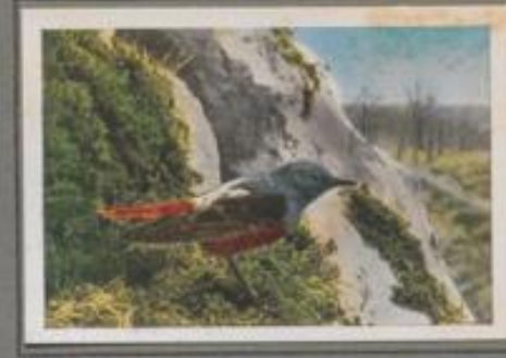
Der Steinrötel (Monticola saxatilis)

Er ist ein lebhafter, fröhlicher Vogel, stets in Bewegung, gewandt und munter. Er misst sich gern mit anderen Vögeln und jagt und beißt sich vor der Nistzeit mit selbigen. Eine Eigenart des Vogels ist die zitternde Auf- und Abwärtsbewegung des Schwanzes. In der Erregung stolpert sich diese Bewegung. In der Ernährung ähnelt er seinem dunklen Vetter. In der Wahl des Nestes zeigt er die gleichen Absonderlichkeiten. Sehr gern brütet er auch in Nistkästen, die an passenden Plätzen aufgehängt sind.