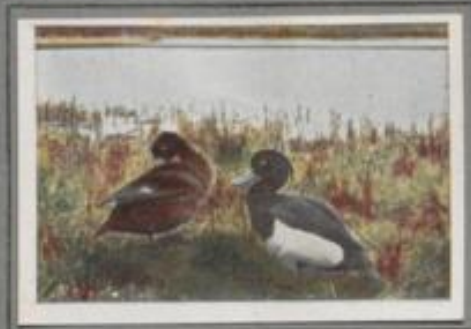
Die Reiherente ( Nyroca fuligula )

Die Reiherente — benannt nach dem reiherartigen Federbusch, den die Männchen am Hinterkopfe tragen — ist vornehmlich Brutvogel des Nordens. In Deutschland ziehen sie vorwiegend auf großen Seen. Im Herbst kommen große Schwärme zugestrichen und besiedeln die Gewässer. Auf den Binsenstängeln harrn sie aus, bis der Frost sie vertreibt. Dann streichen sie zum offenen Meer oder setzen ihre Fahrt nach dem frostfreien Süden fort.