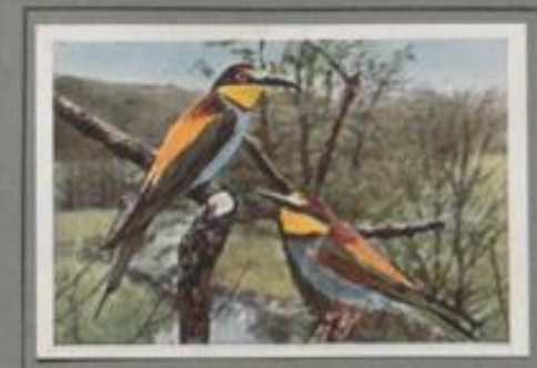
Der Bienenfresser ( Merops apiaster )

Von Kleinasien bis Süchina reicht sein Verbreitungsgebiet. Er ist dem Eisvogel verwandt aber erheblich größer als unser Königfischer. Auch er trägt ein Fruchtkleid in leuchtenden Farben, in hellblau, kastanienrot und schwarz. Der röhrlige, rote Schnabel kennzeichnet ihn als Fischers seine Hauptnahrung aber besteht aus Insekten, Lurche und kleinem, warmblütigen Getier. Als echtes Kind des Orients kommt er sehr selten in unsere Breiten.