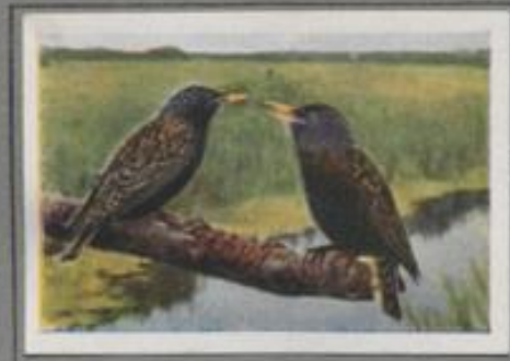
Der Star ( Sturnus vulgaris )

Im hohen Norden, in Norwegens Bergwäldern und Schwedens dunklen Tannenforsten ist der Unglückshäher heimisch. Ihm fehlen die schwebenden Farben des Eichelhähers, im Charakter und in der Lebensweise aber ist er ihm gleich. Der kurze Sommer bietet ihm üppige Kost, im Winter dagegen heißt es an manchen Tag dasten. Trotzdem bleibt er als Standvogel im Lande und verstreicht sehr süßen zum süßen.