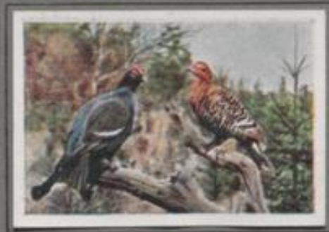
Das Birkhuhn ( Tetrao tetrix )

Dunkel ist die Aprilnacht, der Wind staut. Da rauscht's in den Lüften, und in der sperrigen Kiefer am Berghang schwingt sich der Urhahn aus. — Ein heiserer, krähen- der Ton — dann tiefe Stille! — Und dann ein Knarren, scharf und metallisch — und wieder ist's still! „Klapp, klapp...“ ein leises Lied — ein trillerndes Wirbeln — ein glückseliges Klackern — ein hässliches Wetzen in steter Folge, ein uriges Liebslied, bis der Himmel sich rüdt und der Sänger verstummt. —