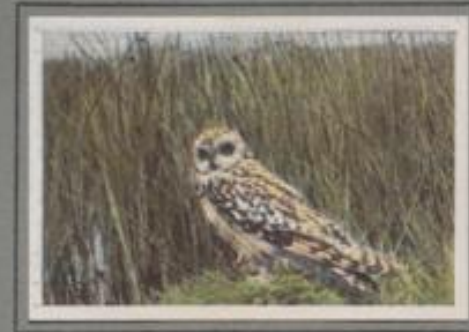
Die Sumpfohreule ( Asio accipitrinus )

In Stammhöhe der rauhbeckigen Kiefer, vom Abendlicht umspielt, ruht auf bemessener Seitenast eine Kleineule, der Rauhfußkauz. Fast scheint's, als wär's das Stelzknäuzchen, und doch ist's eine andere aus dem Eulengeschlecht. Die Gesamtfärbung ist lichter, das Gesicht viel heller, die Unterschwanz kräftiger gefleckt. Der Hauptunterschied aber liegt in der starken Fußbedeckung, die dem Vogel den Namen gab. Er ist in Deutschland heimisch, doch nirgends häufig.