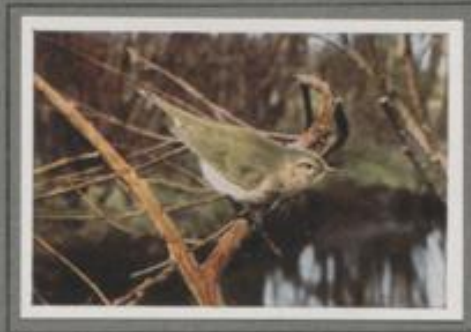
Der Weidenlaubvogel ( Phylloscopus rufus )

Durch das sparrige Gedaöl der alten Eiche huschen die Strahlen der Junivonne. Hoch oben in den Kronen ruht der Tauber. Als aber der Stogler verschweigt, erklingt ein schnarrendes, zartes „Zrh, zrh“ aus der Höhe. Der Baumläufer malert sich, und richtig, dort an dem dicken Ast kucken zwei maugraue Vögelchen. Hürth geht's hin und her. Hier wird gepickt, dort die riesige Rinde untersucht, und an manchen Plätzen findet sich ein lehrerer Blasen. Schnell sind die gewieslichen Vögelchen in ihre Bewegung. Dem Beobachter bieten sie einen belustigenden Anblick.