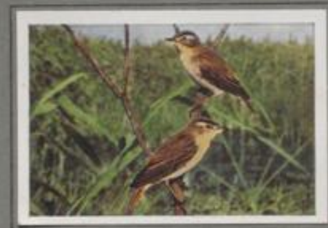
Der Schilfrohrsänger ( Acrocephalus phragmitis )

Aus dem breiten Schilfgürtel in dem verwumpften Wiesengebiet blüht der starke Saugel eines stillen Wellens in den blauen Frühlingshimmel. Hier brüllt die Drossel in den lauen Nächten, und die Säms im Rohr knarren im Nachtlied. Vor wenigen Tagen ist der Drosselrohrsänger angekommen, und er schmettert seine Tanfänge in das Frühlingsabend, die in einem harten „Karr, karr-karr-karr“ endigt. — Im Rohrwald flüht er während des Sommers sein heimliches Dasein, bis ihn die kühlen Sommernächte zum Süden treiben.