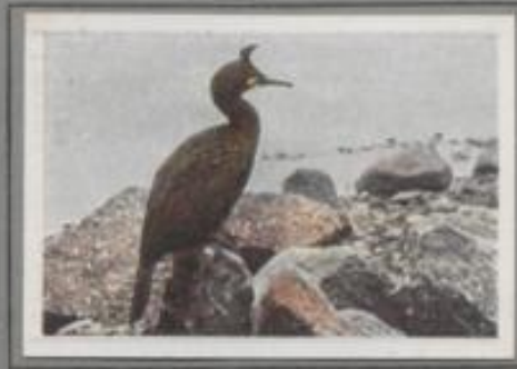
Die Krähscharbe (Phalacrocorax graculus)

Vor hundert Jahren brütete der Kormoran zu Tausenden im zentralen, norddeutschen Flachland. Im östlichen Holstein gab's damals eine riesige Kolonie mit fünfzig Nestern und mehr in einer Baumkrone. Der verursachte Schaden in den benachbarten Seen war sehr groß, man schritt deshalb zum Abschluß, der zur Vernichtung führte. Heute ist er in Deutschland sehr selten, nur auf Rügen, in Pommern und Ostpreußen genießt er noch eine Freistadt.