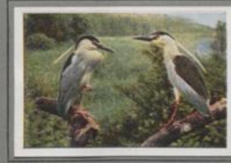
Der Nachtreiher (Nycticorax nycticorax)

Zwischen dem mattenen Röhre im blinkenden Sumpfwasser steht der Löffler. Schneeweiß ist sein Gefieder, zart und irisierfarben der Brustfleck, mattgelbes der Schopf, spatelförmig-eigenartig der Schnabel. Im unwegsamen Sumpf zieht er seine Brut groß, verbringt er den Sommer, doch frühzeitig streicht er südwärts. Welt ist sein Reizepriet, groß sein Wohngebiet; auch nach Deutschland kommt er als gelegentlicher Gast.