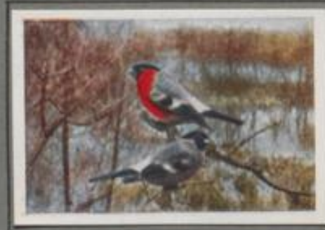
Der Gimpel ( Pyrrhula germanica )

Die Grünfinken, die im strengen Winter bei uns weilen, sind Gäste des Nordens; was im Lande brütete, ist südwärts gezogen. Im Frühjahr aber kehren sie zurück und grüßen mit ihrem beschalenden Liedlein die Heimat. Wenn die fünf Jungen im Neste pieren, hilft der Vater bei der Versorgung. Er sucht die zartesten Samen, und mit dem Schnabel hat es ein Ende. Zum Juni ist die Brut flügge. Die Alten aber brüten noch einmal im selben Nest.