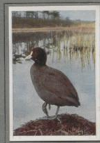
Das Bläuhuhn ( Fulca atra )

Es führt im Rohrwald ein verborgenes Dasein, verrät sich aber durch seinen Ruf „Körk, körk“ oder „Kurr, kurr“. Die Schlüsselsteine bietet ihm alles, was das Leben verlangt: Nahrung in Hülsen und Fische, dazu einen sicheren Brutplatz. Die Nester sind oft unordentlich, die Jungen aber lieblich. Die Nester sind oft unordentlich, die Jungen aber lieblich. Die Nester sind oft unordentlich, die Jungen aber lieblich. Der Herbst führt sie südwärts, nur wenige bleiben im Lande.