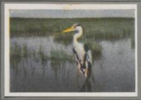
Der Fischreiher (Ardea cinerea)

In dem flachen Wasser zwischen den Schilfläichen des Sees steht reglos der Graureiher. Vom Hechte gejagt, fützen Weißfische heran! Da stößt der Dolchschabel ins Wasser, ein Fisch ist gefaßt und gleitet hinab in den Kropf. Nach einiger Zeit schlägt der Fischlieb den Aal, auch ein kleiner Hecht muß dran glauben. Dann rüttelt er die Schwimmem, rudert laut krächzend zur Ferst und setzt seine Brut. Über fähzig besetzte Horste stehen in den hohen Buchen. — Ein seltenes Naturdenkmal.