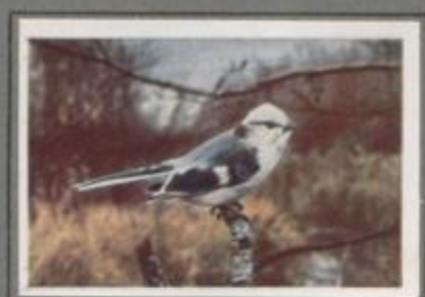
Die Lasurmeise (Parus cyanus)

Im Waldesbüsch des schliefelichen Sumpfes ziert eine Vordinstimme. Jetzt schaut ein perlgraues Köpfchen aus der Bläuhung, ein zweiter Vogel erachtet, und beide blitzen ins Röhricht. Sie tumen auf den Mahnen umher und besuchen Mücken, Spinnen, Fliegen und Larven. — Das Nest des Paares stand auf der Kruppe zwischen Seggen und Binsen. Die sechs Jungen sind flügge und legen auf eigene Faust, die Alten denken an das zweite Geleg, das Weibchen ist schon beim Baum.