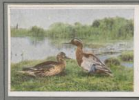
Die Knäkente ( Anas querquedula )

Die Stockenten, die Stammväter unserer Hausente, sind die häufigsten unter den Gründelenten. Sie beleben Fluß und See, sie besuchen oft die Gewässer in den Städten und mischen sich dort unter das zahme Geflügel. Die Löffelente ist seltener. Sie haust in sturmen Paaren auf unseren stillen Seen, und man hört selten ihren laisen Ruf. Durch ihren breiten, löffelförmigen Schnabel ist sie auch im Flug mit Sicherheit zu erkennen.