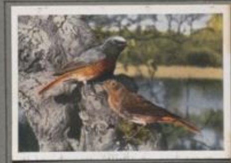
Der Gartenrotschwanz (Erlithacus phoenicurus)

Der Hausrotschwanz ist ein Zugvogel, der im Frühjahr einzeln zurückkommt und im Herbst familienweise nach dem Süden zieht. Der kleine, muntere Vogel liebt die Aussicht. Vom Hausgiebel und Kirchendach blüht er hinab auf das Treiben der Menschen. Die Insekten jagt er im Fluge, auch den krabbelnden Käfer weiß er geschickt zu erreichen. Ab Halbnachtsbrüter wählt er oft absonderliche Nistplätze, die durch die Wohnungsnot bedingt sind. Wer ein offenes Auge für die Natur besitzt, wird Nest-Nyffe mancherlei Art von diesem Vogel beobachten.