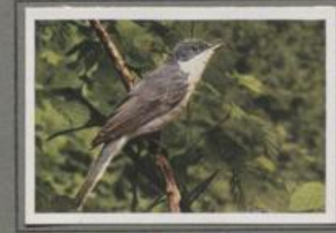
Die Zaungrasmücke (Sylvia curruca)

Von allen Grasmücken ist sie die unruhigste und lebhafteste „Schnell, schnell“, schreit ihre Losung zu sein. Sie flüht durchs Gestrüpp von Dornen und Brombeeren. Bald ist sie hier, bald schillert sie dort durch den Unterwuchs. Sie ist ein musischer Vogel, immer fröhlich und guter Laune. — Die Ankunft im Frühling verkündet das Mäuschen durch seinen angenehmen Gesang. Bald tönt es hell und melodisch, dann wieder folgen zirpende Laute. — Blattläuse in der Dichtung dienen als Nahrung, auch in der Raupen- und Käsezeit jagt sie gern.