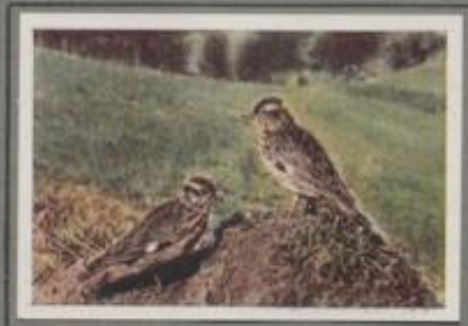
Die HeideLERCHE ( Lullula arborea )

Auf dem Heideberg kömmeret ein lückiger Wald aus Krüppelkiefen und Birken. Am Tage brännt die Sonne, jetzt ist es kühl, die Sterne flimmern, der Wind leuchtet, und still ist's, kirchenstill! Nun gerät ein Lied aus dunkler Föhrenkrone, weich und zart, schluchzend und schwer-mütig. Drüben an der Walddecke erklingt die gleiche Ton-folge, sanft wie Nachtsilbengewang. Der Jäger aber, der hebewärts streckt, vernimmt den Schritt und genießt den Heidezauber, das Heidebeständel. —