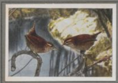
Der Zaunkönig ( Troglodytes parvulus )

Die kleine Majestät ist ein witterbarer Bursche. Das dicke Gefieder schützt gegen die grimmigste Kälte. Sie durchstößt die Schieferwände, und der dünne Schneebeliegt die überwinternden Kerbtierchen, Larven und Puppen aus den Häuten und Zäusen. Nahrungsmangel kennt sie kaum, deshalb zwitschert sie selbst mitten im Winter vergeblich ihr Lied. Juchzend und jubelnd aber erklingen ihre Stroschen, wenn die Lärche zur Frühjahrszeit das kleine Herz erfaßt. Wenn aber ein Feind sich nähert, zerrt und kramt der Gnom. — Ja, ja, den Kleinen steigt's gar schnell ins Köpfchen! —