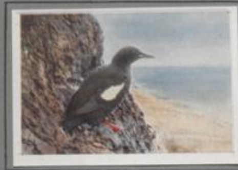
Die Gryll-Lumme (Uria grylle)

Der Baßtöpel ist ein hervorragender Flieger. Seine stark besetzten Brutkolonien befinden sich auf den Vorsprüngen steil zum Meer abfallender Felsküsten in Schottland, Irland und Wales. Hier herrscht zur Brutzeit ein chronisches Geräusch. Die Alten kommen häufig mit Flattern zum Nest, die sie tauchend erbeuteten, von den Jungen mit widerlichem Geräusch empfangen. — Als Gastvogel kommt er im Winter vereinzelt an unsere Küsten.