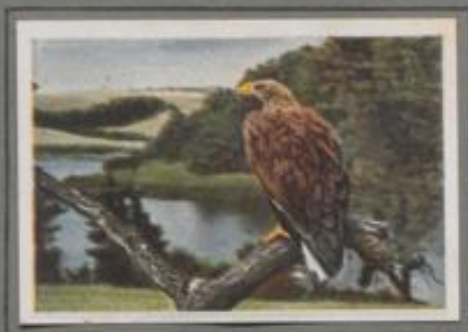
Der Seeadler ( Haliaeetus albicilla )

Vor einem Jahrhundert war der Seeadler noch ein häufiger Brutvogel in den deutschen Wäldern, heute steht er auf dem Aussterbestand. Er horstet noch in etwa zwanzig Paaren in den kaspischen Wäldern der sowjetischen, belgischen Provinzen und fördert dort seinen Brutanteil an Fischen und Wassergefäßeln. In den übrigen Gebieten beobachtet man den stolzen Vogel nur im Herbst auf seinen Wanderflügen.