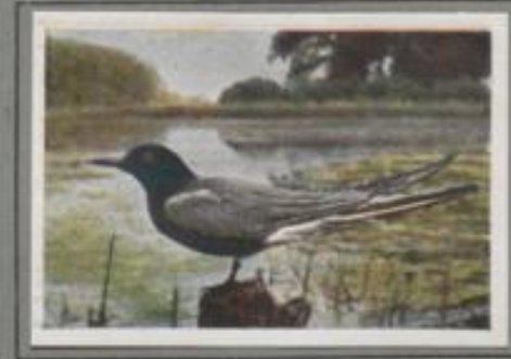
Die Trauerseeschwalbe ( Hydrochelidon nigra )

Sie ist die erste ihrer Gattung, die im April auf den Marsch- und Düneninseln der Nordsee eintrifft. Wer ihren schneidigen Flug bewundert und ihr krächzendes „Klarriet“ einmal gehört hat, erkennt sie wieder! Einige Wochen treibt sie sich in der Gegend umher, dann sucht sie sich ihren Brutplatz im angeschwemmten Gerast zwischen Muscheln, Tang und spärlichen Gräsern. Die gabelreißige See erndert mit ihren vielartigen Kleintieren Eltern und Kinder.