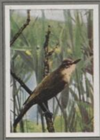
Der Drosselrohrsänger ( Acrocephalus arundinaceus )

Unter Blüten im schilfumrahmten Tümpel, Mücken spielen über dem Wasser, Enten queren, Klebitze ruhen. — Der Teichrohrsänger ist zurückgekehrt, und ebenfalls er noch steinblau ist, versucht er sich in verworrenen Wasser. Vom Morgen bis tief in den Abend hinein schnarrt und knarrt er im Rhythmus. Und immer wieder klingt's aus der Schilfdickung: „Tiri, tiri, tiri, tier, tier, tier, zack, zack, zack, zack-tiri, tiri, tiri, scherz, scherz, häß, häß, hi, hi, hi, hi“ in hundert Folgen.