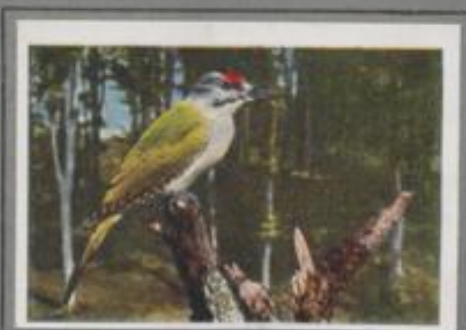
Der Grauspecht ( Picus canus )

Aus der Pappelallee an der Landstraße fliegt ein Vogel im Bogenfluge laut rufend dem Walde zu. Nach einmal klingt's wie Füllengewehr, dann ist es still, der Grünspecht hat seine Lieblingsbeschäftigung aufgenommen. Er fußt auf einem Waldfarnstengel, treibt einen Stollen in die Nadelstreu und zieht mit der nadelartigen, klebrigen Zunge Eier und Ameisen in den Schnabel. Er schmeißt seine Lieblingskost, bis der Eichenhäher kommt und ihn stört.