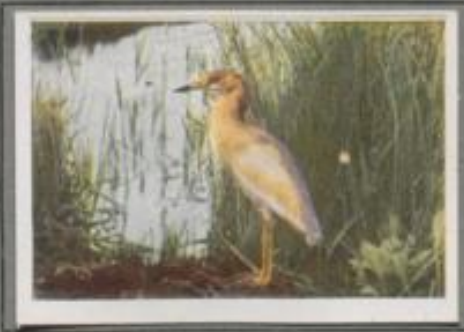
Der Schopfreiher (Ardeola ralloides)

In der Öde von Ruch und Fluß stehen die prächtigen Vögel. Schneeweiß ist ihr Federkleid und zierliche, rerschüssene Schmuckfedern ziern den Rücken, den Schenkel und Kropf. Den Jungvögeln zeichnen die Zierfedern. Zu dem Gefieder steht der schwarze Schnabel und das gelbe Auge im harmonischen Gegensatz. Der Mensch hat den eilen Vogel arg verfolgt der Schmuckfedern wegen, doch heute genießt er Schanung. Den Vogelkennern in Deutschland ist er kein Fremdling.