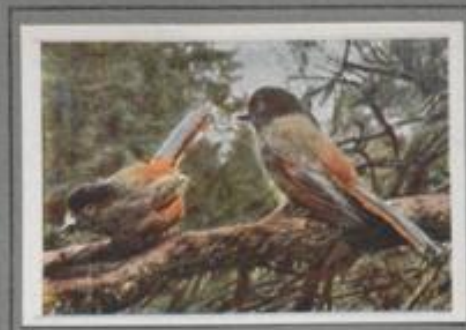
Der Unglückshäher ( Parus infestus )

In einer abrigen, krausköpfigen Kiefer sind die Tannenhäher groß geworden, in einem Nest, wie's die Eieler baut, nur die Aufsicht fehlt. Mit Käser und Raupen, Larven und Puppen wurden die Jungen gestrot, zum mancher Jung Singvogel ward ihnen zugebracht. Im Herbst gab's für alle eine üppige Zeit: Haselstrücker, Eichen und Buchen saßen voll Früchte, die Häher schweigten, die Dornstrücker lieferten Zucker.