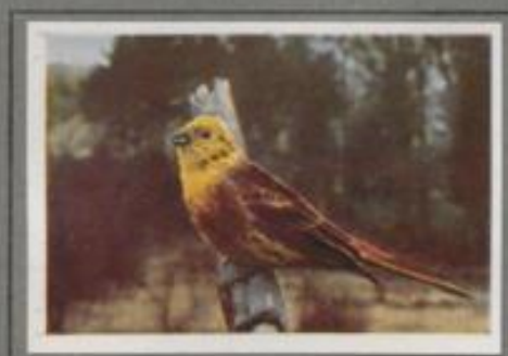
Die Goldammer ( Emberiza citrinella )

An dem schilfumsäumten Teich, bei dessen sunstigen Verlande Seepflanzen, Sumpfgewächse und Weiden wachsen, hat die Rohammer Quartier genommen. Als Kletter-künstler turnt sie von Halm zu Halm, bald auf den Schilf-spitzen, bald dicht über dem Wasser. Überall gibt's et-was für den Schnabel, hier Insekten, dort die Früchte der Sumpfgewächse. Häufig unternehmen sie einen Ausflug in das benachbarte Feld, doch bald kehren sie zurück in das flutende Röhrlent.