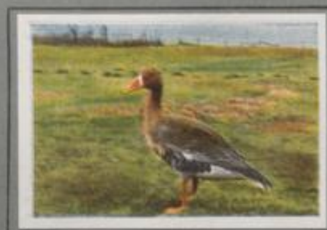
Die Bläugans (Anser sibiricus)

Die Graugans, die Stammutter der Hausgans, verbringt nur den Sommer auf unseren Gewässern; im Herbst zieht sie in südliche Breiten. Im zeitigen Frühjahr kehrt sie zurück und wählt zum Aufenthalt verwachsenen Teiche, Seen mit breiten Schilfrändern und woglose Sümpfe, von Feld und Wiese umrahmt. Hier kann man im Juni die Gänsefamilie beobachten. Die Mutter führt die Jungen, der Vater folgt als Wächter und schreit seinen Warnruf, wenn Gefahren drohen.