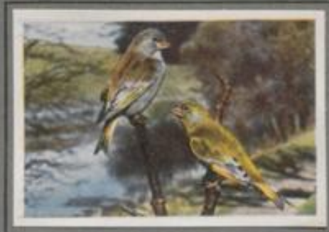
Der Grünfink ( Chloris chloris )

Der Hänfling ist der beste Sänger unter unseren Finkenvögeln. Mit seinem Ton- und Melodienreichtum können sich die übrigen nicht messen. Im April ist das Nest gebaut, sind die Eier gelegt, und nach vierzehn Tagen schlüpfen die Jungen. Die Eltern bringen die zarten Samen von Löwenzahn, Vogelminze, Täschelkraut und anderen Ackerunkräutern gemischt und im Kropf gewühlt den Kindern. Durch die Samenverfühlung der Unkräuter atmen die Hänflinge.