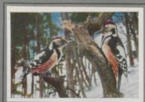
Der Mittelspecht ( Dryobates medius )

An dem trockenen Ast der sterbenden Eiche hakt der Buntspecht. Blitzschnell schlägt der Schnabel gegen den Zweig, ein Trommeln und Schnurren erklingt. Lange trommelt der Specht aus Freude am Klang. Dann geht's zur Nahrungssuche, und hier und dort wird die Borke durchschlagen. Im Herbst sammelt er Nüsse, klemmt sie in einen Spalt und sprengt die Schale mit sicheren Hieb. Im Winter treiben ihn die Samen der Kiefern und Tannen.