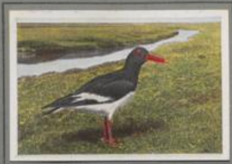
Der Austernfischer ( Haematopus ostralegus )

Auf den Wiesen prangt das erste Grün, die Märzsonne lacht, da sind die Kiebitze da! Sie tummeln sich in den Lüften und rufen „Kwitt, kwitt, hött!“. Sie vollführen riesige Flugzirkel, steigen anpor, schiefen hinab, wippen hin, beschreiben einen Bogen und man hört als dumpfes „Wahwuh!“ ihren Schwingenschlag. Dann fallen sie ein auf dem Rasen zur Nahrungssuche. — Ritzische Vögel sind's, und doch nimmt man ihnen die Eier, weil Schlemmer sie hoch halten.