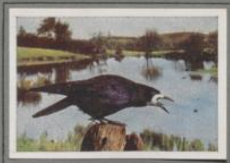
Die Saatkrähe (Corvus frugilegus)

Die Nebelkrähe ist Brutvogel des Odens und Werdens. In Deutschland ist sie betlich der Elbe heimlich. Im Herbst kommen die Graukrähen in starken Flügen und über-schwimmen das ganze Land. Sie sammeln ihre Nahrung auf den Feldern und besuchen in ihrer dritten Art die Dörfer und Städte. Auf den Schuttplätzen der Großstädte sind sie tägliche Gäste. Im Frühling verlassen sie die Winterheimat und strömen in die Brutgebiete.