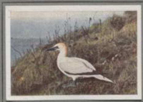
Der Baßtöpel (Sula bassana)

Sie ist im Südosten unseres Erdteils heimisch. In Ungarn kommt sie bereits als Brutvogel vor. Ihr Nest baut sie vornehmlich auf Säulen, zeitweilig aber auch im Schilf umfangreicher Sumpfbiete. Trotz der Schwimmhülle baumt die Zwergscharbe mühsam auf. Sie gleicht darin ihrem großen Verwandten, dem gemeinen Kormoran. Während die Krähscharbe vereinzelt an die Nordseeküste verschlagen wird, kommt die Zwergscharbe zuweilen nach Schlesien.