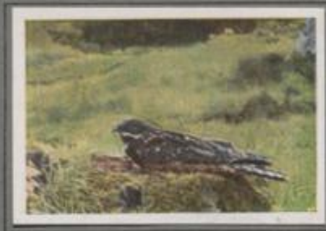
Die Nachtschnalbe ( Caprimulgus europaeus )

Auf drei Monate kommen die schnellen Flieger zu uns; im Mai sind sie da, zum August wieder verschwunden. „Schnell, schnell“, ist ihre Laune. Im rasenden Fluge jagen sie bald hoch über den Türmen, bald dicht über den Dächern. Nun ist's Zeit zum Anflug! Der Spatz wird vom Nest verjagt, der Star vom Giebel vertrieben, der Segler spurt ein Nestbau. Die Jungen sind hal! Die zwei, drei sind immer hungrig, und schnell wachsen müssen sie, denn bald verlassen sie das Nest.