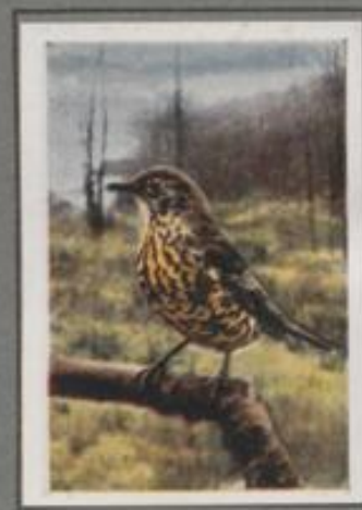
Die Misteldrossel (Turdus viscivorus)

Sie ist ein bekannter Vogel, heimisch in Park und Garten, im Feld und Wald. Im Februar, bestmännlich in den ersten, sonnigen Märztagen, hört man ihr melodisches Lied. Vom Hauptstiel klingt's herab, schmerzlos und schwach-will. Und wieder hebt der Sänger an — doch plötzlich schneit er ab mit scharfem Anstrich „Tack, tack“, mit gelendem „Galschickelick“ und verschwindet im dichten Gebüsch. Es dunkelt, und in dem Abend horcht man vergebens auf ein neues Lied des gestörten Sängers.