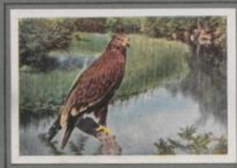
Der große Schreiadler ( Aquila clanga )

In der Bruchwaldung am Fluße hat ein Kaiseradlerpaar seinen Horst. Seit Jahren brütet es dort, und das Nest wächst alljährlich in Höhe und Breite. Wieder liegen zwei Eier im Nest, und endlich schlüpfen die Jungen. Nach zweimonatlicher Pflege sind sie flügge. Erst jagen sie mit dem Eltern, dann heißt's allein das Beutetier bezwingen. Das stärkere Weibchen schlägt seinen ersten Hasen, und stolz blickt der Sieger in die Runde.