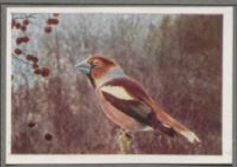
Der Kirschkernebeißer ( Coccothraustes vulgaris )

Der Juli ist da! Die Kirschbäume glänzen im Rot ihrer Früchte, und mancher Vogel kommt als Gast. Starke und Drosseln rauben das Fruchtfleisch, der schone Pirat kommt vom Walde her und nascht. Zuweilen stellt sich auch der Kernebeißer ein. Er schält mit dem kegelförmigen, klüppigen Schnabel das saftige Fleisch von den Kernen und wirft es auf den Erdboden, den Kern aber knackt er, entfernt die Schale und verzehrt ihn als Leckerbissen. — Ein sonderbarer Gast!