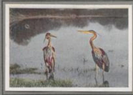
Der Purpurreiher (Ardea purpurea)

In dem flachen Wasser zwischen den Schilfläichen des Sees steht reglos der Graureiher. Vom Hechte gejagt, fützen Weißfische heran! Da stößt der Dolchschabel ins Wasser, ein Fisch ist gefaßt und gleitet hinab in den Kropf. Nach einiger Zeit schlägt der Fischlieb den Aal, auch ein kleiner Hecht muß dran glauben. Dann rüttelt er die Schwimmem, rudert laut krächzend zur Ferst und setzt seine Brut. Über fähzig besetzte Horste stehen in den hohen Buchen. — Ein seltenes Naturdenkmal.