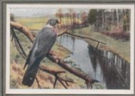
Die Ringeltaube ( Columba palumbus )

In der Buche am hohen Ufer des Wiesentales fließt die Ringeltaube. Sie verläßt ihren Sitz und klappert mit hartem Flügelchlag zum Fichtenherd der Feidhütung. Auf dem obersten Astreis einer Tanne fällt sie ein und ihr ruckender Ruf, ihr melodisches „Gru-gruh, gru-gruh, gru-gruh“ löst durch den Frühlingsmerges. Der Tauber ruft sein Weibchen! Sie streicht herzu, und beide schwebeln sich zärtlich. Dann zeigt das Männchen der Liebsten seine Flugkünste.