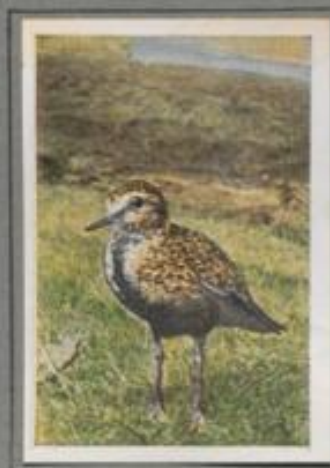
Der Goldregenpfeifer ( Charadrius apricarius )

Er ist ein Küstenvogel, der nur selten den Flössen und Seen des Binnenlandes einen Besuch abstattet. In Deutschland lebt er als Brutvogel, doch auch im hohen Norden baut er sein Nest. Sein Ruf ist klingvoll: „Tüi, töi“, so lauten sie, wenn sie am Strand umherrennen. Wenn in den Spätsommermonaten die nach Africa ziehenden Vögel stillig rufen, rechnen die Küstenbewohner auf Regen, sie sind ihnen Wetterkates.