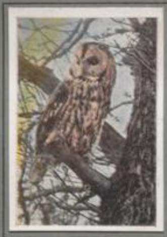
Der Waldkauz ( Syrnium aluco )

Die prächtige Habichtseule ist ein Bewohner Nord- und Osteuropas. In Deutschland kommt diese Großeule nur in Ostpreußen als Brutvogel vor. Nach den übrigen Provinzen verstreicht sie sehr selten. Unheimlich ist ihr Ruf, der zur Balzzeit durch die weiten Wälder erklingt. Und rüchlich ist sie, wie alle Eulenarten, denn die Maus ist ihre Hauptnahrung. Deshalb gerät sie gewaltig dauernde Schamung wie alle Vertreter des Eulengeschlechts.