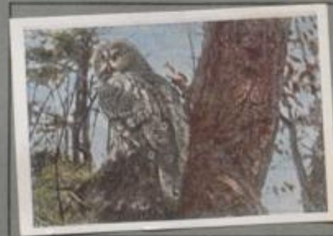
Der Lapplandskauz ( Syrnium lapponica )

Februarabend! In der Feldhölzung am Dorfe ruft der Kauz sein hehles „Huh... hu... huhuhuhuh“. Der unheimliche Ruf endet in ein heulendes Lachen. Bevor das Echo verklingt, erschallt's mit gleicher Stimme aus den Linden am Kirchhof. — So werben die Waldkäuse in langer Winternacht laut rufend um Liebesglück, selbst an den düsteren Tagen erklingt vereinzelt ihr Ruf. Wenn aber die Weibchen in einer Baumhöhle mit dem Brutgeschäft beginnen, führen nur noch die Männchen das Wort.