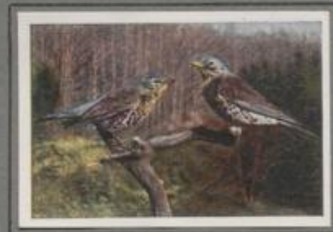
Die Wacholderdrossel (Turdus pilaris)

Am dem Hochwalde zügig Drosselchlag! Helles, klare Färbung sind es, aber weicher abwechselnd als das Schwarzdrosselbild. Es ist die Misteldrossel, die dort der Nimmstiel singt. Sie lebt für sich, sie hat die Einsamkeit im stillen Forst, sie ist zänkisch und futterstisch. Im Walde findet sie einen passenden Brutplatz und Nahrung für sich und die Kinder. Zur Zeit der Drosselzeit hat sie im Überfluß.