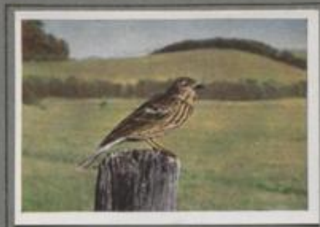
Der Baumpieper (Anthus arboreus)

In der Zeichnung des Gefieders ähnelt die Pieper den Lerchen. Nach ihrem Benehmen sind sie mit den Buchsteinen verwandt. Sie lieben das freie Gelände, nur der Baumpieper macht eine Ausnahme. Er siedelt sich am Waldrand und auf Waldhöfen an, kommt aber auch in Parks und Obstgärten. Sein Schrei ist laut und wohlklingend. „Zipp, zipp, zipp, zipp, da, da, da, da“, so erklingt's aus dem Buschwerk. Singend steigt der kleine Vogel schräg in die Luft, macht eine Wendung, und im Schwabfluge gleitet er wieder hinab ins Buschwerk.