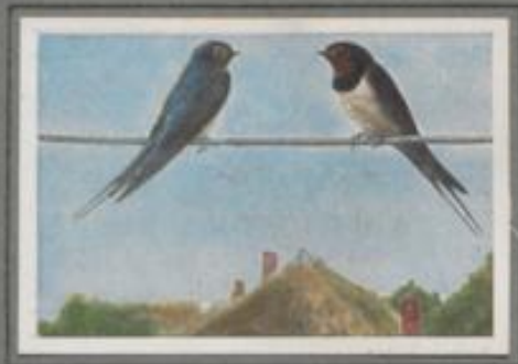
Die Rauchschnalbe ( Hirundo rustica )

Menschen und Schnalben sind gut Freunde seit uralten Zeiten. Wo ein Haus entsteht, wo eine Stallung gebaut ist, da stellt die Rauchschnalbe sich ein. Man gibt ihr gern einen Platz fürs Nest am Balken, und man hält Tag und Nacht ein Fenster geöffnet für den Aus- und Einflug. Besonders beobachtet jeder den Bau des kunstvollen Nests. Ein entzückendes Bild bietet die belebte Aufsicht der Jungen, und wehmütvoll sieht man im Herbst die Neuen Heimkommen schlüpfen.