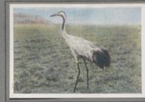
Der Kranich (Megalornis grus)

Ein strahlender Sommertag geht zur Rüste. In goldiger Pracht versinkt die Sonne. Das Königsmoor liegt im flimmernden Licht. Dort facht am verwachsenen Tümpel der schone Waldstorch. Der blutrote, hügelige Abend-schein glüht und funkelt und sprüht in dem metallischen Glanz seines Gefieders. Noch einmal zuckt der heimliche Flächler des Tümpels, dann streicht er mit vollem Kruf zur Forst, wo in dem mächtigen Nest vier fast flügge Jungvögel auf ihn warten.