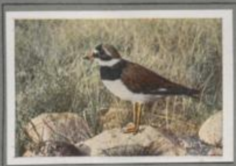
Der Sandregenpfeifer ( Charadrius hiaticula )

Er ist ein Küstenvogel, der nur selten den Flössen und Seen des Binnenlandes einen Besuch abstattet. In Deutschland lebt er als Brutvogel, doch auch im hohen Norden baut er sein Nest. Sein Ruf ist klingvoll: „Tüi, töi“, so lauten sie, wenn sie am Strand umherrennen. Wenn in den Spätsommermonaten die nach Africa ziehenden Vögel stillig rufen, rechnen die Küstenbewohner auf Regen, sie sind ihnen Wetterkates.