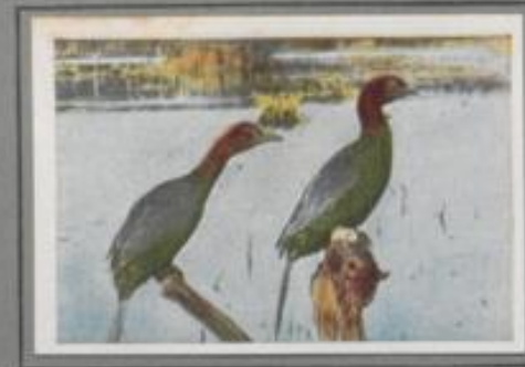
Die Zwergscharbe (Phalacrocorax pygmaeus)

Die Krähscharbe nistet an den Felsküsten Norwegens, Englands und Westeuropas. Auch sie brütet in Kolonien. Es bietet einen herrlichen Anblick, wenn die im Sonnenlicht metallisch glänzenden Vögel wie ringende Kreuze zu ihren kreischenden Jungen schwärmen. Das gebirgige Meer umfließt die gefährlichen Felsen mühsam, dort dübelt man sie, die Gewässer des Binnenlandes verschonen sie allgemein mit ihrem Besuch.