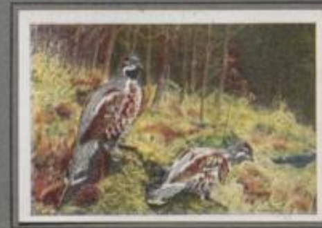
Das Haselhuhn ( Tetrastes bonasia )

Die Nacht verliert, die Halle im Osten kündigt den neuen Tag. Ein vielstimmiger Chor gibt sein Konzert im Mauer. Bekanntes muckern, Klackern ruhen, Bruchvögel flühen, Enten quarren. Und da und dort im weichen Nebel er- tönt ein Klacken und Trommeln, ein Rufen und Zischen. Dann kommt die Sonne mit ihrem goldigen Licht und zwingt die missetzten Sänger. Bis in den leuchtenden Tag dauert das wilde Spiel, dann verstummen die Wächter des Nocturn.