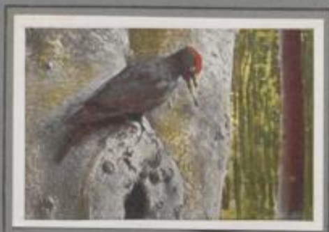
Der Schwarzspecht ( Dryocopus martius )

Dreihundertjährige Eichen und alte Birken stoßen auf den Hängen zum See. Mancher Baum ist altersschwach und morach im Innern, der Schwarzspecht kennt sie alle. „Kiläh, kiläh“ ruft der feuerköpfige Zimmermann, der zu einem Stamm schwirrt und seinen Schnabel gebraucht. Schläge hallen, Borkbohlen fliegen! Drauf schiebt er die nachtspitze Zunge in die Öffnung, zückt einige Käfer und Larven heraus und verzehrt sie. Erst sättigt er sich, dann zimmert er die Nisthöhle.