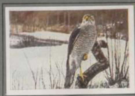
Der Hühnerhabicht (Alterskleid) (Astur palumbarius)

An dem stillen Waldweber fußt auf einem Pfahl ein junges Habichtweibchen und lugt verlagend nach dem Bläuhühner hinüber, die vor dem Scheitrande knicken. In dem nächsten Herbst in der Buchenzone in Stielböschung trat es ins Leben. Lange sitzt die sorgende Mutter ihre drei Lieblinge. Jetzt schlagen sich die Kinder allein durchs Leben. Bald jagen sie im Wald, dann wieder erdzen sie ihre Beute auf Feld und Heide.