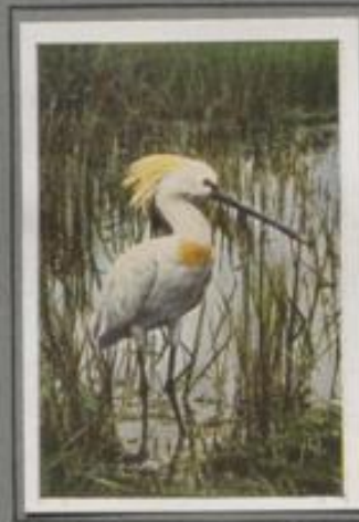
Der Löffler (Platalea leucorodia)

In der Sumpf- und Rebrwildnis, wo der Seldereiher brütet, ist auch der Schopfreiher zu Hause, der Basak der Sippe. Ein sanftes Ockergelb auf der Ober- und ein zartes Weiß auf der Unterseite sind seine Hauptfarben. Den Nacken zieren bandartige Federn. Die Hinterrückenfedern sind mähenartig verlängert; die Zierfedern des Rückens besitzen haarförmige Härte. Er lebt in Südwest- und in Südosteuropa und kommt selten nach Deutschland.