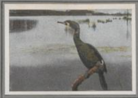
Der Kormoran (Phalacrocorax carbo)

Vor hundert Jahren brütete der Kormoran zu Tausenden im zentralen, norddeutschen Flachland. Im östlichen Holstein gab's damals eine riesige Kolonie mit fünfzig Nestern und mehr in einer Baumkrone. Der verursachte Schaden in den benachbarten Seen war sehr groß, man schritt deshalb zum Abschluß, der zur Vernichtung führte. Heute ist er in Deutschland sehr selten, nur auf Rügen, in Pommern und Ostpreußen genießt er noch eine Freistadt.