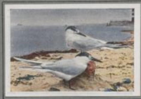
Die Brandseeschwalbe ( Sterna cantilaca )

Ende April kommt sie an unsere Meeresküsten und auf Fluß und See im Binnenlande. Überall dort, wo sie flache, kleinsge Ufer findet, siedelt sie sich an, verbringt sie den Sommer. Von den weißen Seeschwalben ist sie die bekannteste. Nach heimlicher Brut streichen die hübschen Vögel ruhlos von Gewässer zu Gewässer, bis im September die große Winterfahrt beginnt, die sie über Südwesteuropa nach dem tropischen Afrika führt.