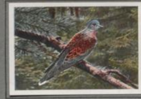
Die Turteltaube ( Streptopelia turtur )

Es ist im Vorfrühling. Die Weiden tragen goldene Kätzchen, der Haal schwenkt seine Trudeln, es streicht ein Flug Hohltaube zu Holz und fließt in einer Eichenkronen ein. Die Auen überstehen sich, andere schweben zur Erde, im Wipfel aber heult ein Tauber „huuk-huuk, huuk-huuk“. Dumpe, hund und rühend klingt das eigenartige Lied. — Zwei Pärchen nischen im Wald und brüten in den Höhlen des Schwarzbuchs, die anderen suchen in der Umgebung zuspähe Brutplätze.