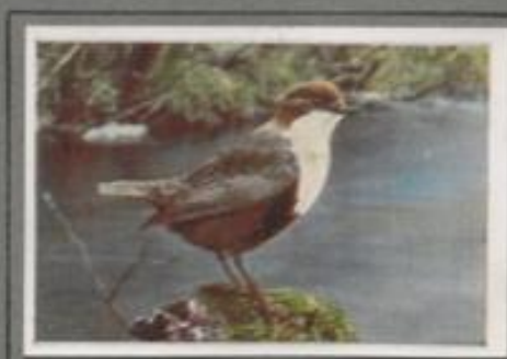
Die Wasseramsel ( Cinclus cinclus )

Der Schnee stob, die Tannen tragen schwere Polster. Am nächsten Tage glitzert der Wald im Sonnenschein. Da packte den Kreuzschnabel die Liebe, und er jubelte: „Giholla, iholla, gaha“. Das Männchen sang, das grün-grüne Weibchen formte das Nest aus Fichtenzweigen, webt Nadeln und Flechten hinein, legte Eier und brütete. Die Jungen schlüpften; die Eltern fütterten mit Nadeln aus Fichtennadeln, und bevor noch andere Sänger an den Nesten haften, war die Brut groß trutzte Schnee und Kälte.