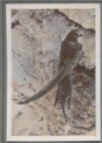
Der Mauersegler ( Apus sp. )

Dicht unter dem oberen Rande der Kletterrinne sind die Stollenöffnungen zu den Nesthöhlen der Uferschnalben. Schwarz haben die zarten Vögel an den Bauwerken mit Schnabel und Krallen gearbeitet. Die Weibchen betten sorglos in der dunklen Behausung, die kein Feind erreicht, die Männchen sorgen für Nahrung. Die zu- und abfliegenden Eltern sind aber von Gefahren umgeben; ein Baumfalckenpaar brütet in der Höhe und erjagt oft einen der schnellen Flieger.