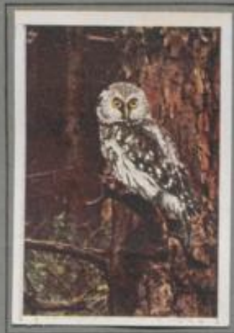
Der Rauhfußkauz ( Aegolius fengmalini )

Mittenwelt dehnt sich die Forst. Der Märzwind singt, die Sterne blinken — still ist die Nacht! Plötzlich erklingt der Balzruf des Uhus, das Weibchen antwortet mit einem lauchenden, hohen „Huhuhuh“ in wilden Modulationen. Und dann gleiten zwei große Schatten im unhörbaren Fluge das Gestirn hinab, und sie jöhren und fauchen, knaggen und kreischen in wirbelnder Fahrt. Stürmische Liebesworte, unheimliche Klänge, grußige Rufe, Stimmen der Nacht!