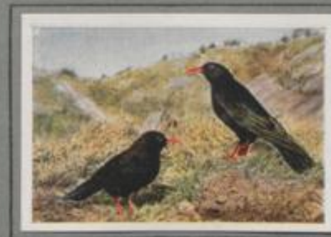
Die Alpenkrähe (Pyrrhocorax ferrugineus)

Die Dohlen kehren im März an ihre Brutplätze zurück. Sie umkreisen mit lautem „Jack-jack“ den Kirchturm des Heimatstädtchens und suchen sich eine Nesthöhle in den dunklen Winkeln zwischen Dach- und Balkenwerk. Andere wiederum bauen im Schornstein der Häuser zum Ärger der Besitzer, und noch andere suchen sich Nesthöhlen in menschlichen Blüten. Die Dohlen sind ein munteres Volk, in der Gefangenschaft erfreuen sie ihren Pfleger durch ihr zutrauliches Wesen.