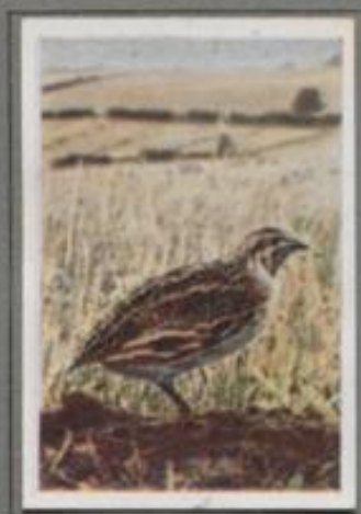
Die Wachtel ( Coturnix coturnix )

Im Mai brütet das Weibchen im Kiewschlag am Bruch- beren, doch die Eier holt der Dachs. In der Heide vom Felds kam es zur zweiten Brut. Die Jungen schlüpfen und leben dort gut, denn am Boden liegen Grassaat und Heidefrüchte, und im Guckel krabbeln Käfer und Spinnen. Das Volk wurde groß, doch es kam die Kälte — der Jäger mit seinem Hunde! Schüsse knallen, Hüner fliehen — und die Alten lachten im Abenddunkel vergnügt auf sich und ihre Kinder.