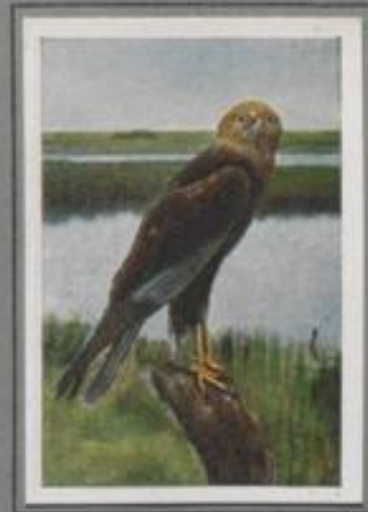
Die Rohrweihe ( Circus aeruginosus )

Gluthete war der Tag. Jetzt weht ein köhles Lötchen, der Abend naht. Still ist's auf dem Felde. Plötzlich schreit's in den Lüften „Ku — ku“. Über der Mauerstange rüttelt in Baumhöhe der Ruf, der Turmfalke. Jetzt flingt er weiter, rüttelt wieder, schwenkt, schließt sich zur Erde und schlägt die Maus am Feldrande. Zehn Mäuse und mehr krallt und kröpft er an manchen Tag. Der Landmann ist ihm dankbar, denn auf den Feldern winnmet's von den heiligen Nagen.