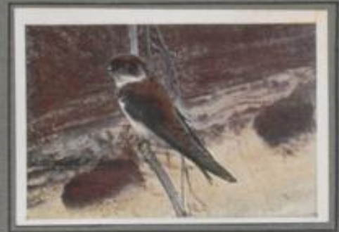
Die Uferschnalbe ( Riparia riparia )

Unter dem Dachüberstand des Wohnhauses haben die Hausschnalben ihr Nest gebaut. Eng beieinander kleben hier ein Dutzend Nester und mehr. Die Jungen sind bald flüchtig. Wenn die Eltern — den Schnabel voller Insekten — nahest, drängen sich die Kinder zur Nestöffnung und betteln um Futter. Nach einigen Tagen, dann fliegen sie den Eltern zur Inspektionszeit und üben sich in den Flugübungen. Nach dem Abzug der Schnalben beziehen die frechen Spatzen die verlassenen Nester.