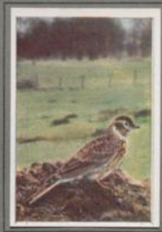
Die FeldLERCHE ( Alauda arvensis )

Auf dem Heideberg kömmeret ein lückiger Wald aus Krüppelkiefen und Birken. Am Tage brännt die Sonne, jetzt ist es kühl, die Sterne flimmern, der Wind leuchtet, und still ist's, kirchenstill! Nun gerät ein Lied aus dunkler Föhrenkrone, weich und zart, schluchzend und schwer-mütig. Drüben an der Walddecke erklingt die gleiche Ton-folge, sanft wie Nachtsilbengewang. Der Jäger aber, der hebewärts streckt, vernimmt den Schritt und genießt den Heidezauber, das Heidebeständel. —