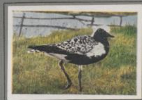
Der Klobitzregenpfeifer ( Squatarola squatarola )

Der stattliche Vogel in seinem Brokatsfeld ist der schönste der Sippe. Er bevorzugt nördliche Gebiete, er kommt aber auch auf das Hochmoor des norddeutschen Flachlandes als Brutvogel vor. Am häufigsten beobachtet man ihn auf dem Herbstzuge an der Nordsee. Im grauen Watt und auf dem grünen Vorlande rennt er umher und sucht stillig nach Nahrung. Nach kurzer Ruat zieht er weiter und endet schließlich seine Fahrt in Mittel- oder Südtrika.