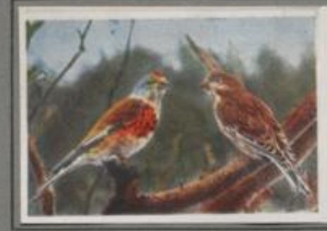
Der Hänfling ( Acanthis cannabina )

Er ist überall in unsern Ländern, doch nirgends häufig. Jeder kennt ihn, und in manchen Gegenden hält man ihn gern als Zimmervogel. Im Herbst streicht er in kleinen Scharen über die Felder. Im schnellen Fluge geht's zur Kiste am Wegrande, und sie klauen die Früchte. Dort turnen zwei der bunten Vögeln auf dem Fruchtstand der Obstbäume und lassen sich die Samen schmecken. Ja, Distelsamen, das ist etwas für den Stieglitz, deshalb heißt er auch Distelfink.