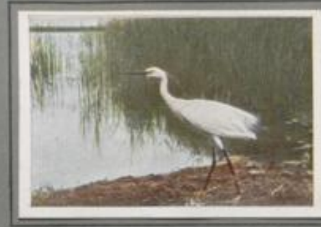
Der Seldereiher (Ardea garzetta)

Zur Sumpfwildnis des Flachlandes sind die Purpurreiher zurückgekehrt. Dort bauen sie im Mai in den Schilfdickungen ihre Nester und ziehen im Sommer ihre Brut groß. Nahrungreich ist der Sumpf; dort wimmelt's von Kaulquappen und Fröschen, von Wasserinsekten und Fliegen. Im Herbst umkreisen die Reiher das Röhricht in schönen Spiralen und streichen dann südwärts. Auf diesen Wanderflügen berühren sie oft deutsches Land — die stolzen Vögel des rauschenden Rohrwaldes.