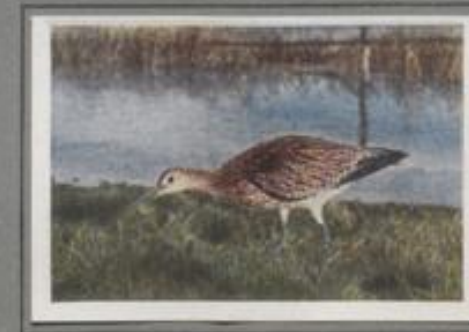
Der große Brachvogel (Numenius arquatus)

Der Haß der Frühlingsnacht verheert das Moor, der Morgen graut, die Birklöhne pödeln, und mancher anderen Stimmen mischen sich zum Frühkonzert. „Plick-plick-plick-plick-plick-plick“, so ruft's am Tümpel und durch ein Schwären, zwei Bekassine fliegen auf, jagen sich im Zickzackfluge, die Luft fährt saugend durch die gespritztes Schwanzfedern, und ein Meckern erklingt. Sie zum Sonnenlichtes tummeln sie sich im Liebespiel, dann wohnen sie im Moor.