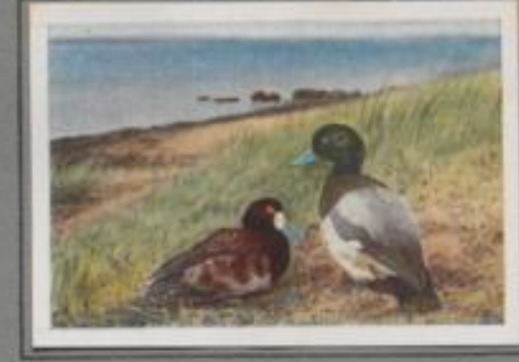
Die Bergente ( Nyroca marila )

Die Tafelente ist die am meisten auffallende Tauchente der Gewässer des Binnenlandes. Im Frühling beobachtet man sie vielfach paarweise auf Teich und See, vom Fuße der Alpen bis zur Küste des Meeres. Im Herbst kommen sie in Schwärmen aus den skandinavischen und russischen Brutgebieten. Auf den Fjorden der Ostsee und dem westlichen Inlande verbringen diese den Winter, der Frühling führt sie wieder nordwärts.