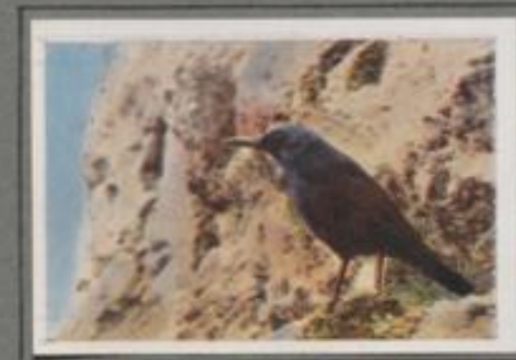
Die Blaudrossel (Monticola cyaneus)

Die Ringdrossel lebt vornehmlich im Gebirge, in der Ebene ist sie selten. Die Waldgrenze am Bergeshang wählt sie gern zum Aufenthalt. Im Kiebelholz baut sie ihr Nest, im Monat Juni wird die Brut flügge, und bald schlagen sich die Jungen allein zuruche Leben. Auch sie meiden die leuchten Täler und bleiben auf den stillen Höhen, bis sie im Herbst südwärts wandern. In lichten Wäldern halten sie Nest, suchen nach Beeren und Erdnast, und erreichen endlich ihr Winterquartier.