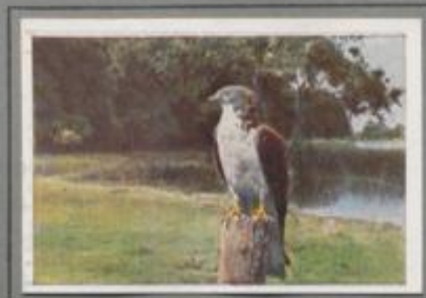
Der Wespenbussard ( Pernis apivorus )

Im Herbst kommt er aus dem Norden und Osten zugewandert. Als „Anstandsflieger“ blockt er auf Pfählen, Grenzsteinen und Erdtrümmern und wartet geduldig auf das Erscheinen der Maus, die er mit Vorbehalt kröpft. Wenn aber im Winter der Schnee die Erde deckt und der Hunter ihn quält, wächst seine Angriffslust. Dann herwingt er mit Krallen und Schnabel das Kaninchen am Waldrande, auch der Hase wird ihm flüchtig zur Beute.