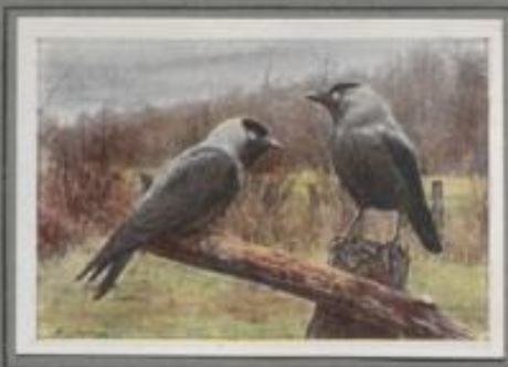
Die Dohle (Columba monedula)

Während der Korkrabe vornehmlich in Schilfwald-Nebsteln, die Rabenkrähe nur westlich der Elbe und in Holstein vorkommt, ist die Saatkrähe über ganz Deutschland verbreitet. Sie brütet in Kolonien. Oft findet man zwanzig Nester und mehr in einer Baumkrone. Die alten, purpur-glänzenden Vögel haben eine kahle, grau, gelblich Schnabelwurzel. Auch durch ihr heiseres, langgezogenes „Krah, krah“ unterscheiden sie sich von dem übrigen Krähenvolk.