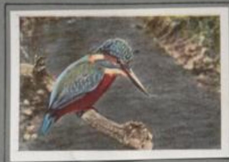
Der Eisvogel ( Alcedo ispida )

Auf tropischem Aat an stiller Seebucht lauert der Eisvogel auf Beute. Jetzt schießt er in die durchsichtige Flut, packt einen winzigen Fisch und kröpft ihn auf einem Fiedling am Ufer. Als aber Störung kommt, schwirrt er wie ein legendärer Edelstein über den blinkenden See, schreit sein durchdringendes „Tittitititit!“ und sucht sich einen neuen Anlauf am Ufer. — Im harten Winter hungern die hübschen Vögel, und viele verkommen.