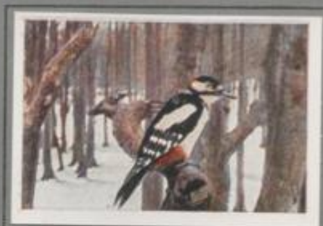
Der große Buntspecht ( Dryobates major )

Dreihundertjährige Eichen und alte Birken stoßen auf den Hängen zum See. Mancher Baum ist altersschwach und morach im Innern, der Schwarzspecht kennt sie alle. „Kiläh, kiläh“ ruft der feuerköpfige Zimmermann, der zu einem Stamm schwirrt und seinen Schnabel gebraucht. Schläge hallen, Borkbohlen fliegen! Drauf schiebt er die nachtspitze Zunge in die Öffnung, zückt einige Käfer und Larven heraus und verzehrt sie. Erst sättigt er sich, dann zimmert er die Nisthöhle.