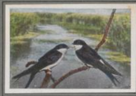
Die Mehlschnalbe ( Hirundo urbana )

Menschen und Schnalben sind gut Freunde seit uralten Zeiten. Wo ein Haus entsteht, wo eine Stallung gebaut ist, da stellt die Rauchschnalbe sich ein. Man gibt ihr gern einen Platz fürs Nest am Balken, und man hält Tag und Nacht ein Fenster geöffnet für den Aus- und Einflug. Besonders beobachtet jeder den Bau des kunstvollen Nests. Ein entzückendes Bild bietet die belebte Aufsicht der Jungen, und wehmütvoll sieht man im Herbst die Neuen Heimkommen schlüpfen.