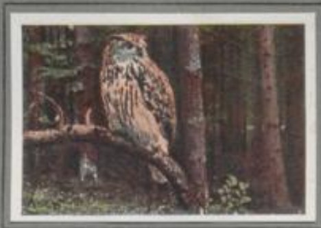
Der Uhu ( Bubo bubo )

Mittenwelt dehnt sich die Forst. Der Märzwind singt, die Sterne blinken — still ist die Nacht! Plötzlich erklingt der Balzruf des Uhus, das Weibchen antwortet mit einem lauchenden, hohen „Huhuhuh“ in wilden Modulationen. Und dann gleiten zwei große Schatten im unhörbaren Fluge das Gestirn hinab, und sie jöhren und fauchen, knaggen und kreischen in wirbelnder Fahrt. Stürmische Liebesworte, unheimliche Klänge, grußige Rufe, Stimmen der Nacht!