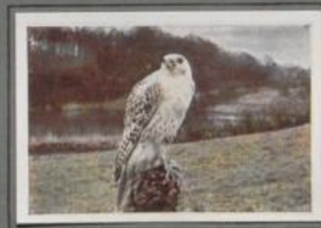
Der große Gertfalk (Falco rusticolus)

Der Mai ist im Lande, da kehrt das Baumfalkenpärchen aus dem sonnigen Süden in die nördliche Sommerheimat zurück, und die zehrenden Kleinvögel melden die Ankunft. Der jubelnden Lerche erstirbt unter dem Würgegriff der Räuber das Lied in der Kühle, selbst die flinke Schwalbe wird von den hartnäckigen Verfolgern erjagt. Wenn die Jungst die Paare im Neste gliren, wöhnen sich die Alten auch der Insektenjagd.