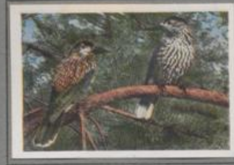
Der Tannenhäher ( Nucifraga caryocatactes )

Wie ein bunter Schmetterling schwebt der Eichelhäher im grellfarbigen Horrenkleide durch den Wald. Er sitzt in einer Eiche ein, sträubt die Schwanzfedern, flüstert, singt stolze liebliche Töne, schrillt einige höllische Laute und ist dann still. Er besetzt das Blattwerk und verzehrt einige Raupen. Dann erregt er eine Laubverwirrung, quatscht vorwärts, mordet die Brut und krummert sich nicht um den Ansehn der betrogenen Eltern.