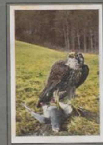
Der Wanderfalk (Jugendkleid) (Falco peregrinus)

Auf morschem Ast an dem verschneiten Wiesentale blöckt das alte Habichtweibchen und hält Ausschau nach Beute. Reglos fuß es dort, das einen Farn im Federkleid gesungen, und der Blick schweift über das schlafende Feld. Mit hartem Schwingenschlag klappert eine Taube zur Forst. Wie der fliegende Pfeil verläßt der Habicht seinen Sitz und schlägt am Waldrand sein Opfer. Hal, wie der Schnabel rufft, hui, wie die Federn fliegen! Und dann hält der Singer sein Mahl!