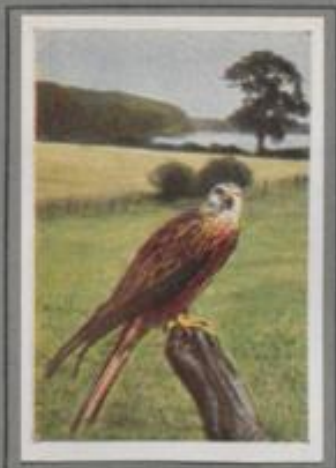
Der rote Milan ( Milvus milvus )

Im Kiefernholz auf sonnigen Höhenrücken haben die „Wespenbussarde“ ihr Nest. Zwei dunkelbraune Junge hecken im Nest, das mit belaubten Birkenreisern geschmückt ist. Die Nestlinge gierig, wenn die Alten mit Hummel- und Wespenwaben nahen. Sorgfältig zupfen sie die Puppen aus den Waben, der geländete Kuchen liegt über den Nestrand. — Im September zieht die Sippe südwärts, und erst im Mai kehren die Alten zu ihrem Brutplatz zurück.