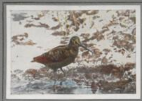
Die Waldschnepfe (Scolopax rusticola)

Daß sie kommen sie! In der Dämmerung gaukeln sie wie dunkle Schatten über den Jungwuchs dahin. Hastig geht die Jagd, bald über die Wälder, dann das Gestell hinaus, biszul über die Blöße, und ein seltsames Quorren, Murraan und Pultzen erklingt — die Schnepfen ziehen nach Nord- und. Mänsche bislaan im Lande und schreiten in gerä- reichen Waldungen zur Brut. Im Herbst schleicht sie sich den nördlichen Hochwäldern an zur Fahrt nach dem Süden.