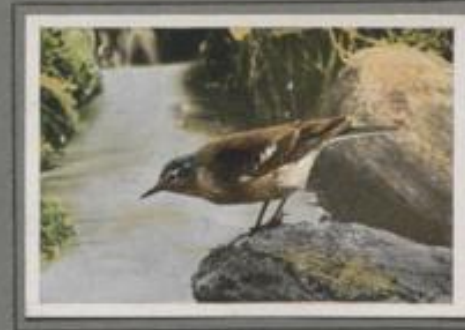
Der Wasserpieper (Anthus aquaticus)

In der Zeichnung des Gefieders ähnelt die Pieper den Lerchen. Nach ihrem Benehmen sind sie mit den Buchsteinen verwandt. Sie lieben das freie Gelände, nur der Baumpieper macht eine Ausnahme. Er siedelt sich am Waldrand und auf Waldhöfen an, kommt aber auch in Parks und Obstgärten. Sein Schrei ist laut und wohlklingend. „Zipp, zipp, zipp, zipp, da, da, da, da“, so erklingt's aus dem Buschwerk. Singend steigt der kleine Vogel schräg in die Luft, macht eine Wendung, und im Schwabfluge gleitet er wieder hinab ins Buschwerk.