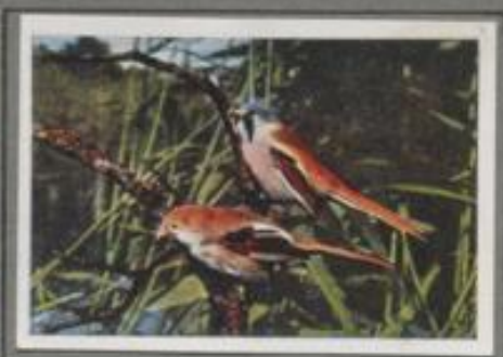
Die Bartmeise (Panurus biarmicus)

Im Gebet des rauchförmigen Feldahorns am Partorinsie hängt eine allerliebste Haschkugel mit weißlichem Eingang. Außen ist sie mit Flechten überzogen, innen mit Federn dick gepolstert. Zahn, zwölf junge Schwanzmeisen gieren in der Haschkugel, und die Alten kommen fleißig mit Futter. Wenn die Brut flügge, durchstreift die Gesellschaft das Gelände und ihr behes „Zitler“ kündet ihre Anwesenheit. Heute sind sie hier, morgen dort — sie umstehen Volk!