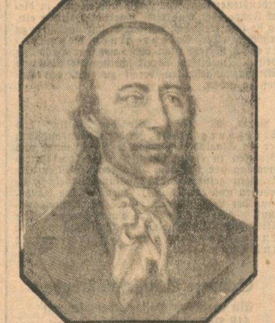
Johann Heinrich Voss.

Aus den verschiedenen Aufsätzen der Abiturientennummer der „Pyramide“ wird von selbst diese Mahnung herausklingen. Wenn die nun zu Jünglingen gewordenen Buben als vorerst störrige und wild dem Zwang entnommene Mautsel auch in der erhabenen Sicherheit des „Reifens“ alles besser wissen als die grämigen Alten, werden sie doch nach Jahr und Tag einschen, daß mit der „Freiheit“ der Zwang des Lebens erst anfängt.