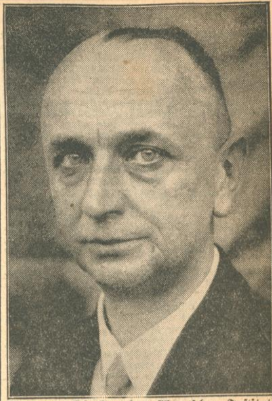
Der neue Direktor des Chemischen Instituts an der Technischen Hochschule.

Das Karlsruher Mutterhaus, für das das diesjährige Fest ein Markstein in seiner Geschichte ist, steht vor einer, durch die Verhältnisse besonders erschwerten Aufgabe: das Heim der Diakonissenanstalt ist alt, seine Reparatur kann es verzunnen; der Lärm der verkehrsreichen Söfienstraße, an der sogar das Operationszimmer liegt, wirkt störend. Alles drängt zu einem Neubau außerhalb der Stadt, wie einst das alte Haus außerhalb der Stadt gebaut wurde. Die großen Stiftungen sind bis auf einen kleinen Aufwuchs verschwunden. Möge darum die Liebe, die vom Haus ausgeht, neue Liebe wecken! Möge die Dankbarkeit für den Segen, der vom Haus ausgeht, mitwirken, daß der Neubau bald entrichtet werde aus Glaubensmut trotz allen Schwierigkeiten!