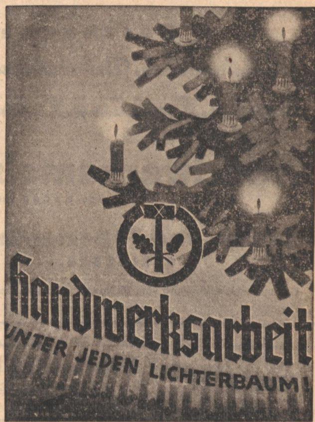
Mit Handwerksarbeit wird doppelt beschert — durch schöne Geschenke von bleibendem Wert

In jedem Werkstück, welches der Handwerksmeister aus den Händen gibt, steckt die Schönheit des handwerksmäßig bearbeiteten Werkstoffes und ein Stück seines meisterlichen Könnens. Man sagt: „Doppelt schenkt, wer persönlich schenkt“. Wodurch läßt sich dieser Satz besser verwirklichen, als durch ein schönes Stück handwerklicher Arbeit, welches ganz nach den persönlichen Wünschen und nach dem persönlichen Geschmack des Beschenkten gearbeitet ist. Aber auch nur der Handwerksmeister wird in der Lage sein, ein derart persönliches Geschenkstück anzufertigen. Der Kunde kann natürlich vom Handwerksmeister nicht verlangen, daß er eine Arbeit, an der er vielleicht 100 Stunden und mehr gearbeitet hat und für die er kostbares Material kaufen mußte, für wenige Mark aus der Hand gibt. Von „Billig“ und „Günstig“ sollte man hier gar nicht reden: „Preiswert“ ist gute Handwerksarbeit stets, wenn wir von ihr mit Stolz sagen können: hier habe ich etwas Einmaliges, Dauerhaftes, ein besetztes meisterliches Wert, das Leben atmet und immer neue Freude spendet. Darum weg mit dem alten Irrtum, daß sich Handwerksarbeit nicht jeder leisten kann. Die Schausenster des Handwerks während der Weihnachtszeit werden jeden belehren, daß auch das Handwerk viele schöne, praktische und dauerhafte Dinge zu einem erschwinglichen Preis herstellt.