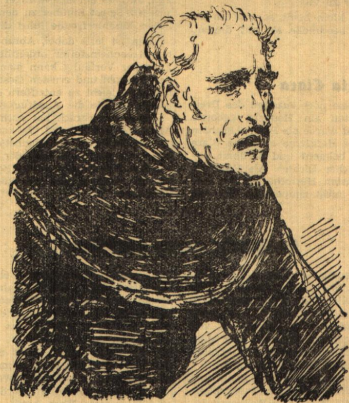
ABRAHAM A SANCTA CLARA Zeichnung: Hans Sauerbruch