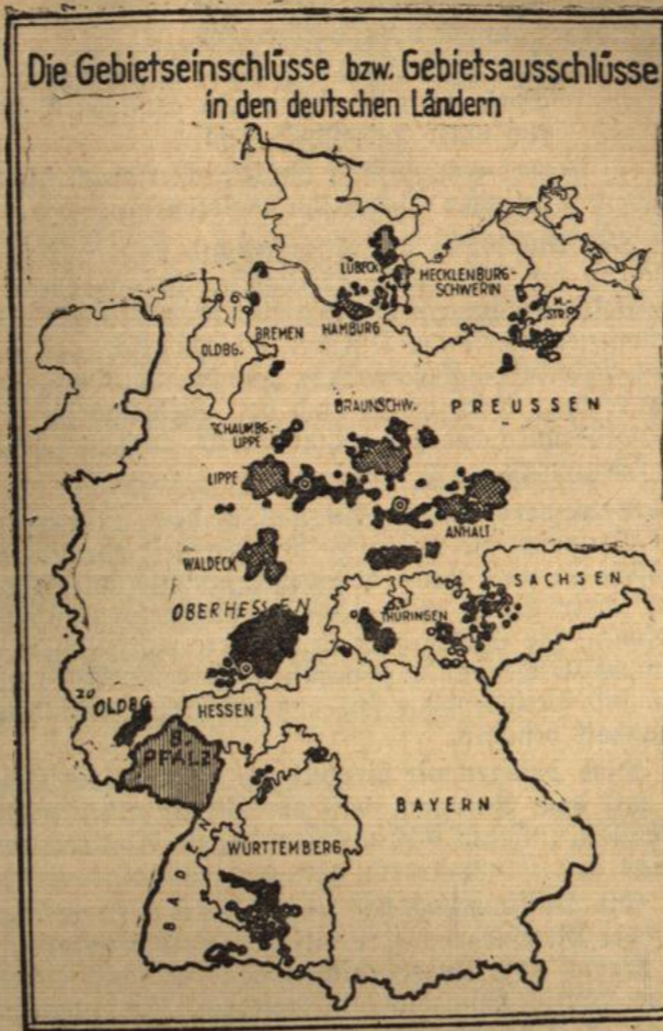
Die deutsche Republik besteht nicht nur aus 18 Ländern, es gibt in Deutschland mit allen Enklaven und Exklaven rund 250 Gebietsfetzen. Selbst diesen unmöglichen und unerträglichen Zustand zu beilegen. Arbeitet mit an der Schaffung des dezentralisierten Einheitsstaates.