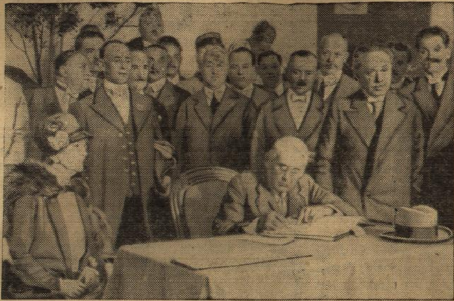
Der Vater des Paktes, der Amerikaner Kellogg, trägt sich bei seiner Ankunft in Le Havre mit dem vom Bürgermeister gestifteten goldenen Federhalter in das Buch der Stadt ein.