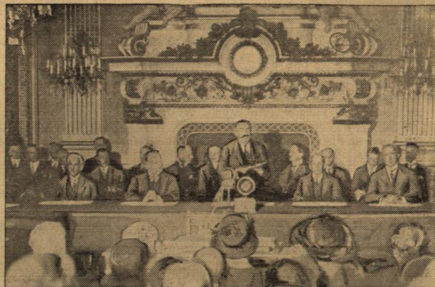
Außenminister Briand bei seiner Ansprache vor der Unterzeichnung des Paktes im Uhrensaal des Quai d'Orsay. Rechts neben ihm Stresemann.