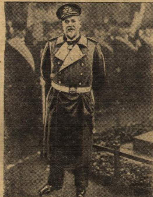
Der bekannte Verteidiger von Tjingtau starb im Alter von 64 Jahren in Bad Kissingen. In aller Erinnerung ist noch sein historisches Telegramm von seinem verlorenen Posten bei Ausbruch des Krieges an den Kaiser: „Einstehe für Pflichterfüllung bis zum Neuesten.“