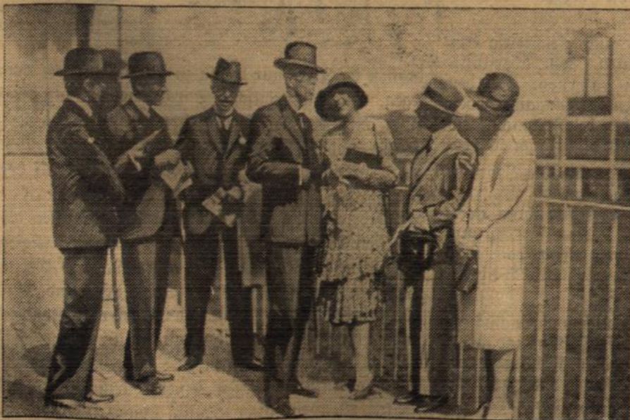
Auch in diesem Jahre wieder besuchte König Gustav V. die Rennwoche in Baden-Baden. — Unser Bild zeigt den König auf dem Rennplatz von Iffezheim im Gespräch mit Frau Haniel.