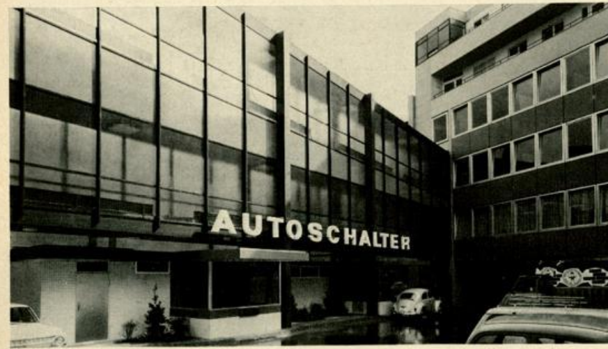
Am Steuer bedient werden — Autoschalter am Douglashof

Moderne Einrichtungen der Sparkasse für die Erfordernisse unserer Zeit