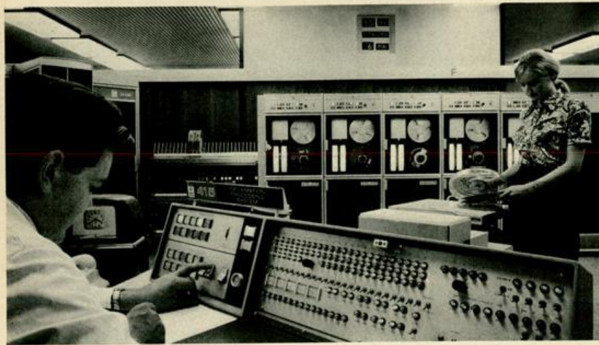
Das Rechenzentrum der Sparkasse — eine General Electric 415