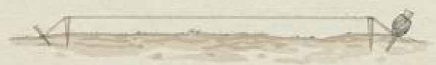
Fig. 5 Nach \frac{1}{2} der natürlichen Größe.