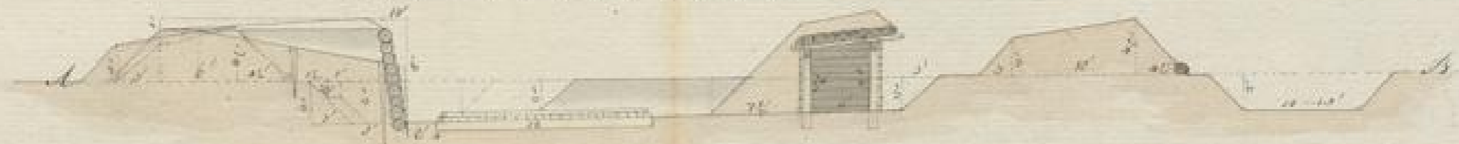
Maßstab zum Querschnitt im 6ten Liniens = 1"