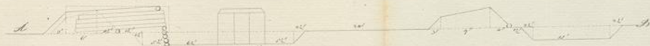
Aussicht zum Durchschnitt, wo 6 parallel Linien = 12