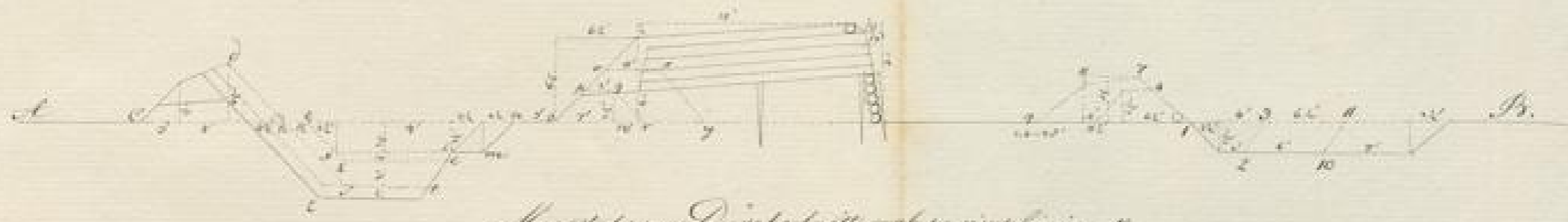
Maassstab zum Durchschnitte, wo 1 pariser Linie = 1"