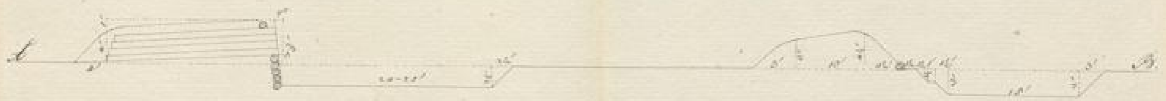
Maßstab zum Durchschnitt wo 6 pariser Linien = 1"