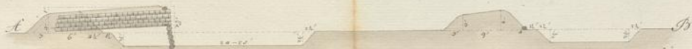
Plan der Batterie Durchſchnitt von 6 parisiſchen Linien = 1 l