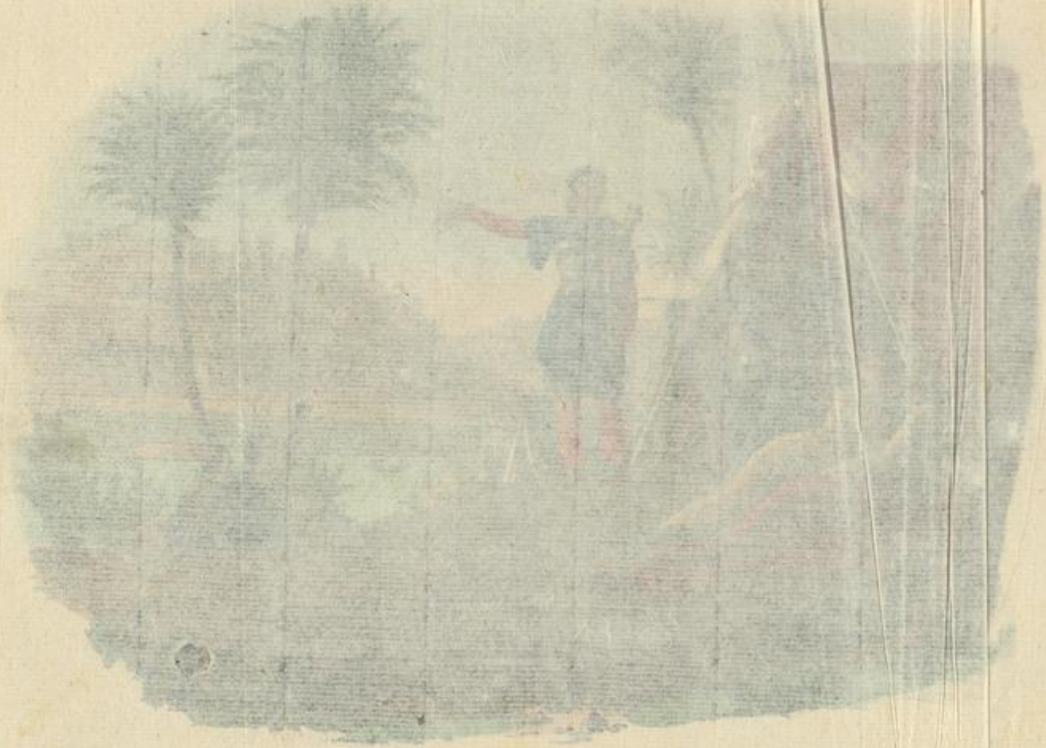
LE CHANT DU RÉVEIL.