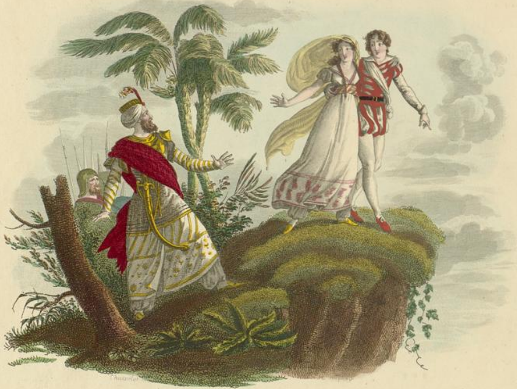
LE ROCHER DES DEUX AMANS.