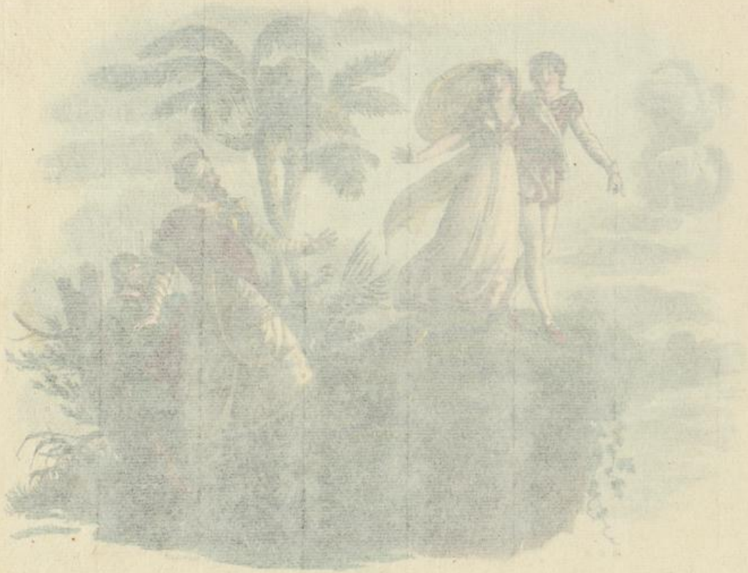
LE ROCHER DES DEUX AMANS.