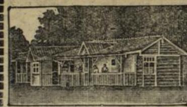
Partie aus dem Familienbau Natürliche, zwanglose Lebensweise. — Ideale Gelegenheit zur körperlichen und geistigen Erholung. — Alle Arten von Bädern. — Pension pro Woche Mk. 35.—. Prima Referenzen. — Aufnahme jederzeit. — Anmeldungen rechtzeitig erbeten. — Näheres Prospekt Nr. 4 durch die E.932 Direktion Carl Mauz, „Schwäbischer Jungborn“, Bahnhof Nürtingen a. N.