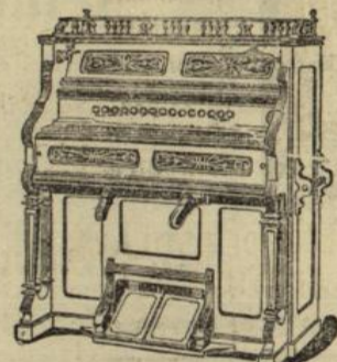
Harmoniums von 80 M. an

Miete unter voller Anrechnung der bezahlten Beträge bei event. Kauf.