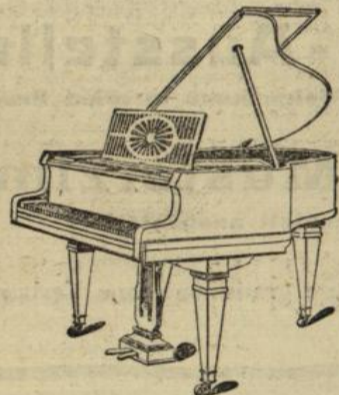
Flügel von Mk. 1200 bis Mk. 2500

H. MAURER GROSSH. HOFL. PIANOHANDLUNG :-: PIANOFORTEBAU- UND REPARATUR-ANSTALT KARLSRUHE i. B. Telefon 1653 Friedrichsplatz 5