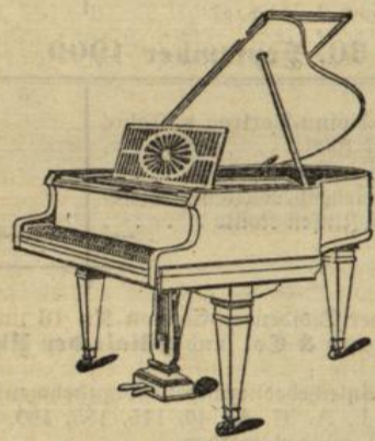
Flügel von Mk. 1200 bis Mk. 2500