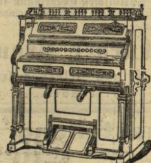
Harmoniums von 80 M. an