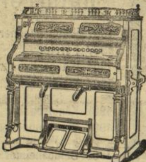
Harmoniums von 80 M. an