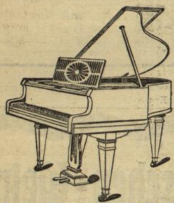
Flügel von Mk. 1200 bis Mk. 2500

H. MAURER GROSSH. HOFL. PIANOHANDLUNG :-: PIANOFORTEBAU- UND REPARATUR-ANSTALT KARLSRUHE i. B. Telefon 1653 Friedrichsplatz 5