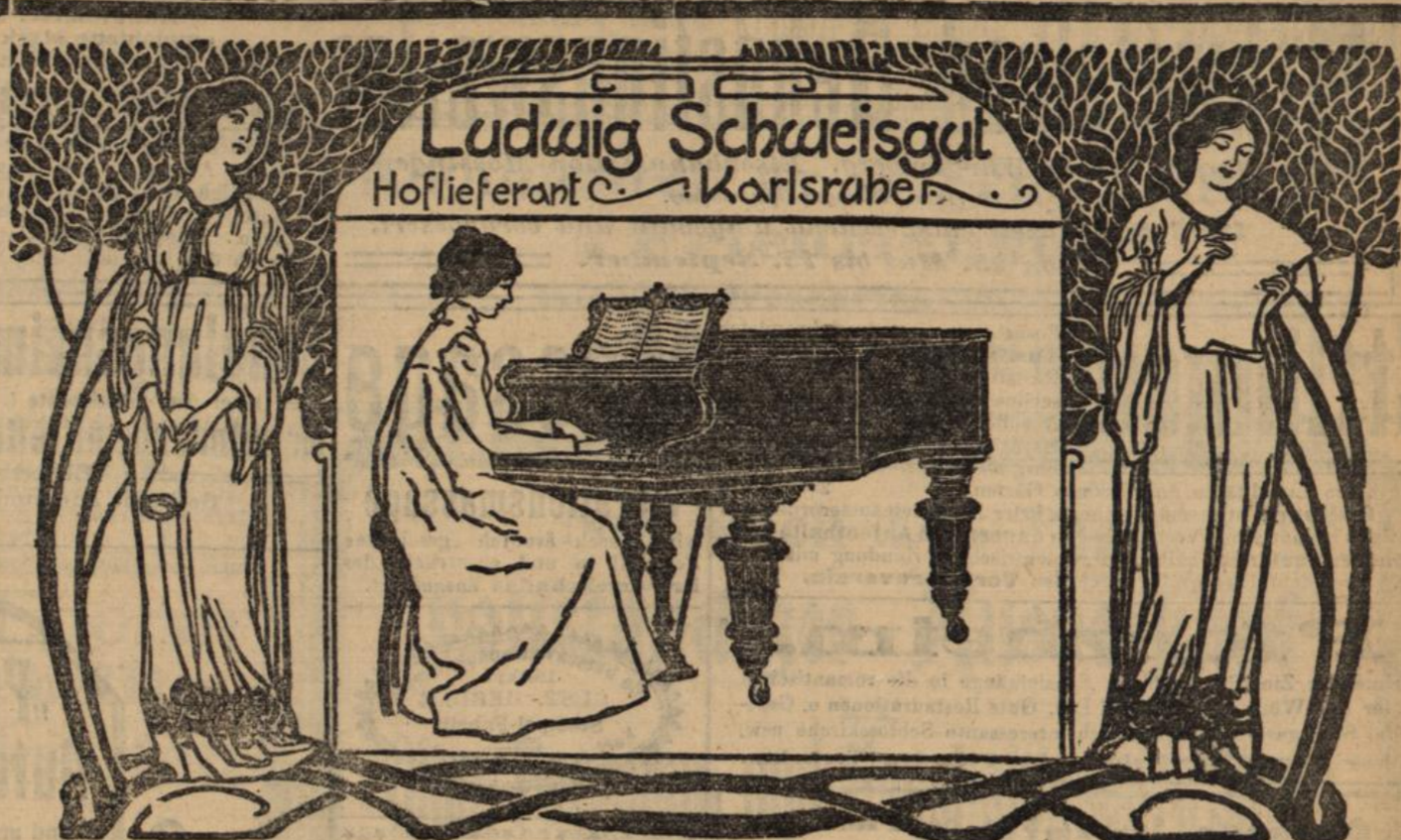
Entwurf von Maler Hellmuth Eichrodt.

Anlässlich seiner Vorträge über das wichtige Thema: „Verdauung und Nervensystem“ ist derselbe für Rathbedürftige bis Samstag in Heidelberg, Schiffgasse Nr. 2, II, Zimmer Nr. 8, zu sprechen. Seine Werke „So werdet Ihr alt!“ (3,50 Mk.) und „So sollt Ihr essen!“ (3,00 Mk.) genießen einen Weltruf und sind gegen Einsendung von 7 Mk. postportofrei von Simoni zu beziehen, später aber von G. Simonis Verlag, Feitritsch-Masburg, Steiermark. 5092a