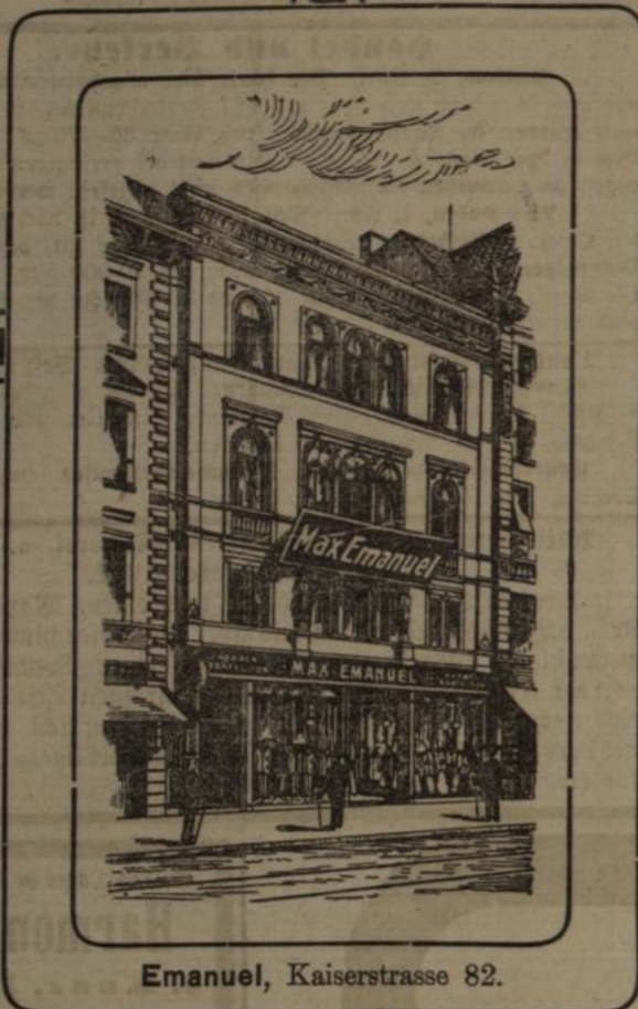
Emanuel, Kaiserstrasse 82.