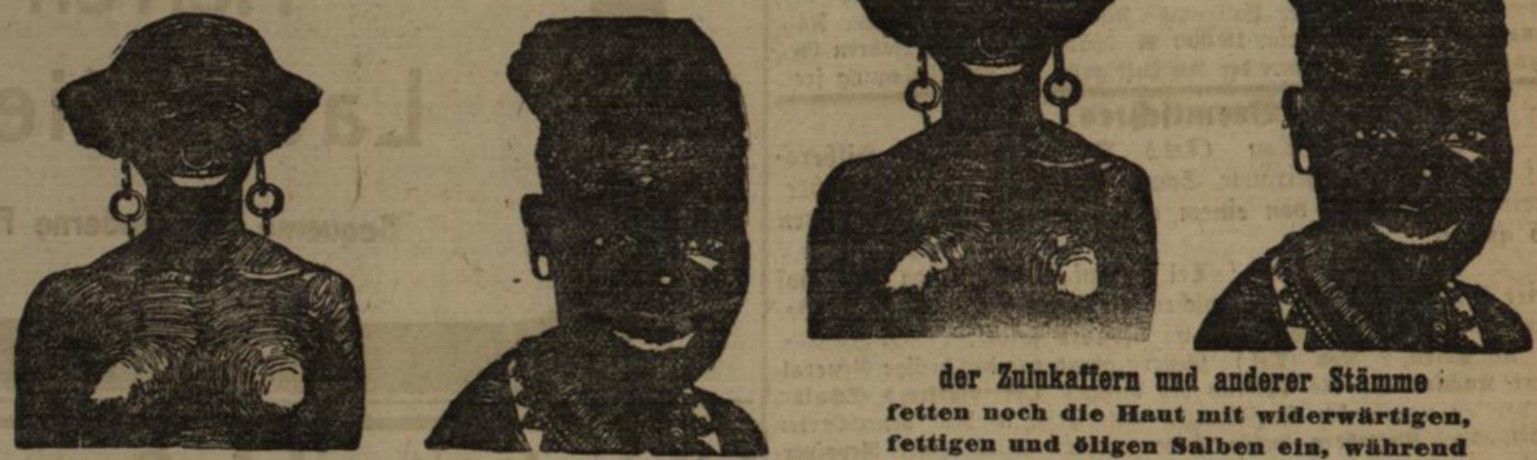
der Zulu-Kaffern und anderer Stämme fetten noch die Haut mit widerwärtigen, fettigen und öligen Salben ein, während