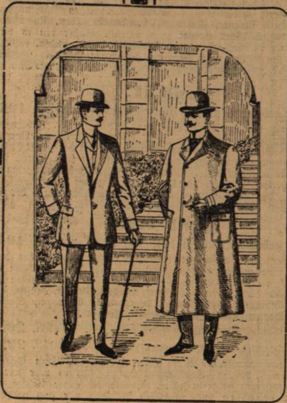
Für korpulente und schlanke Herren genau Passendes!