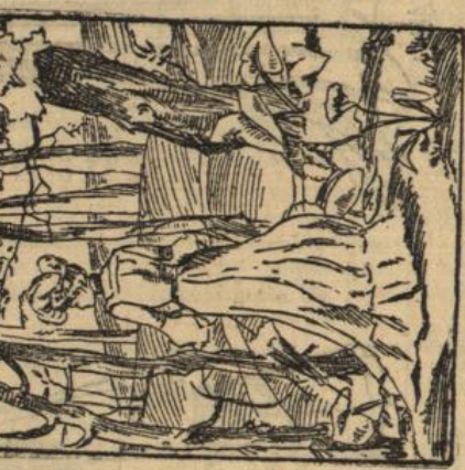
Wo nur der Leutnant bleibt? Heber den Anstand kann er nicht schreiben, Doch hilft er, das Korn aus der, Wehren zu weihen.