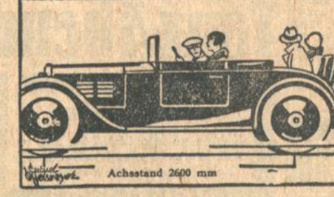
Der rassistige DKW-Roadster mit roter oder grauer Lederbespannung.

Roadster . . . . . M. 2285.- Cabriolet . . . . . M. 2495.- Lieferwagen . . . . . M. 2850.-