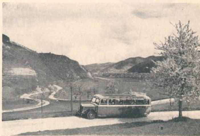
Im Kinzigtal bei Viberach

bei allen Postanstalten, in Karlsruhe: beim Postamt 1, Kaiserstraße 217 Zimmer 80, Fernruf 7086 oder beim Reisebüro Karlsruhe AG, gegenüber der Hauptpost Fernruf 7240 und 7241