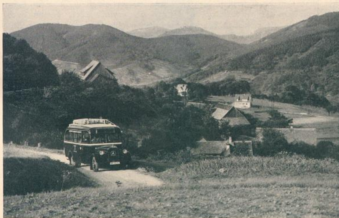
Bei Neufajeth Amt Bühl (Baden)

Besonders empfehlenswert sind Reisen mit den Fernkraftposten in den Schwarzwald, an den Bodensee und in die Alpen