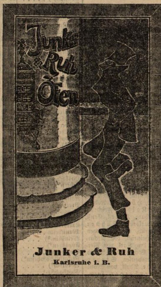
Junker & Ruh Karlsruhe i. B.

Eintrittspreis per Person . 50 Pfennig. Kinder und Militär . . . 25 Pfennig.