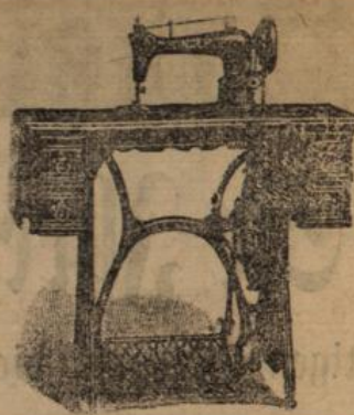
Paris 1900 „Grand Prix“ Höchste Auszeichnung.

Spielwaarenhaus, Steinach, S.-M., Rückert & Cie., Thüringen. 6908a.8.2