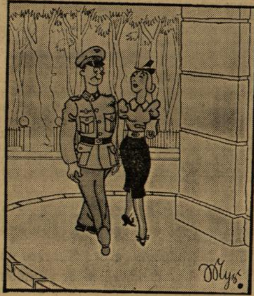
„Wer war denn das, Fritz, den du da eben gegrüßt hast?“ „Ein General!“ „Ach, mit so hohen Herren verkehrt du?“

„Ist so etwas nicht rührend und spricht es nicht Hände? Und das ist's, was Heinz Goedecke so freut und ihn stets mit neuer Liebe ans Werk gehen läßt.“