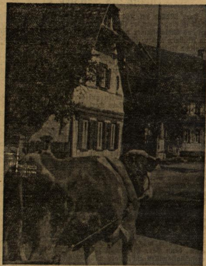
Dorfstraße im Hanauerland (Archivaufnahme)

1. Gallingen: Gute Obsternie. Wie die Bezirksabgabestelle bekennt, ist die Kernobsternie im ganzen Ge-