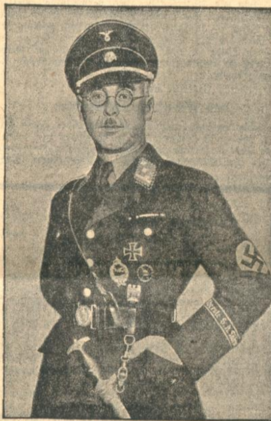
Neue Rangabzeichen der SS.-Führer.

„Die Pfalz im neuen Reich“, so nennt sich eine Ausstellung im Europahaus zu Berlin. Die Schau weist viele interessante Gegenstände, Karten, Akten usw. auf, die ebenso die historische Bedeutung der Pfalz wie ihre Gegenwartsgeltung im neuen Reich darstellen. Unser Bild zeigt ein Riesenfaß mit künstlerisch geschnitztem Boden, das für König Ludwig II. von Bayern als Verlobungsgeschenk angefertigt worden war.