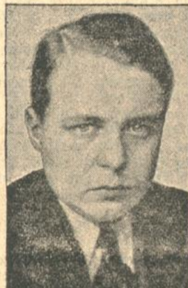
Der stellvertretende Reichsjugendführer.

Auf der Grünen Woche 1934 zu Berlin werden 2000 Bauern aus allen Gauen Deutschlands in ihrer malerischen Tracht vor der aufgebauten Szenerie eines deutschen Marktplatzes allabendlich ihre Festbräuche und ihre Festtänze vorführen. Unser Bild zeigt einen Hochzeitszug der Wendländer.