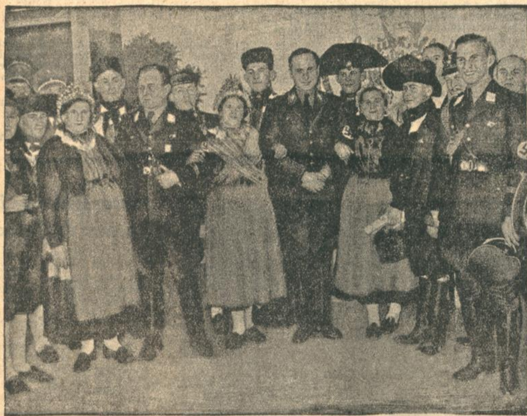
Der erste Reichsbauerntag.

Reichwehrsoldaten suchten in tagelanger Arbeit zwei ihrer unglücklichen Kameraden, die in eine Lawine gerieten und erst am Samstag morgen geborgen werden konnten.