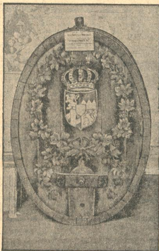
„Die Pfalz im neuen Reich“.

Die größte Dieselanlage der Welt, die unser Bild zeigt, besitzt das Oersted-Elektrizitätswerk in Kopenhagen.