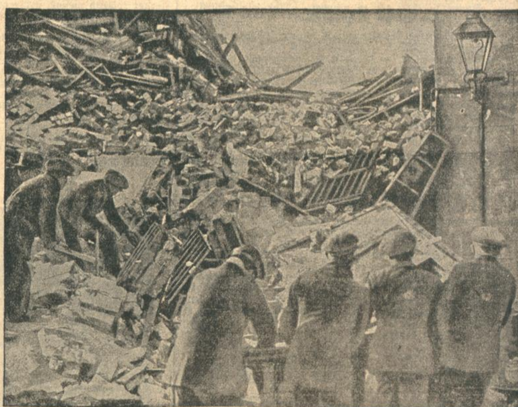
Hauseinsturz in Hull.

In Weimar wurde der erste deutsche Reichsbauerntag eröffnet. Auf unserm Bilde sehen wir den Reichsbauernführer und Reichsernährungsminister Darré inmitten deutscher Bauern in ihren Volkstrachten.