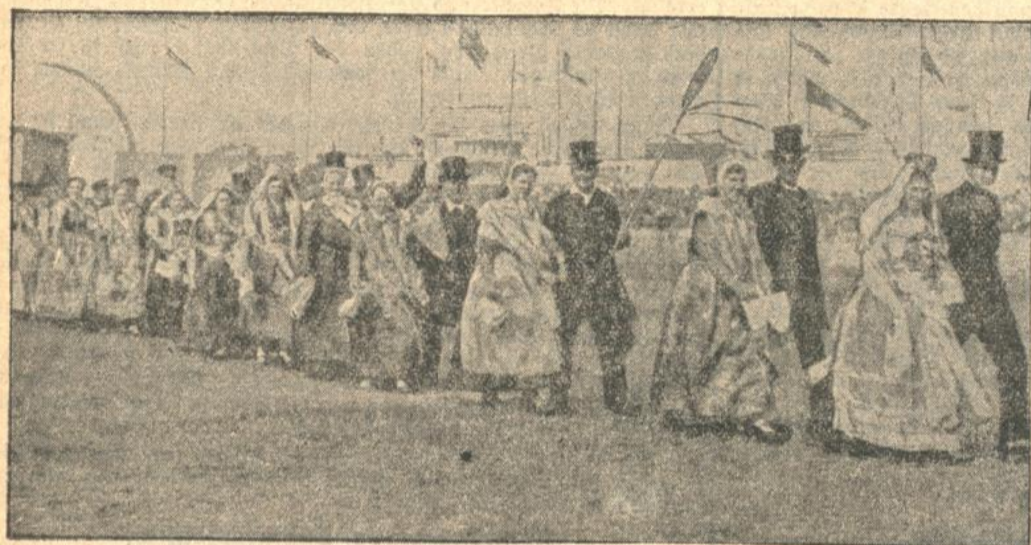
2000 Bauern in Volkstracht zur Grünen Woche.

Auf der Grünen Woche 1934 zu Berlin werden 2000 Bauern aus allen Gauen Deutschlands in ihrer malerischen Tracht vor der aufgebauten Szenerie eines deutschen Marktplatzes allabendlich ihre Festbräuche und ihre Festtänze vorführen. Unser Bild zeigt einen Hochzeitszug der Wendländer.