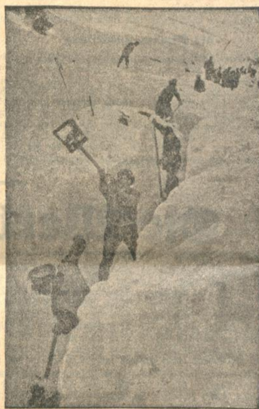
Das Lawinenunglück in den bayerischen Alpen.

Nach einem Erlaß des Stabschefs Röhm tragen künftig die in den Stab des obersten SA.-Führers versetzten SS.-Führer an dem linken Unterarm einen schwarzen Ärmelstreifen in silberner Stickerei mit der Bezeichnung „Oberste SA.-Führung“.