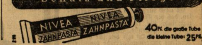
40% die große Tube die kleine Tube: 25%