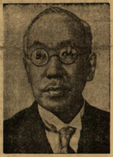
Matsumoto: „Sicherung des Lebensraumes für alle Völker das Ziel des Dreierpaktes“

Der japanische Außenminister Matsumoto (unten Bild), der in seiner Rede, die er in der Eröffnungssitzung des japanischen Reichstages hielt, grundlegende Ausführungen über die Außenpolitik Japans und über die Stellung seines Landes im Rahmen des Dreierpaktes machte.