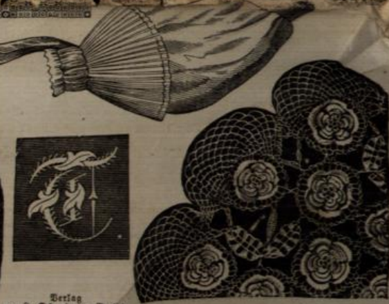
Verlag von E. Scherfer in Berlin.