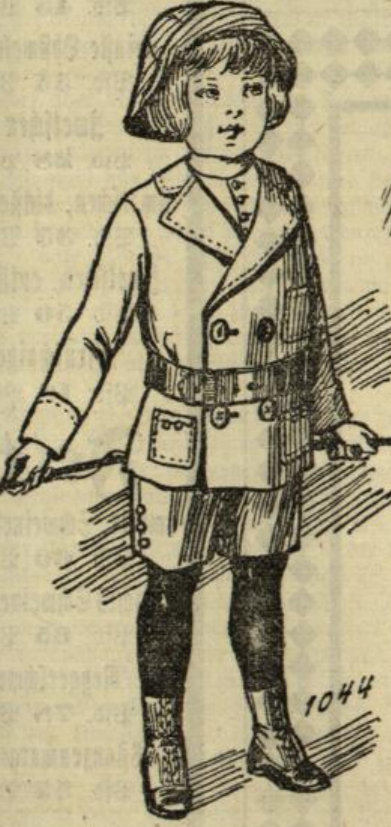
1044. Anzug für Knaben von 4 bis 5 Jahren.