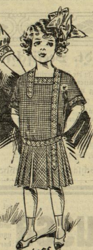
1055. Kleid aus schwarz-weiß kariertem Stoff für Mädchen von 5-7 Jahren.

Schnittmuster zu sämtlichen Abbildungen in den Nummern 44 und 46, für Kinder in den angegebenen Altersstufen, sind zum Preise von je 35 Pf. durch unsere Expedition zu beziehen.