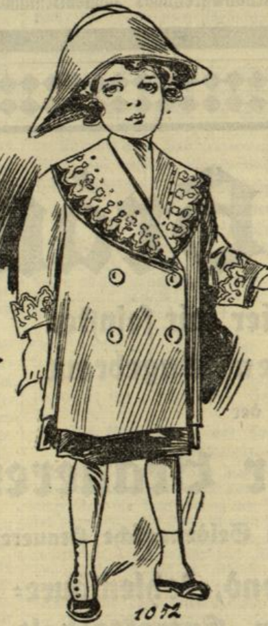
1052. Frühjahrsmäntelchen mit Stickerkragen und Aufschlägen für Mädchen von 5-7 Jahren.