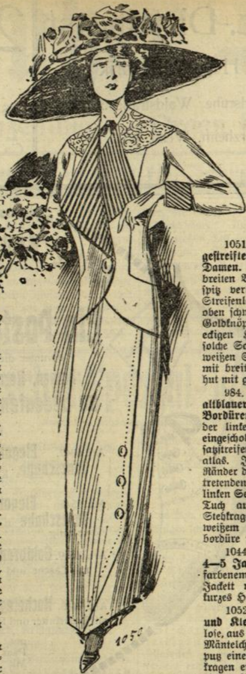
1050. Frühjahrskostüm aus beigefarbenem Granit mit schwarz-weißen Revers und Spitzenkragen. Zum Aufenthalt im Süden.

Wahr eine kleine Weile kann der Winterhut sich noch seines Daseins freuen, denn was man jetzt von seinen Sommerkollegen nicht, das hält sich noch hinter den Glascheiben der Ausgeschäfte auf, oder genießt süßliche Frühlingssonne am Mitteländischen Meer. Die große Mode-ungebilde, eine der nervösen Krankheiten des 20. Jahrhunderts, tummelt sich allerdings kaum mehr um die Stalenderjahreszeiten, sondern schaffte sich selbst noch etliche Zwischenetappen, die alle spezielle Anforderungen an den Toiletten- und Hutbestand ins Leben rufen. Diese Zwischenstufen werden mit „Uebergang“ bezeichnet. Eine feine Nuance, die sich die elegante Dame, die etwas auf sich hält, nicht entgehen lassen kann, ist aber der Uebergang zum Uebergang. Auf diese Weise rollt sich der goldene Faden der Mode niemals ab und die Neuheiten strömen den Partikeln ohne Ende zu.