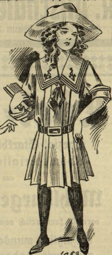
1053. Matrosenkleid aus blauem Cheviot für Mädchen von 9-11 Jahren.