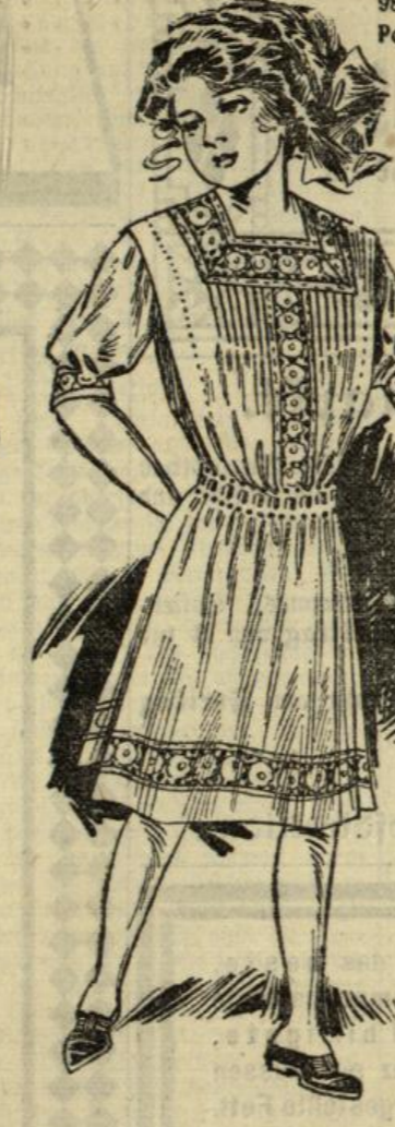
1054. Festkleid aus weißem Voile für Mädchen von 10 bis 12 Jahren.