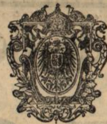
D. R. P. 124 132