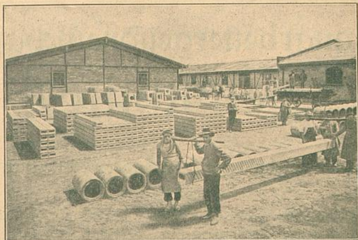
Hohlbalkenlager in der Fabrik Karlsruhe-Mühlburg