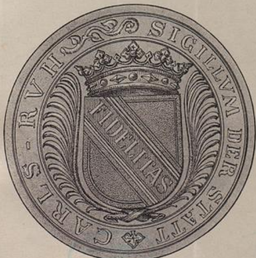
Das älteste Siegel der Stadt Karlsruhe auf einem Kaufbriefe im Gr. Grenzlandesarchiv vom 17. September 1751, Ankauf eines Hauses für den Hofprediger in der Durlach- Mühlburger Straße betreffend.

Die vorstehende Skizze, einer größern Spezialkarte der Umgebung von Karlsruhe entnommen, stellt die Terrainverhältnisse aus dem Jahre 1750 dar, also aus einer Zeit, in welcher weder der neue Steinschiffkanal, der Landgraben, noch die gerade Straße mit der Pappelallee zwischen Karlsruhe und Durlach vorhanden waren, welche beide aber durch die eingezeichnete Doppellinie angedeutet sind. Die alte Straße von Durlach her führt nicht mehr über Mintheim, sondern auf das sogen. Mintheimer Sträßle, und von hier, wo die drei Schlagbäume standen, nördlich an Gottsau vorüber an das Durlacherthor. Westlich von Gottsau steht noch an der Straße das alte Jägerhaus, und nach Mühlburg zu, links gegen den Landgraben hin, der alte Galgen, dessen Stelle noch in den zwanziger Jahren als Nichtstätte diente. (S. S. 202–204).