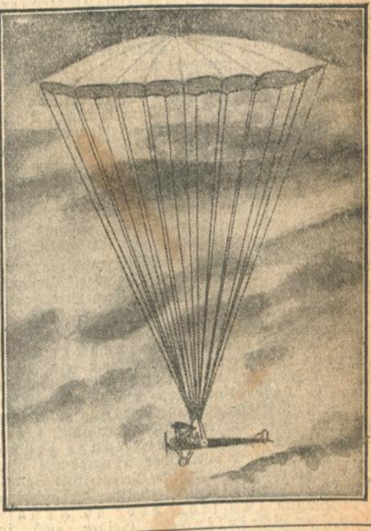
Unser Bild zeigt den geöffneten Fallschirm mit dem schwebenden Flugzeug.

Der Kleingrundbesitzer, der mit ganz besonderer Liebe an jedem einzelnen seiner Tiere hängt, kann in der Gelpelzierzucht ganz hervorragendes leisten.