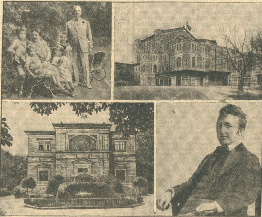
Oben: Aus glücklichen Tagen. Siegfried Wagner im Kreise seiner Familie. Unten: Villa Wahrdorf in Bayreuth, der Wohnsitz Siegfried Wagners.