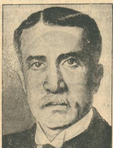
Der bisherige Staatspräsident von Peru, Leguia.