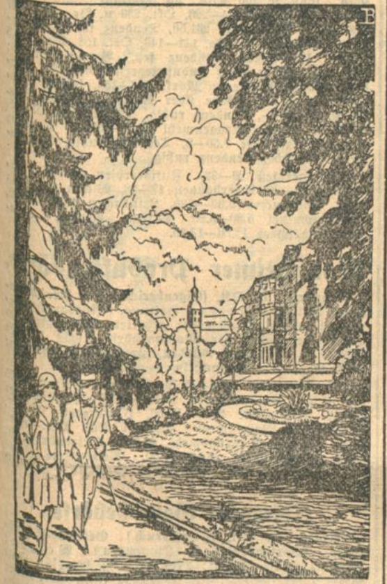
Herbstspaziergang an der Oos.

Der Sommer, die Hochzeit der Bäder und Sommerfrischen, ist knoch out — es lebe der Herbst und das Wandern! Mit dem Bläuen der Ernte beginnt die Spätsommer- und Herbstwanderzeit. Ist in der erschöpfenden Glut des Juli und der ersten Augusttage das Wandern oft ein zweifelhafter Genuss, so wandert es sich umso besser an den kühleren und reineren Tagen des Spätsommers und Herbstes. Ja, nun müssen wir wieder wandern! Spätsommer und Frühherbst ist noch nicht die Zeit, um hinterm Ofen, die Pipelmütze über den Ohren, dem Winterstiefel entgegenzudröseln! Die Tage sind zwar merklich kürzer geworden, doch immer noch lang genug für einen gut aus-