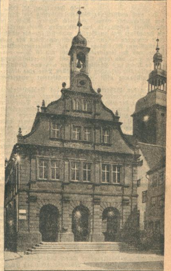
Das Rathaus in Buchen.

Um die Laube des gemütlichen Gasthofes in Buchen rankt sich purpurn der wilde Wein. Der altersgraue Turm steht breitbeinig drüben, neben der stillen Madonna, die umspielt ist von später, milder Sonne. Zwischen den Fachwerkbauten der kleinen Stadt fliegen die letzten Schwalben, und auf den Dächern sitzen wie Rotenköpfe ihre schon wanderbereiten Gefährten. Fuhrwerke, mit schwerfälligen, dem Abtismus einer verklungenen Zeit verfürpernden Kühen bespannt, kommen vom Felde heim, schwerbeladen mit duftendem Heu. Um die Madonnenhäule stehen die Menschen im Gespräch. Es ist Abend. Abend des Tages, Abend des Jahres. Nach Untereudorf wandern wir und rasten an einer Begeete, wo der Blick sich ausbreitet