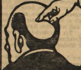
Das Beste für die Haare

Füchtiger, b. d. Droge u. Kolonialm.-Handel gut eingef.