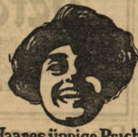
Haares üppige Pracht

Javol hat gesiegt Javol hats vollbracht Ihm dank ich des