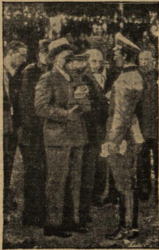
Die feierliche Ueberreichung des Mussolini-Pokals

Nachdem Pfarrer Rest gegen einen Sittlerjungen in Uniform in der Kirche tödlich vorgegangen war, sah sich die hiesige Parteileitung veranlaßt, wahrheitsgetreue Meldung an den Kreisleiter zu machen. Dieser veranlaßte durch das Innenministerium Schutzhaft gegen den Geistlichen, da eine