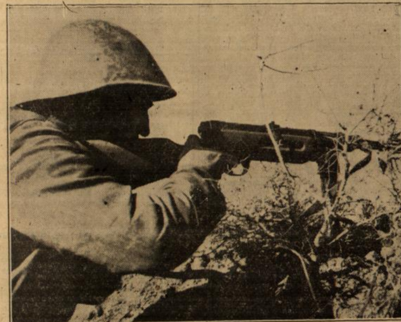
Ruhig und fest steht der rumänische Soldat an der MP.