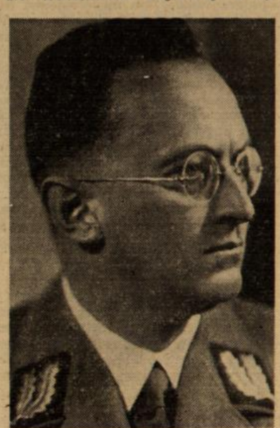
Reichsstatthalter Henlein.

Nach dem Verbot der NSDAP. und der Deutschen Nationalpartei durch die tschechische Regierung erließ